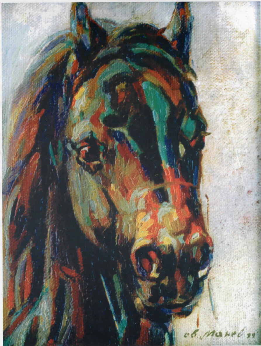
Свето Манев "Коњ", масло Награда на КИЦ "Методија Ивановски - Менде"