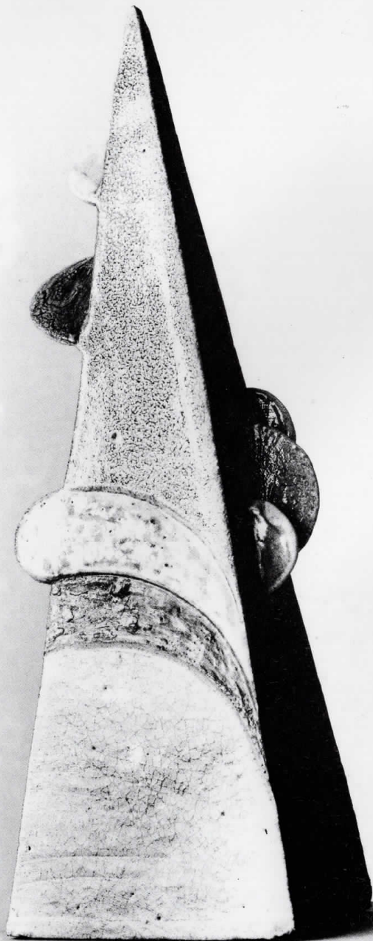
ПИРАМИДА - логичност II 1985 глазура 38 x 12

адреса: ул. „Македонија“ бр, 34/18 Кавадарци - Република Македонија