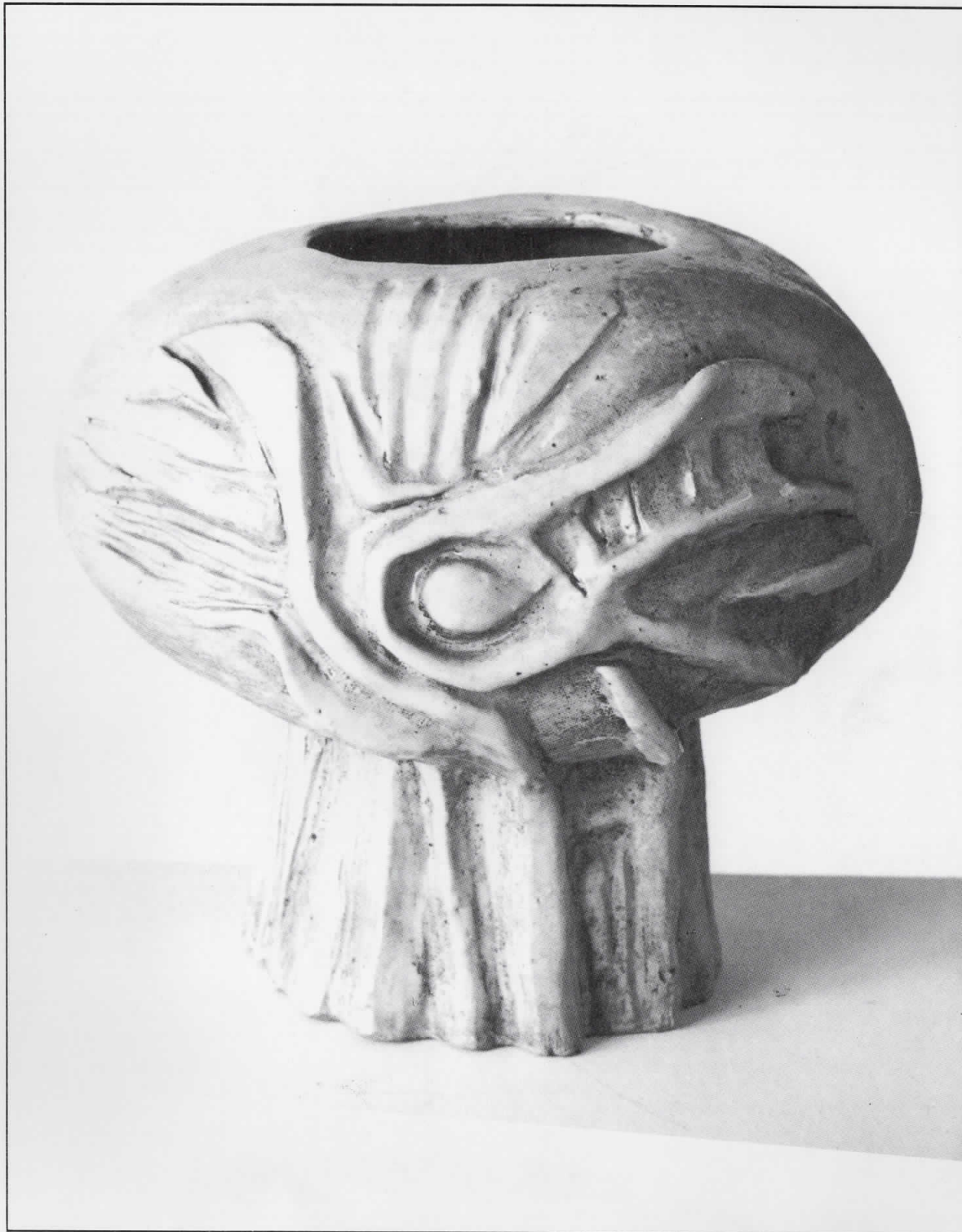
ВАЗА 1980. мајолика 21 x 27

Родена 1946 година во с.Елевци – Дебар. Завршила Академија за применета уметност. адреса: ул. „Даутица“ бр.15–а Скопје – Република Македонија