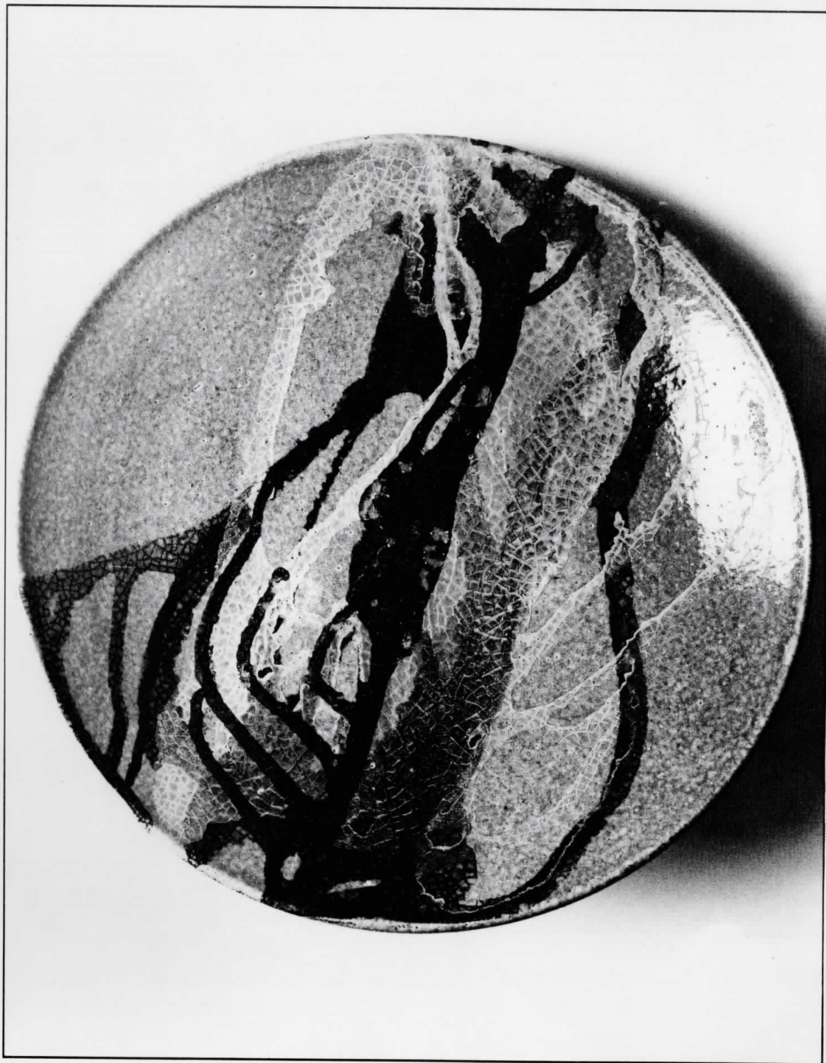
ЧИНИЈА 1979. глазура пречник 35

Родена 1954 година во Скопје. Завршила Училиште за применета уметност во Скопје. адреса: ул. „Наум Охридски“ бр. 24 Скопје - Република Македонија