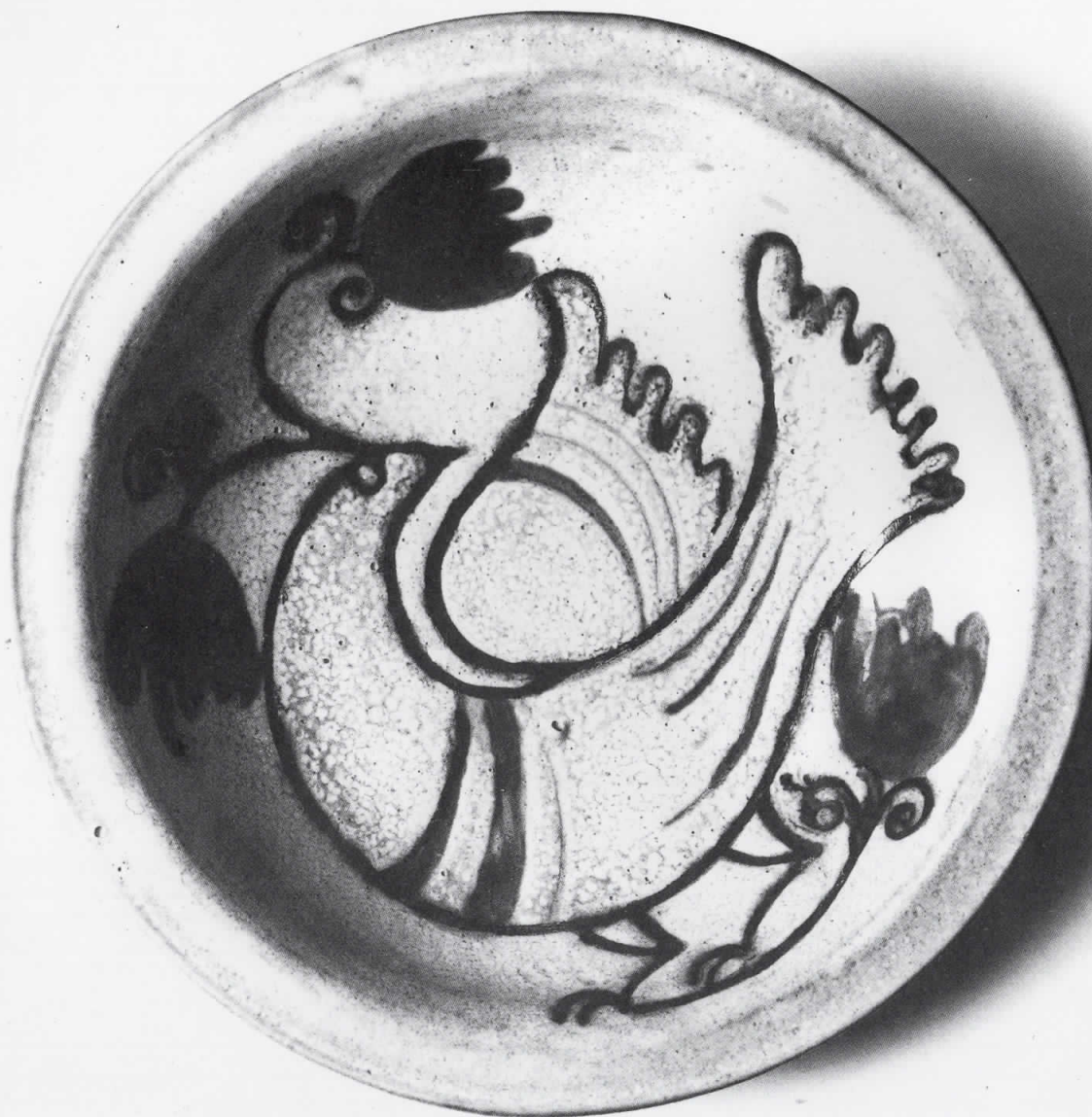
ЧИНИЈА СО ОРНАМЕНТИ 1975. глазура пречник 35

Родена 1947 година во Полгарди – Унгарија. Завршила Академија за применета уметност во Будимпешта. адреса: ул. „Август Цесарец“ бр. 12/1–10 Скопје – Република Македонија