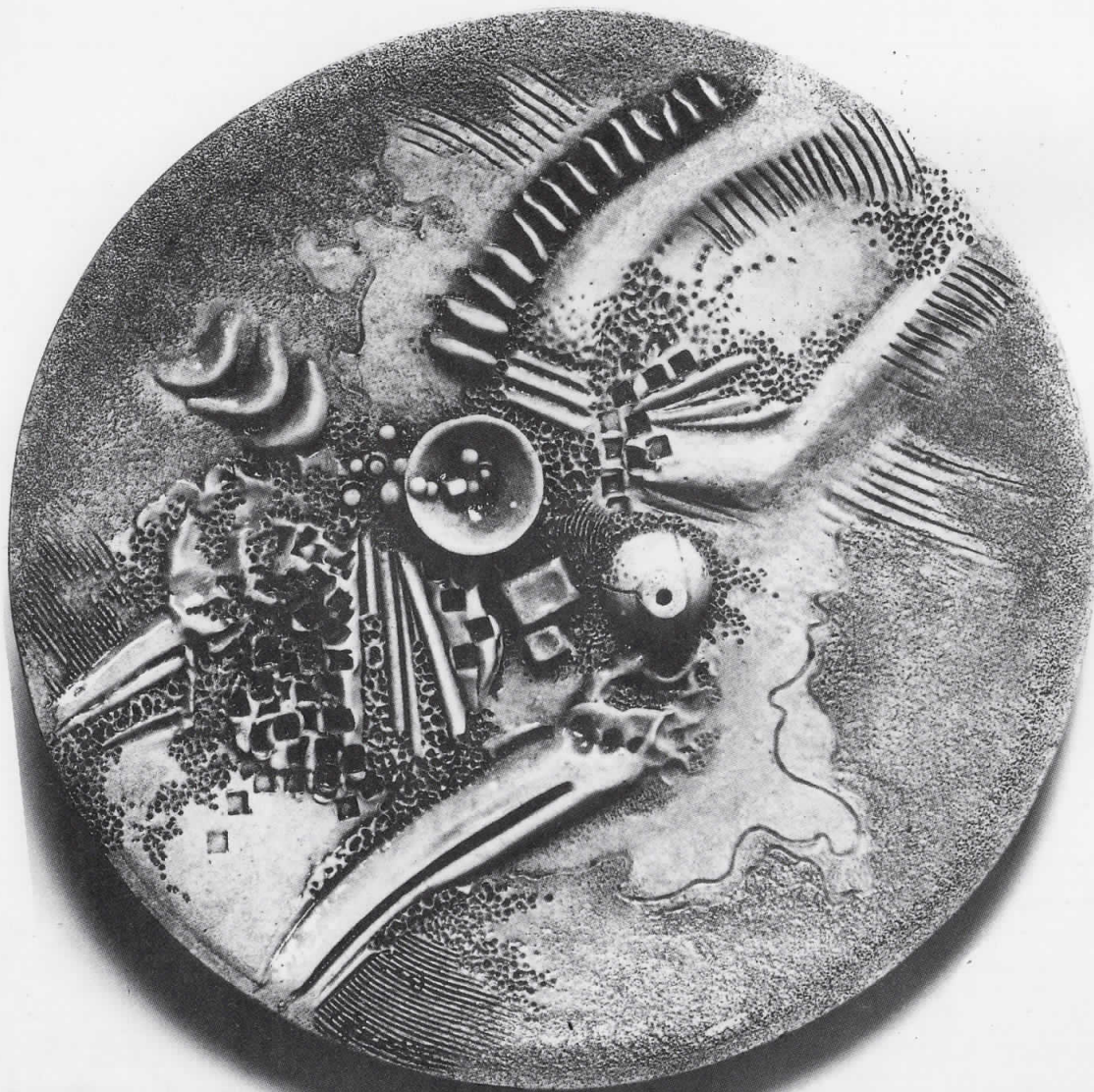
РЕЛЈЕФНА ЧИНИЈА 1986. глазура пречник 51

адреса: Булевар АВНОЈ 106 III/24 Скопје – Република Македонија