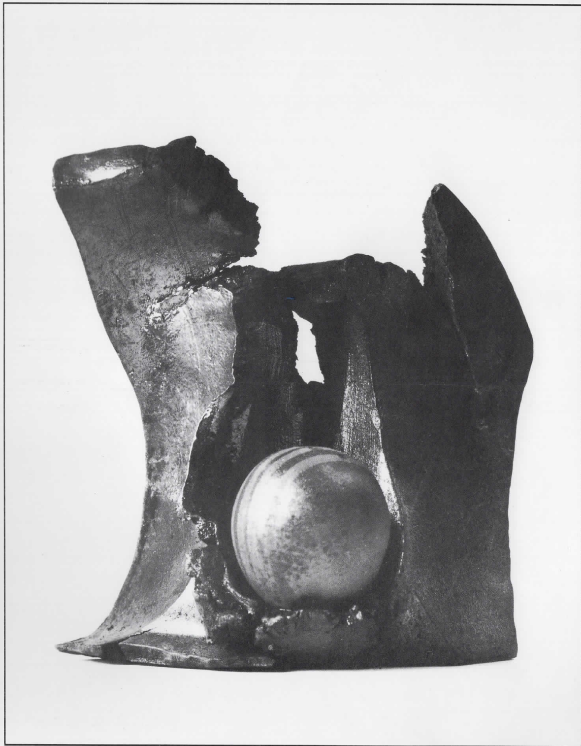
СЕМКА НА РАЃАЊЕ 1991. глазура 20 x 14

Роден 1939 година во с.Стојаково. Завршил прв степен на Академија за применета уметност. адреса: ул.„Руди Чајевац“ бр. 4/1 Скопје – Република Македонија