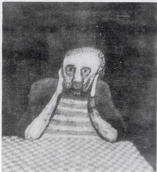
MURJOTTAJA (Snuzdeni) SEPPO MATTINEN