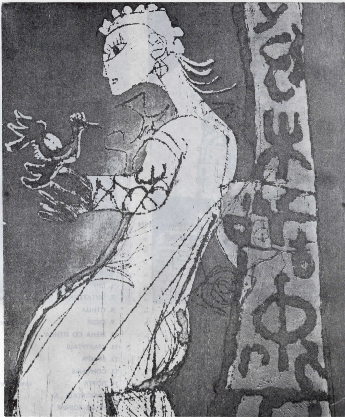
Д. Малиданов: „Жена со птица“