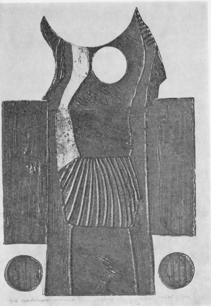
Д. Биков: „Птица“