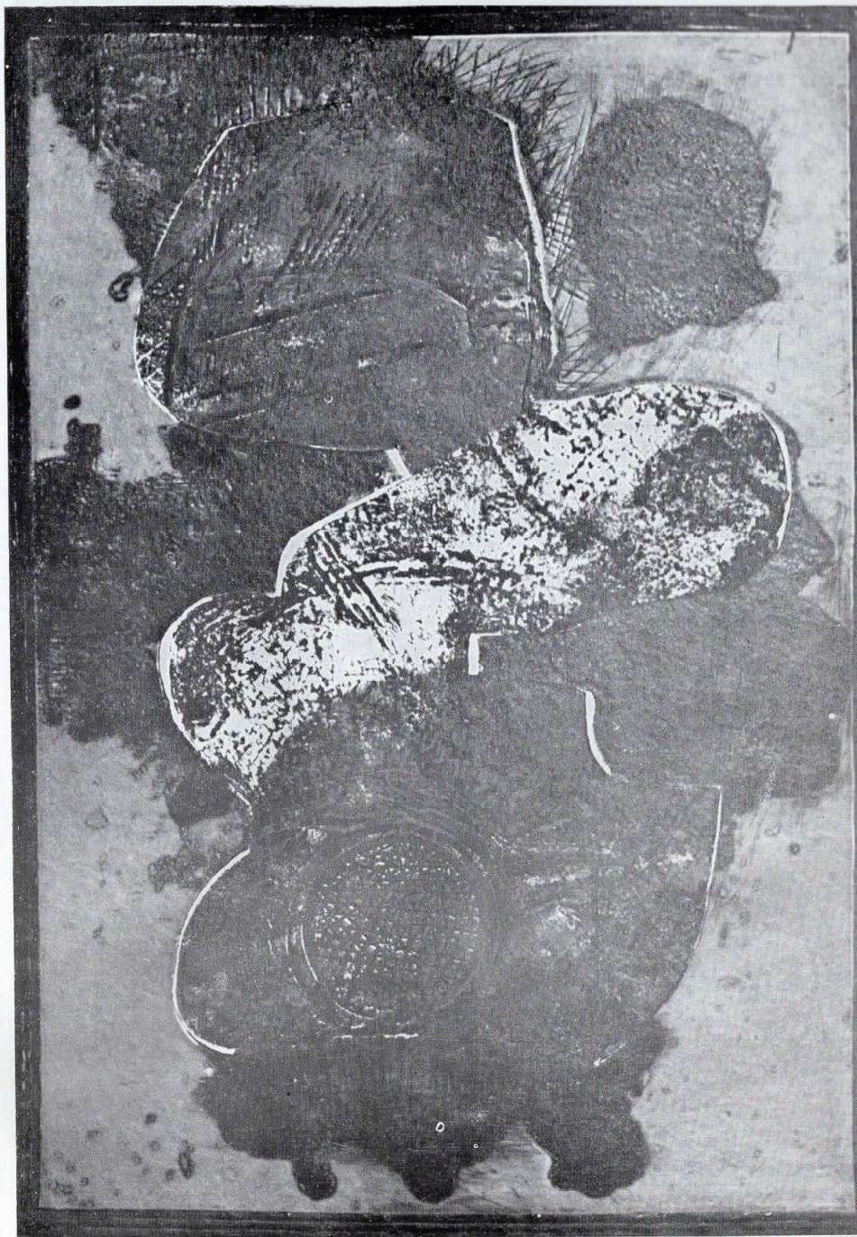
Д. Биков: „Озрачување“