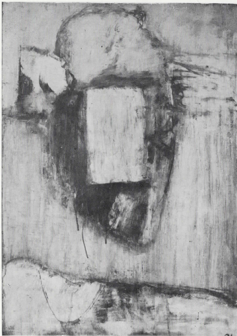
ПРИБЛИЖУВАЊЕ КОН ИЗВОРОТ НА СВЕТЛОСТА