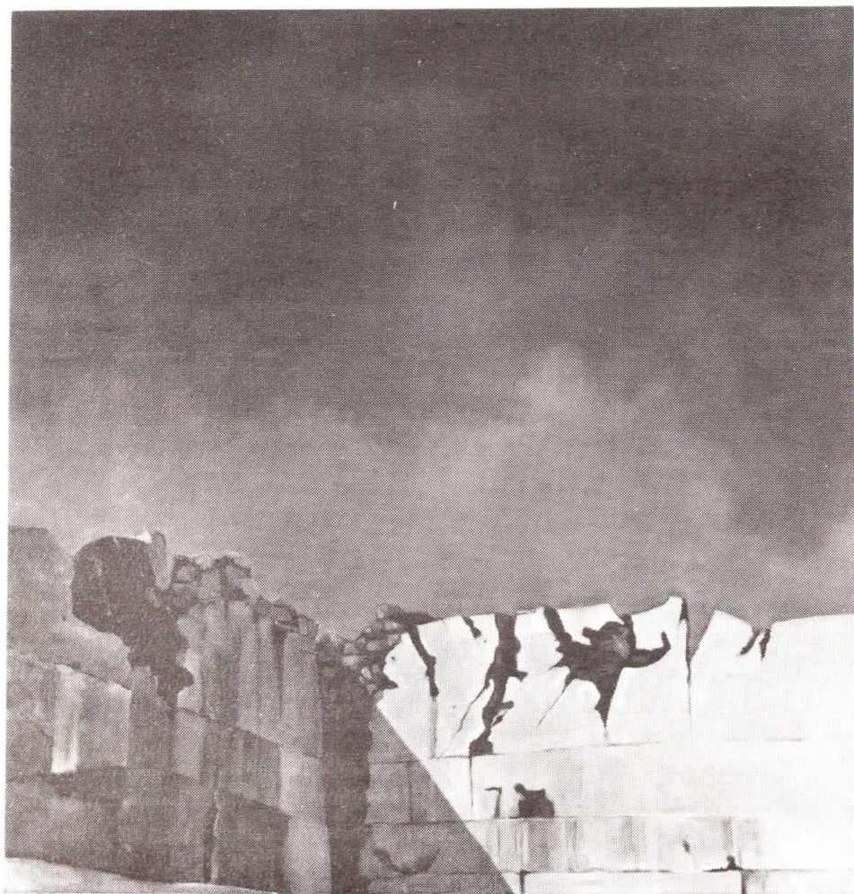
„KAMENOLOM“ I. olje