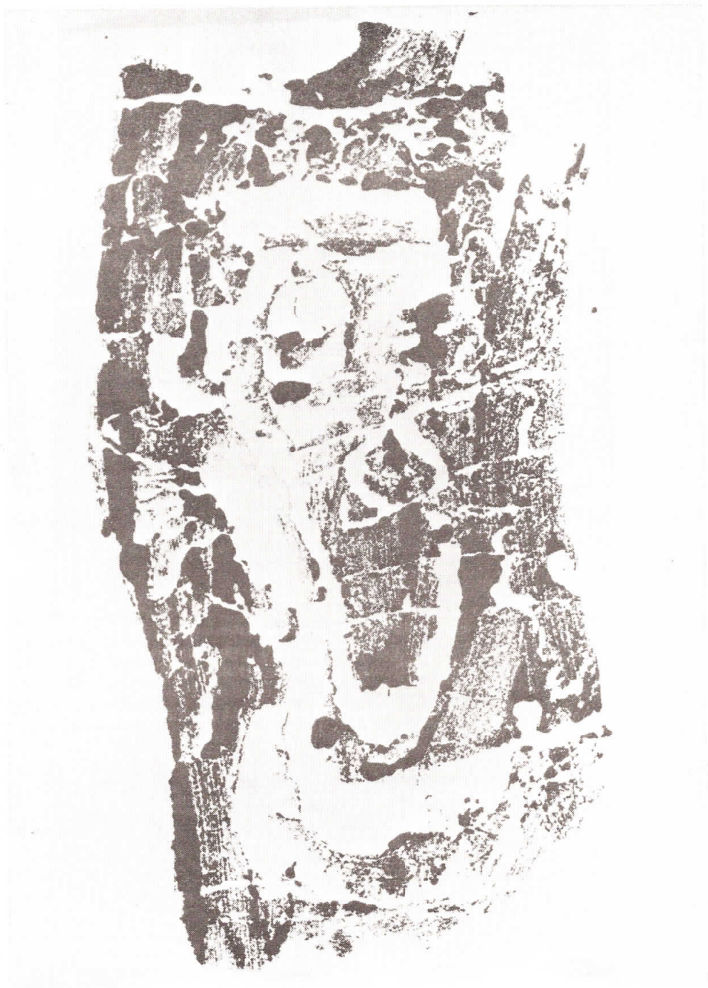
„ISTARSKI JETI“ odtis na papirju