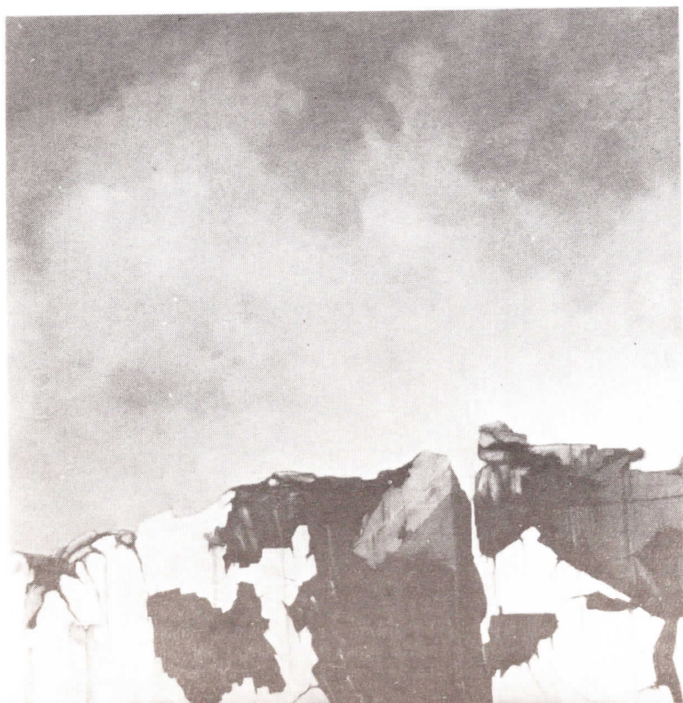
„KAMENOLOM“ II. ođe