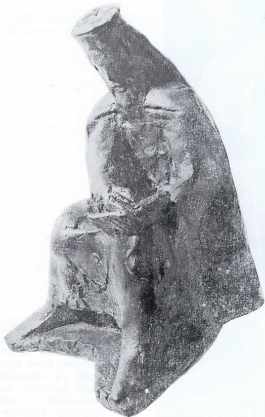
ПАРТЕНИЈА ЗОГРАФСКИ (бронза)

„...за да может да се составит еден општиј јазик прво е потреб- но да излезат на јаве сите местни наречија на јазикот ни...“