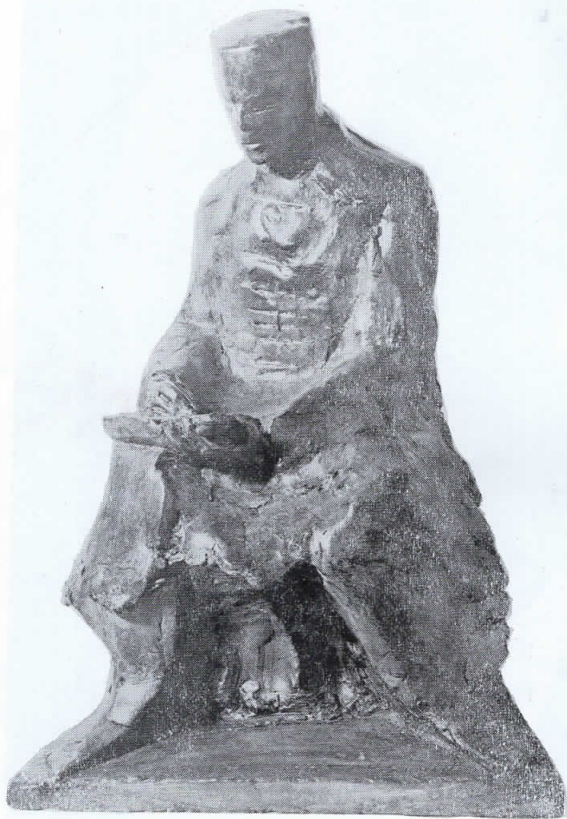
ДИМИТРИЕ ЧУПОВСКИ (бронза)

(Првата реченица во МЕМОРАНДУМОТ НА МАКЕДОНЦИТЕ упатен до балканските сојузници, „Македонски глас“ № 1, 17, 1913; прв потписник — веројатно и составувач — Димитрие Чуповски)