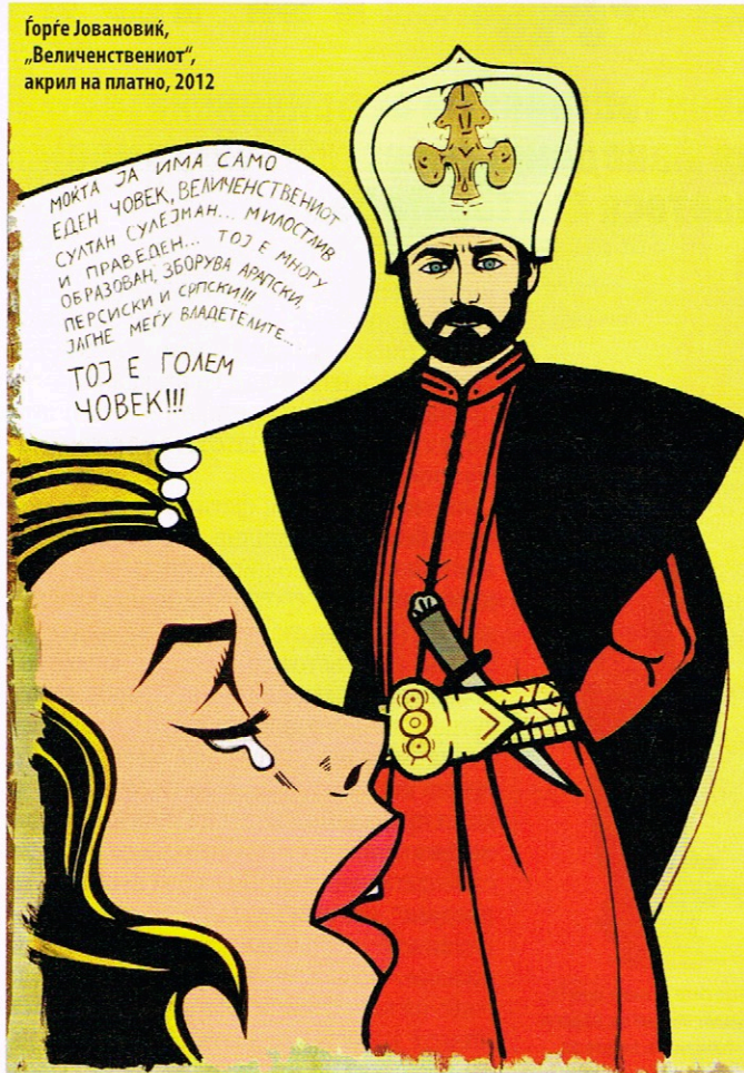
Горѓе Јовановиќ, „Величествениот“, акрил на платно, 2012

Ова влијание е толку силно што дури и децата ги апсорбираат овие модели поистоветувајќи се со ликовите, додека мајките си ги прераскажуваат сериите небаре се вистински искуства. Ликот на Сулејман е нашиот квинтисенцијален херој.