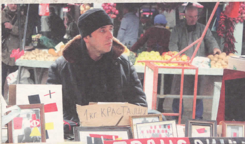
Супремус Трансакција, Битола 2011

Уметноста, пред се, е комуникација и како таква постои за да укаже на одредени аспекти од современиот живот, кои, едноставно, не можат поинаку да бидат соопштени. Таа нуди алтернативен дискурс на гледање на светот, па, дури верувам дека може да го избави човекот од ограничениот видокруг што му го натура секојдневието. Но, се разбира, само доколку и пријдеме без предрасуди - вели уметникот Тошевски во интервјуто за „Лице в лице“