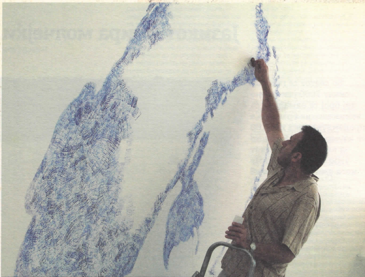
Љубовта неразбирлива секој проклет миг, 2012, МСУ (детал)