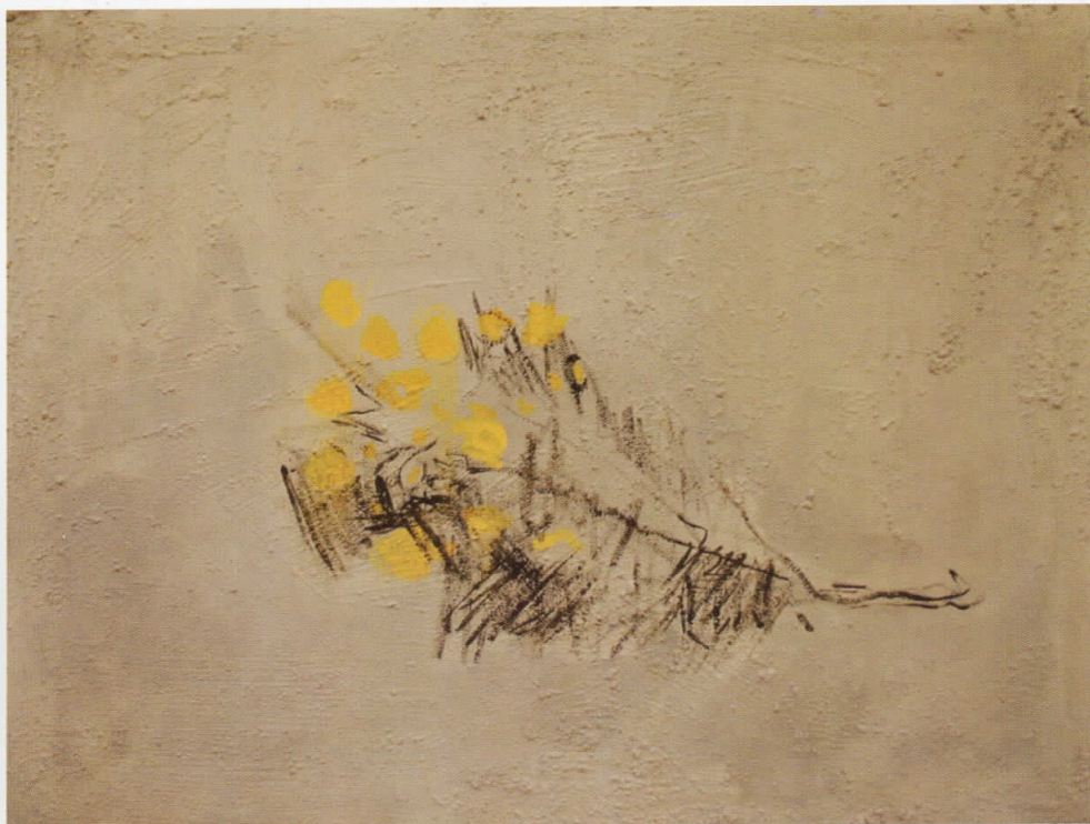
Пердув - комбинирана техника - 120 см x 90 см