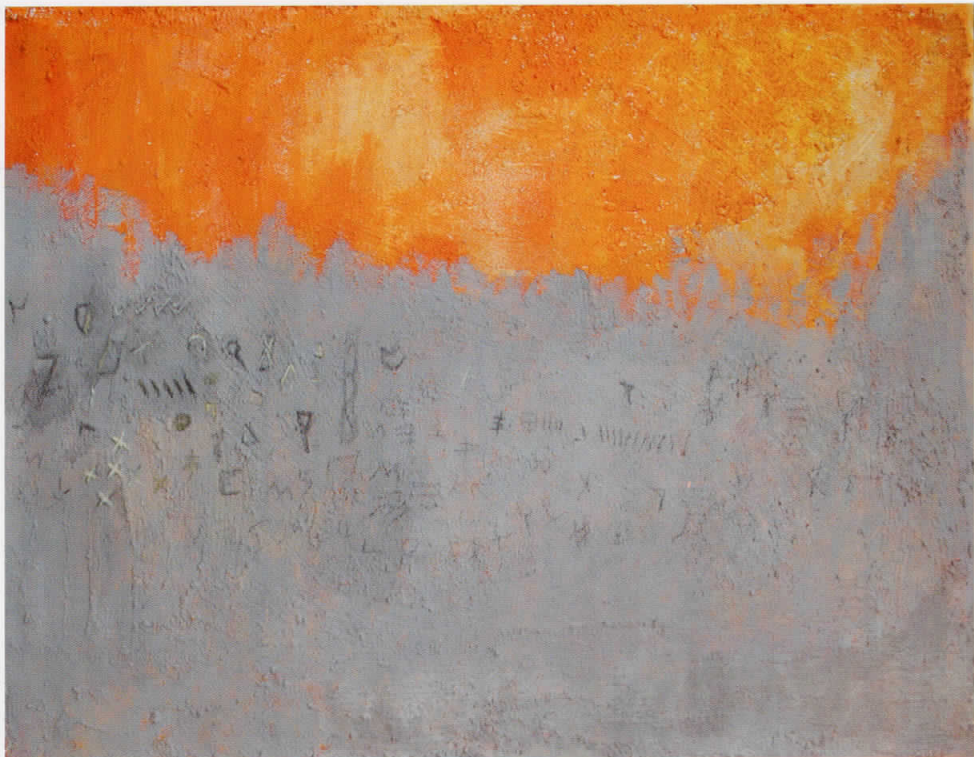
Порака - комбинирана техника - 110 см x 85 см