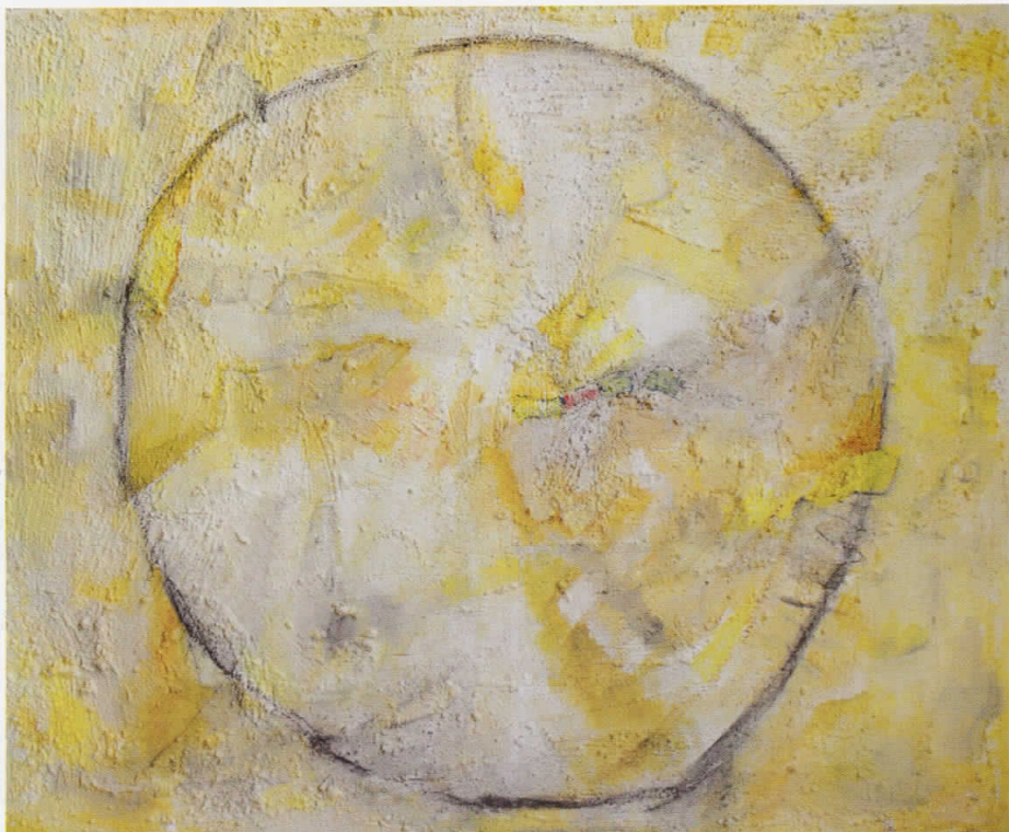
Кругот - комбинирана техника - 110 см x 90 см