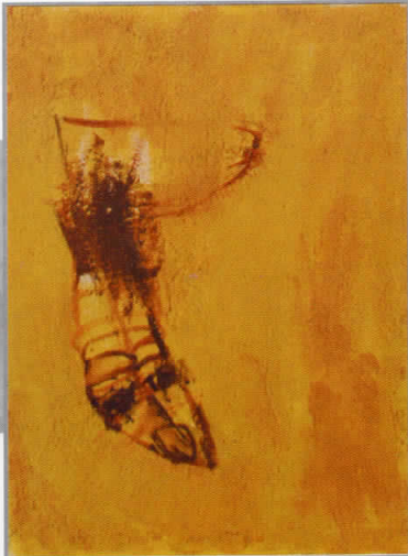
Симболите - комбинирана техника - 40 см x 30 см