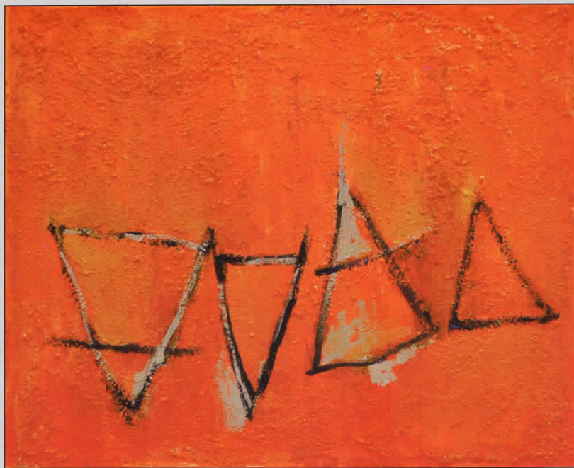
За(едно) - комбинирана техника - 60 см x 50 см