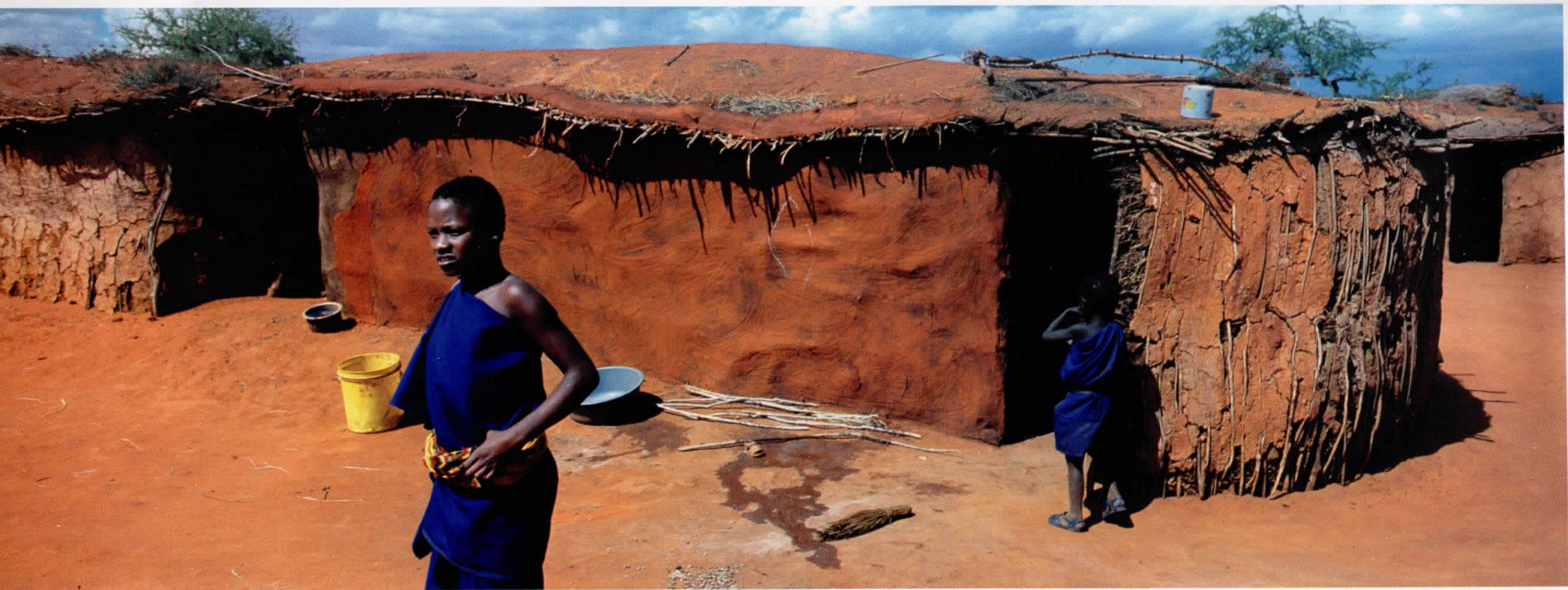
Африка / Africa 05011914, Кенија / Kenya, 2005