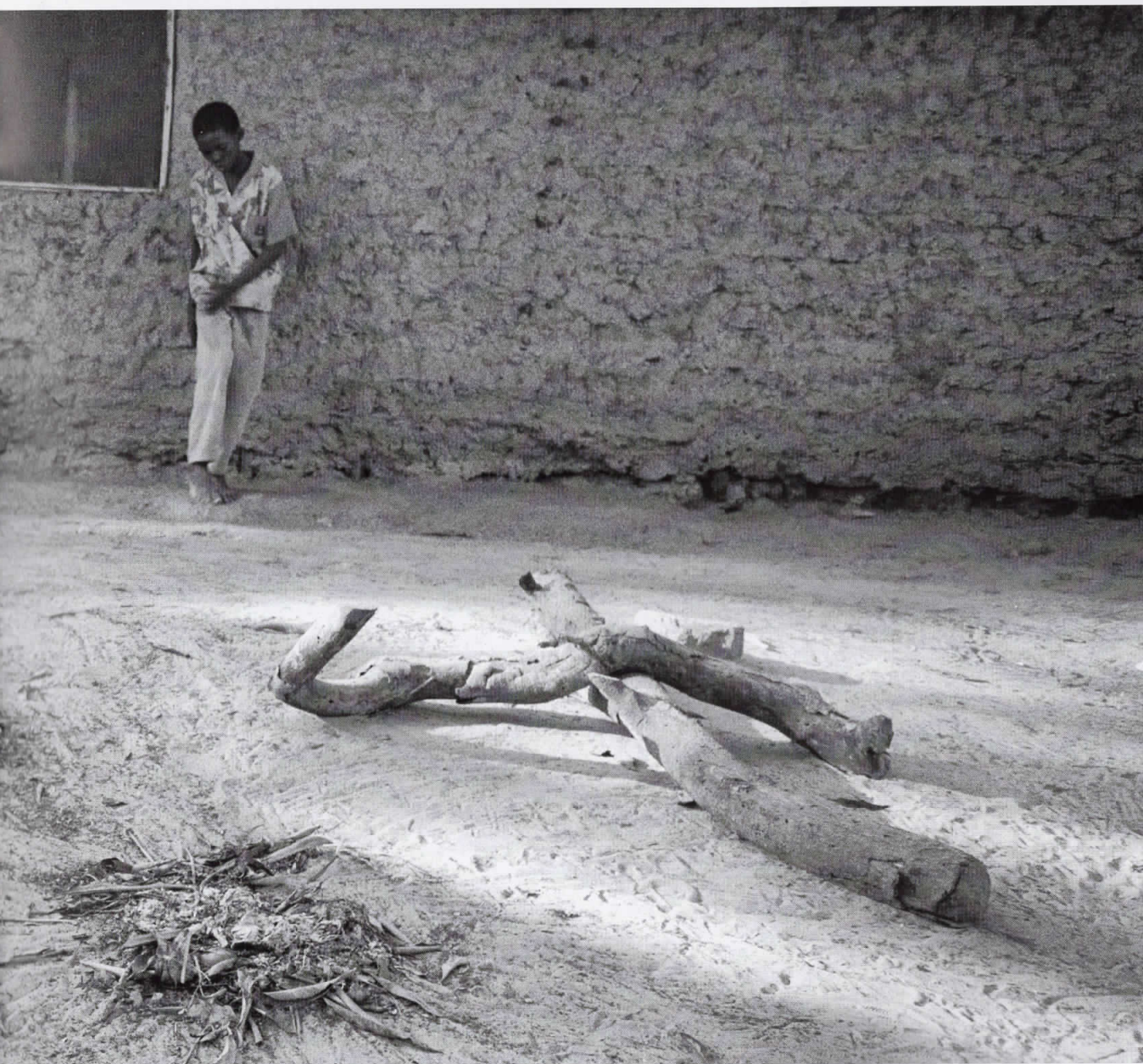
Африка / Africa 05010812, Кенија / Kenya, 2005