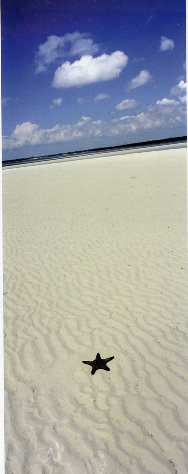
Африка / Africa 05010514 Кенија / Kenya 2005