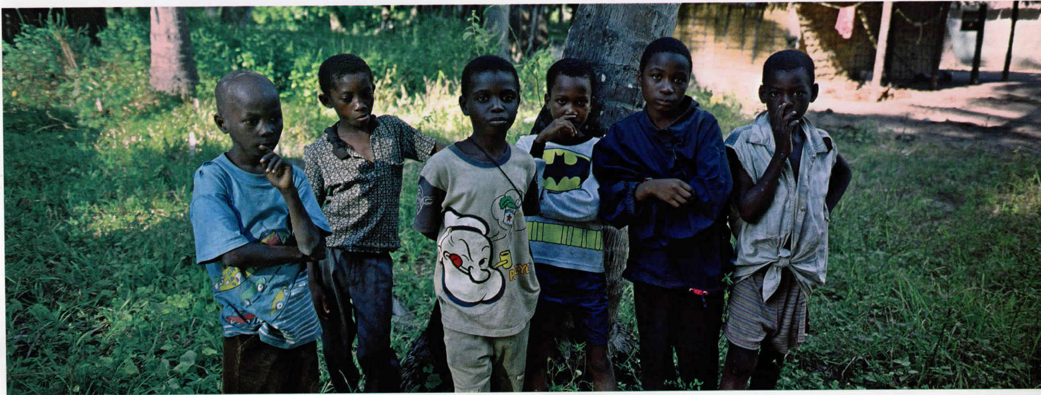
Африка / Africa 05011231, Кенија / Kenya, 2005