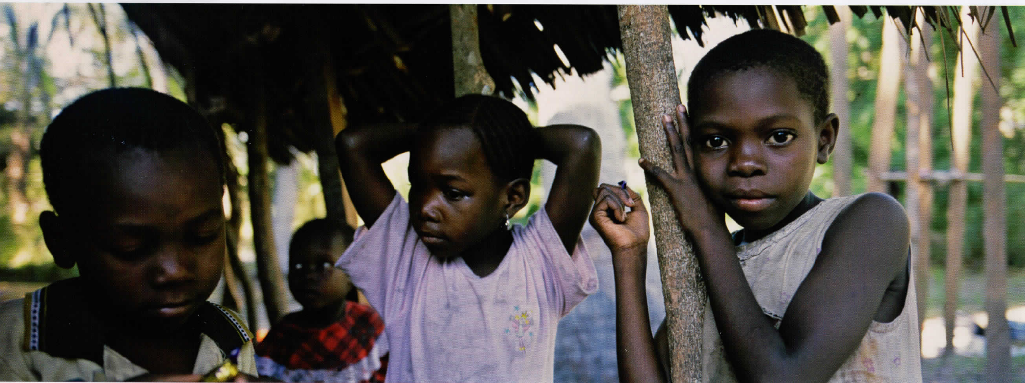
Африка / Africa 05010621, Кенија / Кенуа, 2005