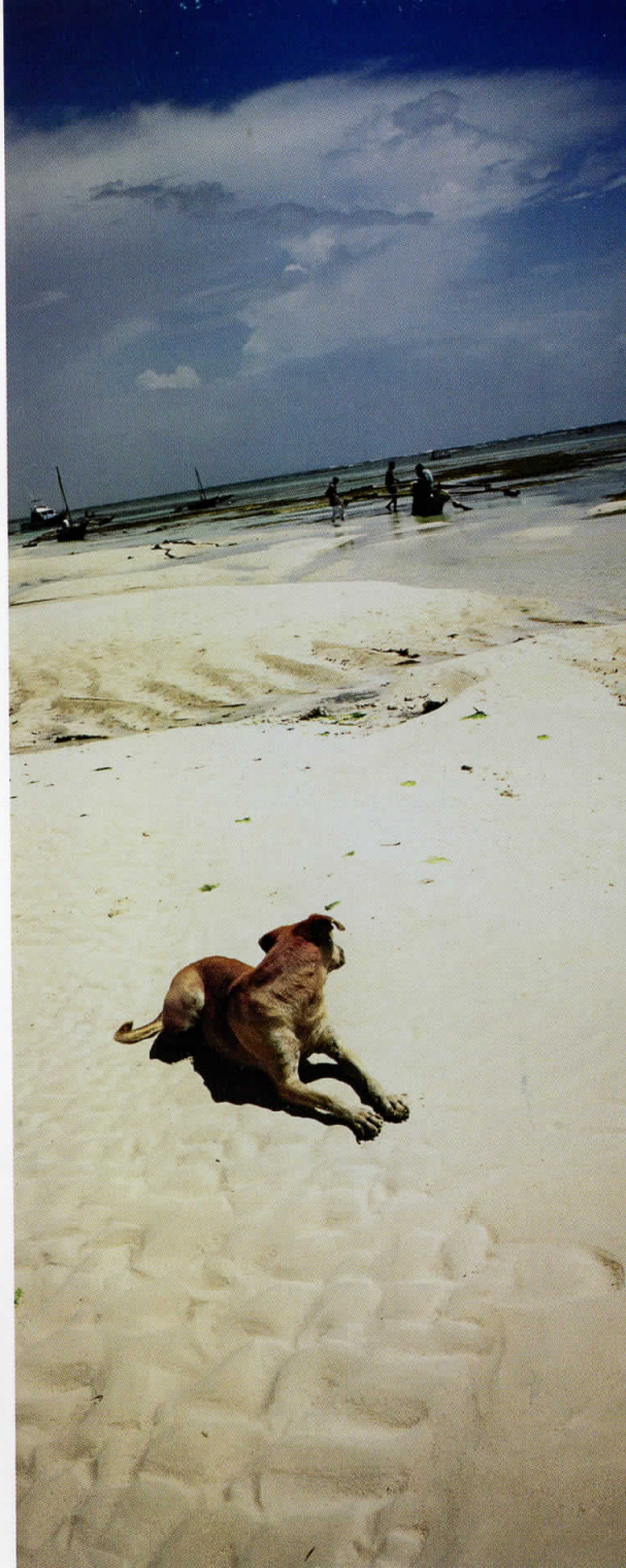
Африка / Africa 05012903 Кенија / Kenya 2005