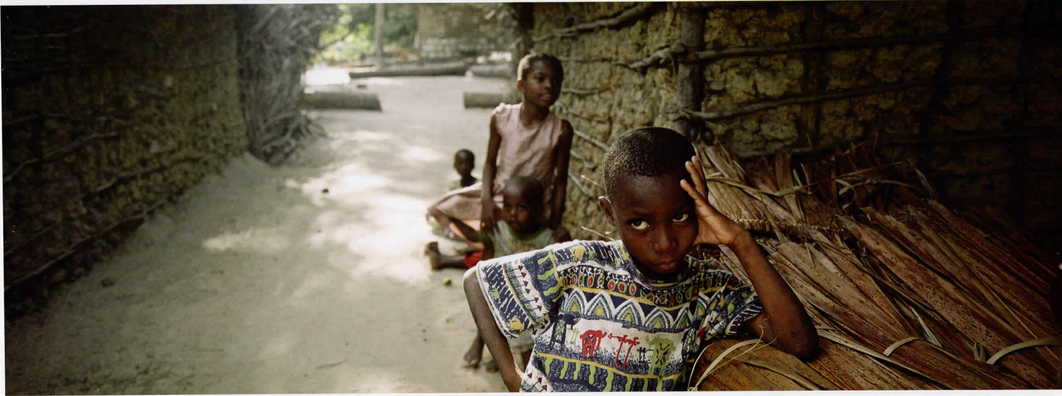
Африка / Africa 05011209, Кенија / Kenya, 2005