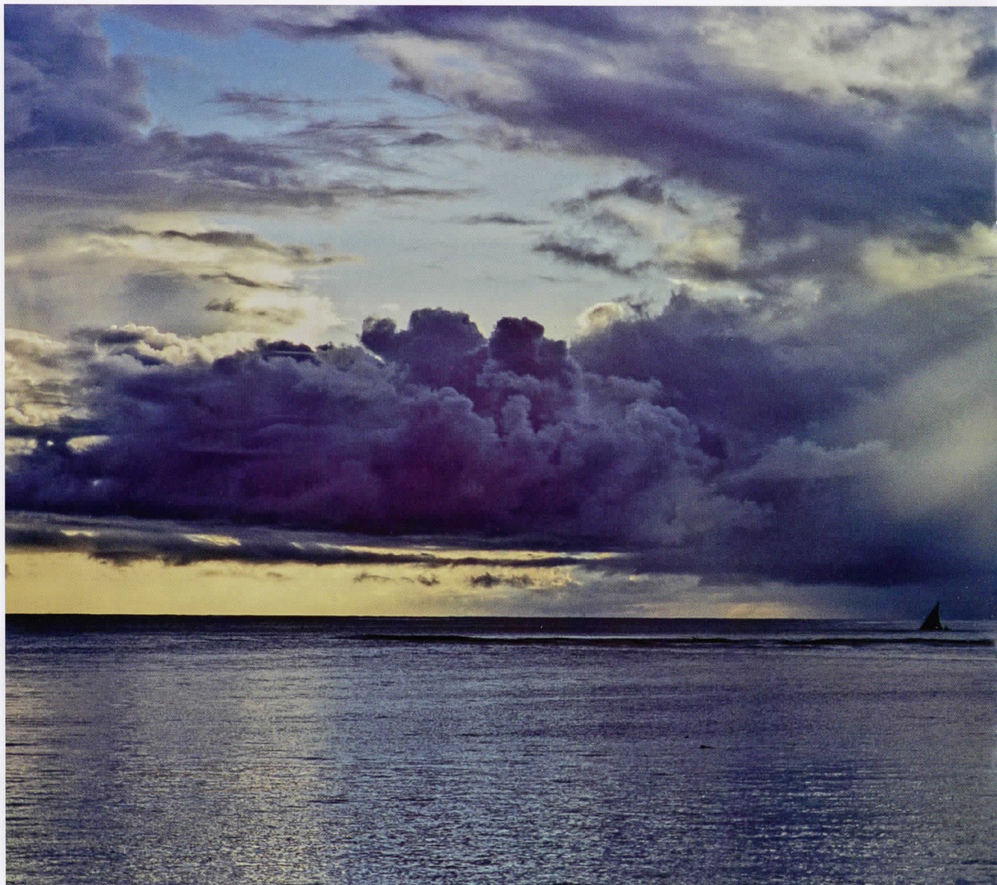
Африка / Africa 06010817, Кенија / Кенуа, 2006