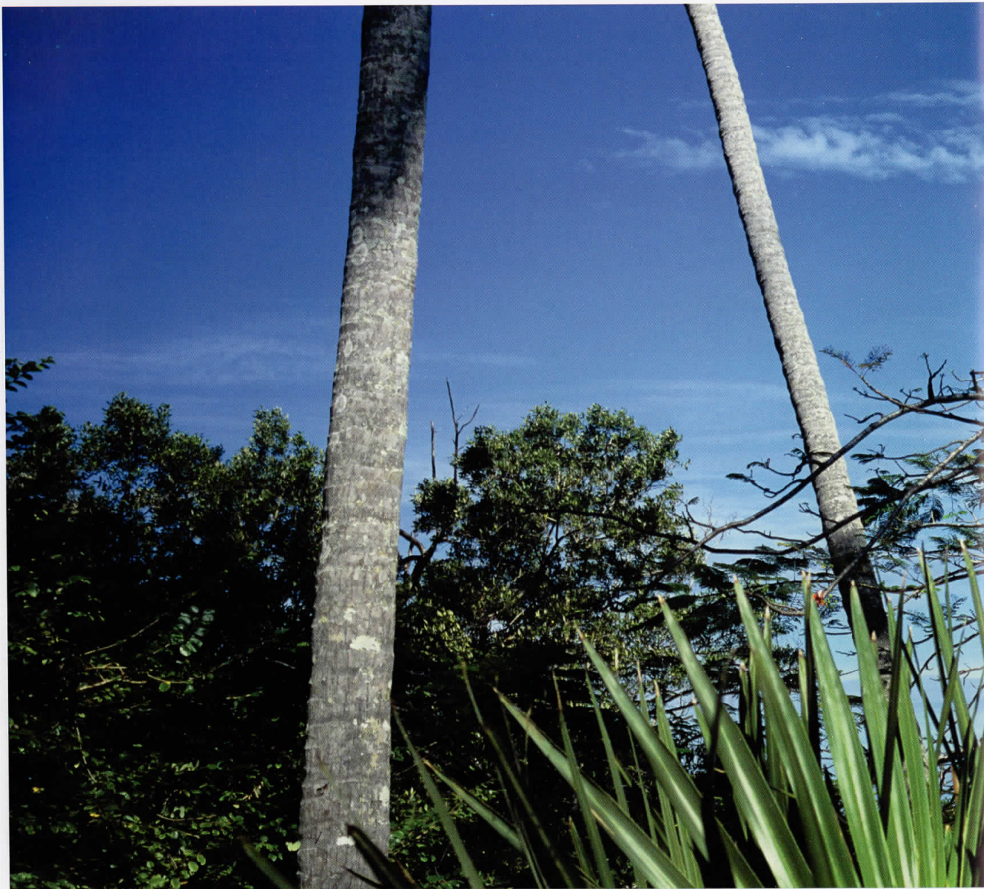
Африка / Africa 05010636, Кенија / Кенуа, 2005