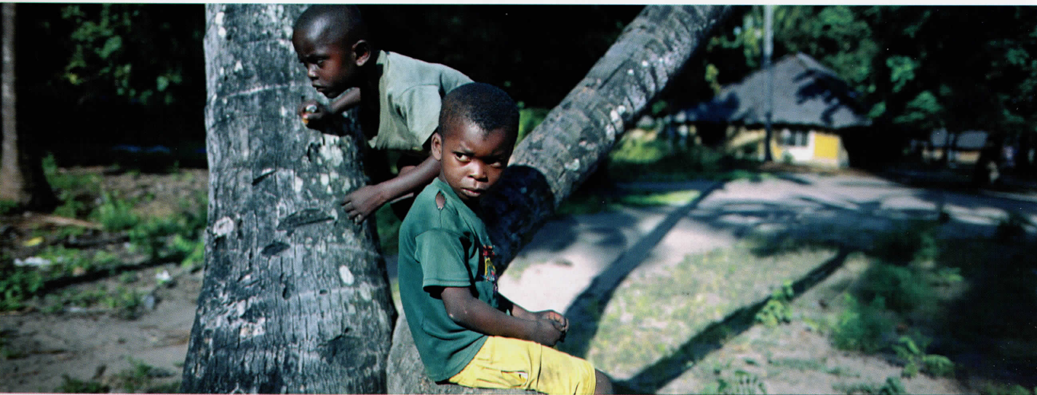
Африка / Africa 05011014, Кенија / Kenya, 2005