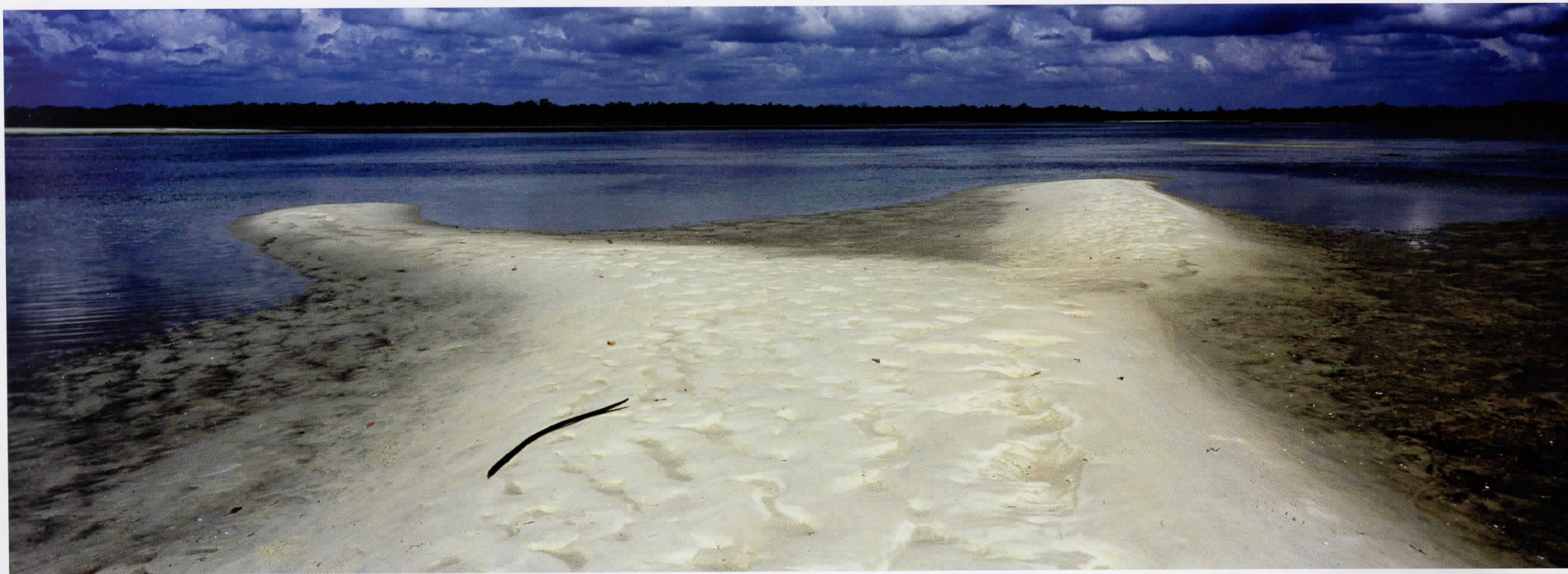
Африка / Africa 05010536, Кенија / Kenya, 2005