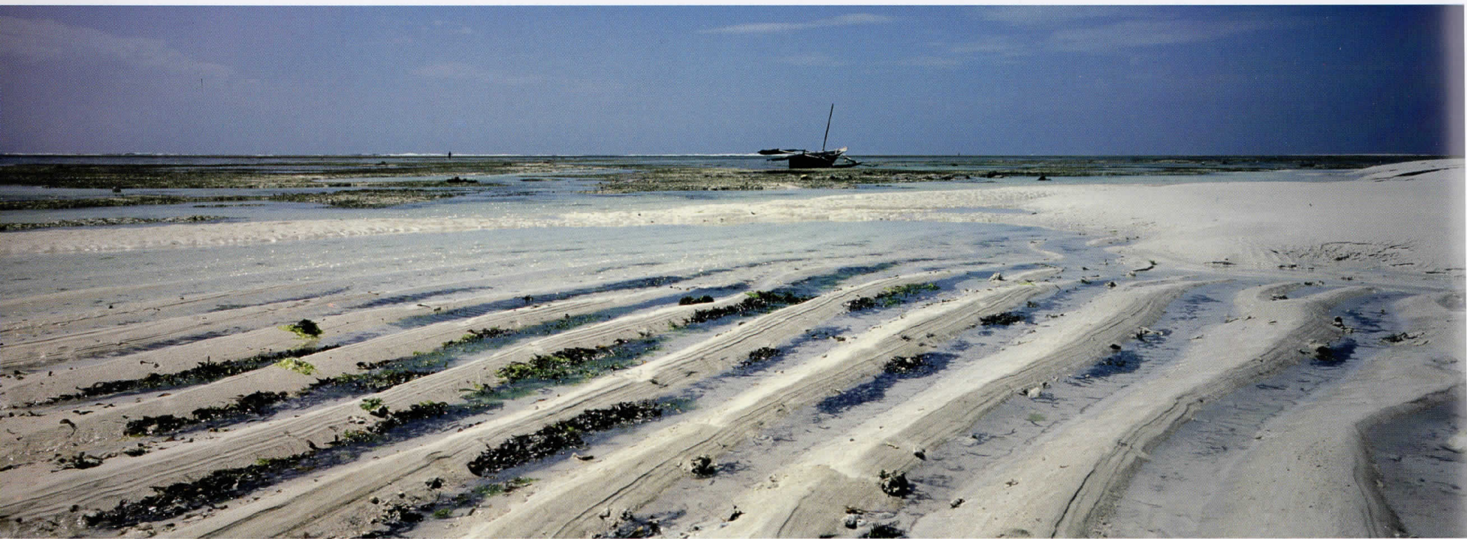
Африка / Africa 05012433, Кенија / Kenya, 2005