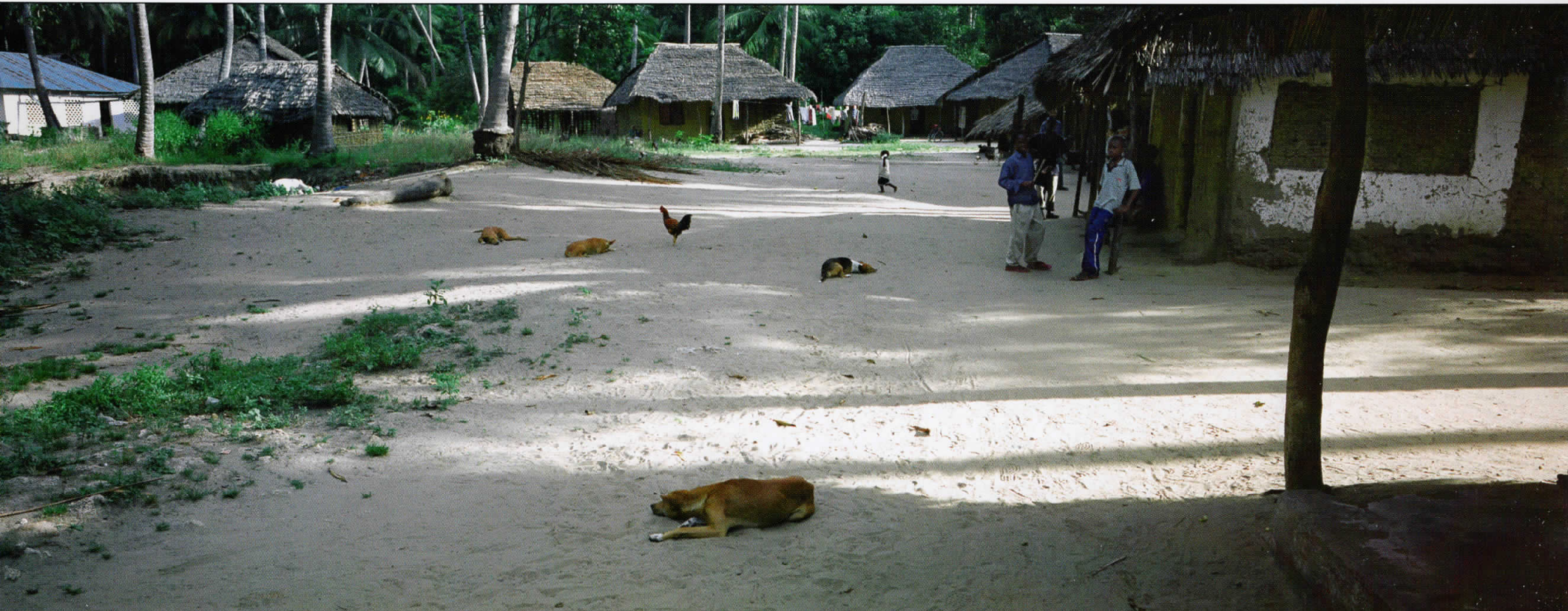
Африка / Africa 05011201, Кенија / Kenya, 2005