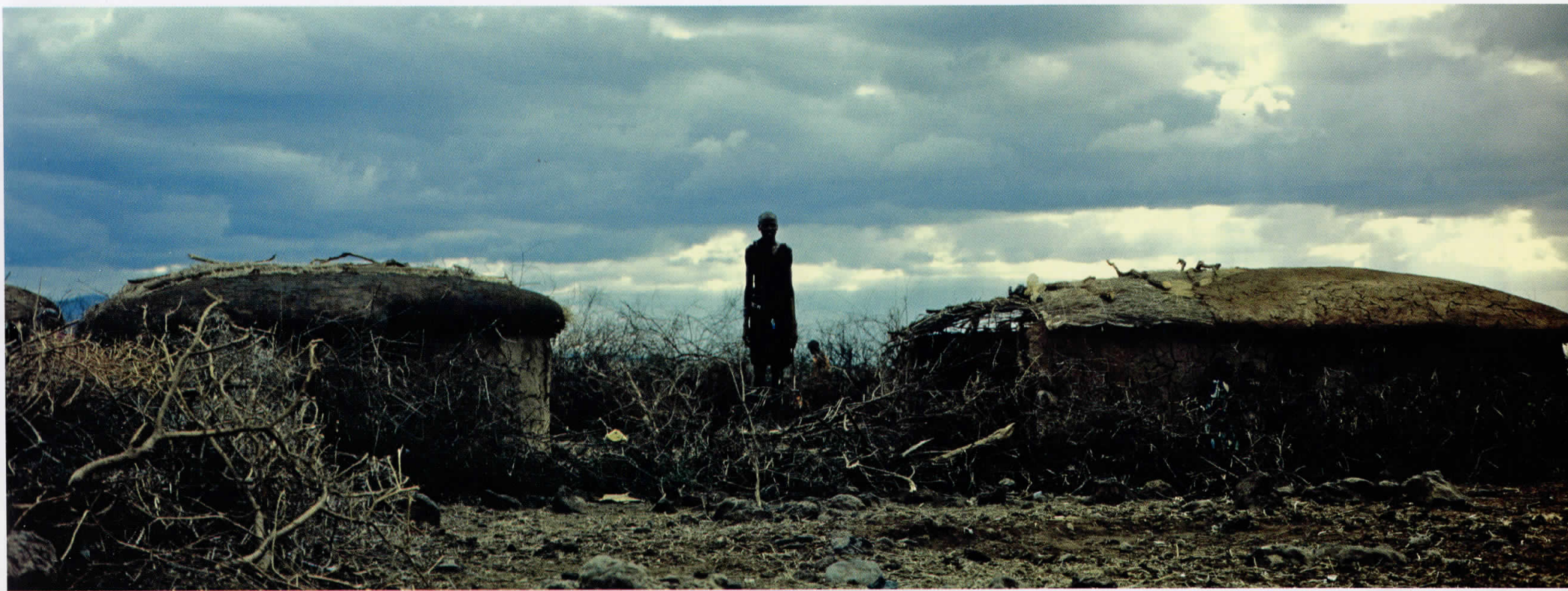
Африка / Africa 06011014, Кенија / Kenya, 2006