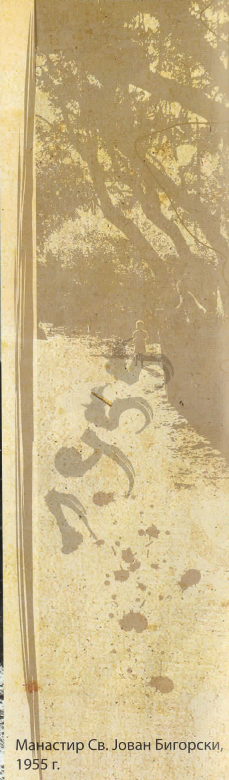
Манастир Св. Јован Бигорски, 1955 г.