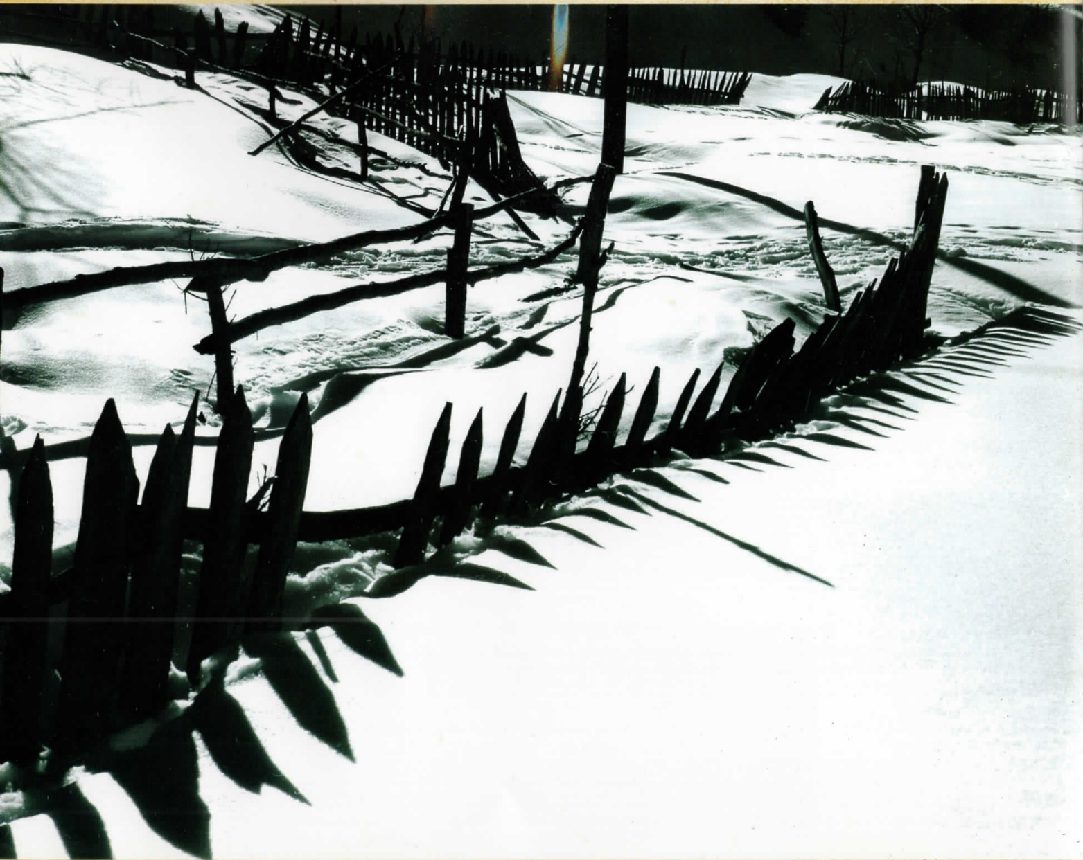
Графика, Маврово '60-ти