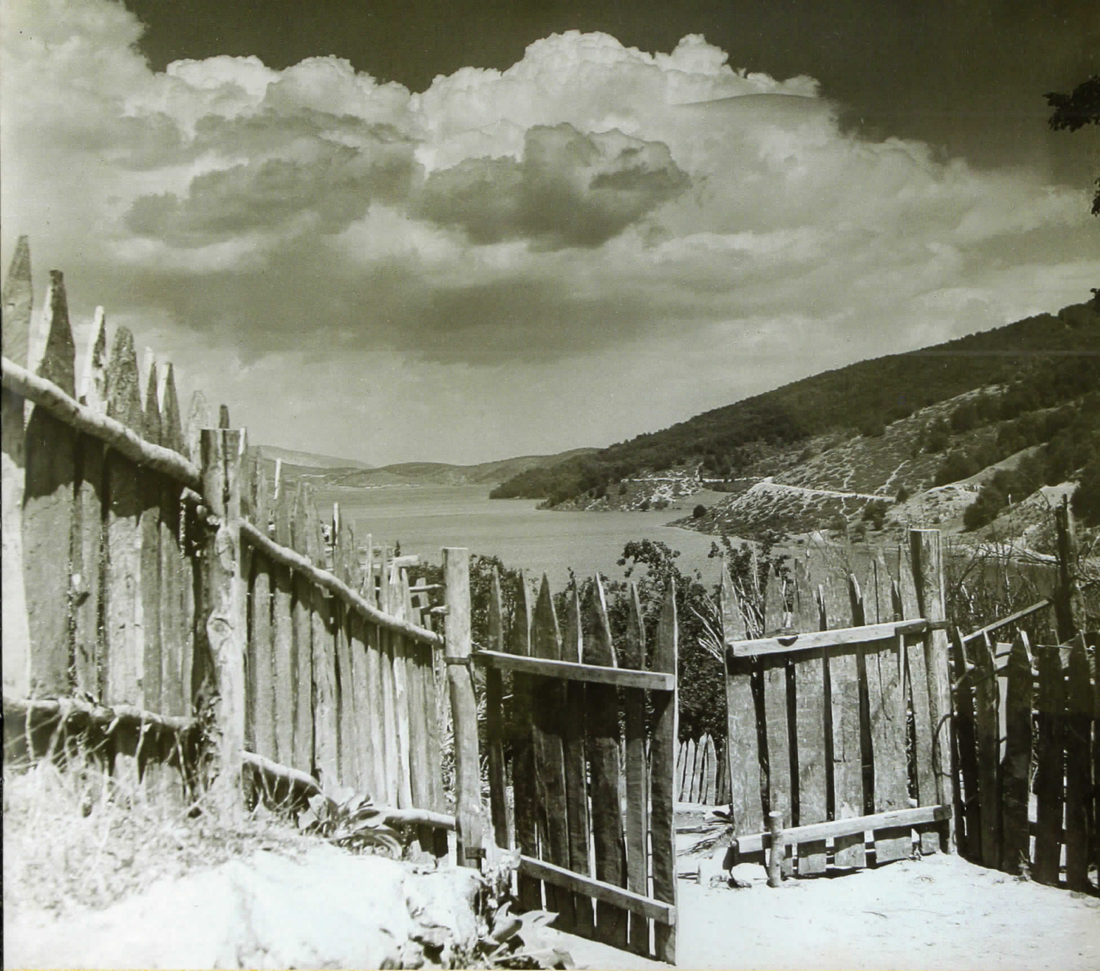
Мавровско езеро, '50-ти