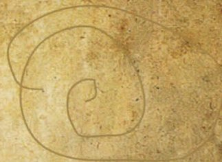
Попова Шапка, '40-ти