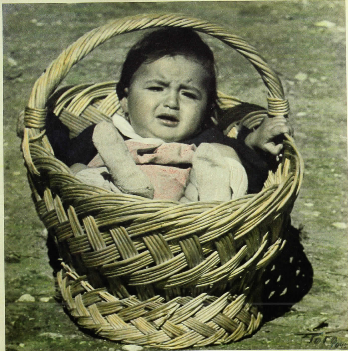
портрет на ќерката Ефtimiја - 1945 г.