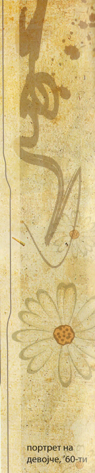
портрет на девојче, '60-ти