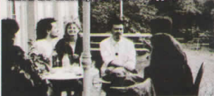
Културата формација на изложбата во Келн, во 1990 година