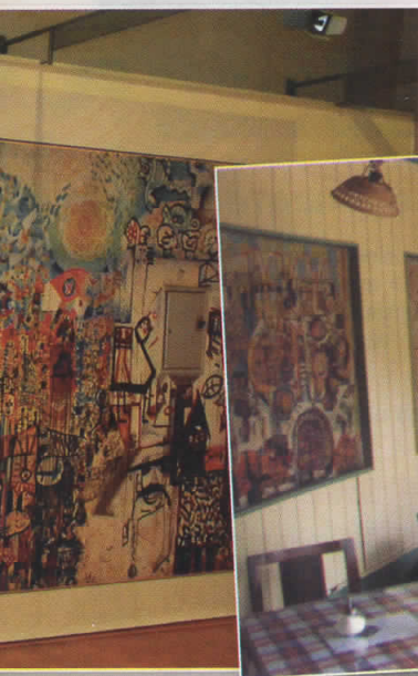
Тука започна историјата: чајилницата „Галерија 7“ со муралите на „Зеро“

Тројцата се едногласни дека немало конфликти меѓу нив, туку само часови дискусии на најразлични теми, не доминираше никој над никого, а изгледаат и убедено во можноста сите поранешни членови да ја сочувале таа, иста, тогашна енергија, дека останале недопрени од комерцијализацијата, а со тоа и шансата за идно повторно творечко обединување. Од проста причина што и нивното првично соединување, како што ќе забележи д-р Величовски, е „последича“ на пресвртниот момент на автентичен револт и провокација кон воспоставените естетски навики и локални