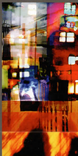
Сенки I, компјутерска графика, 2006 Shadows I, digital print, 2006