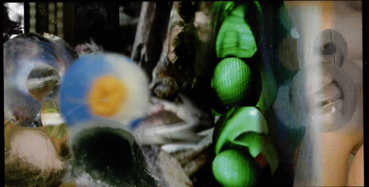
Кодот Б, компјутерска графика, 2006 Code B, computer graphic, 2006

Born 1974 in Skopje, graduated at the Faculty of Fine Arts (1997) and finished post-graduate studies (2003), on the Painting department and course of Hand made paper. He has received many awards and scholarships for studying abroad. Selected solo exhibitions: 1999 – Mak-Graf, City Museum, Skopje; 2002 – Compressions, Gallery Aero, Skopje; 2002 – Sleeplessness, Toki Art Space Gallery, Tokyo; 2006 – Code B, National Gallery of Macedonia – Mala Stanica, Skopje. He participated on several group exhibitions in the country and abroad.