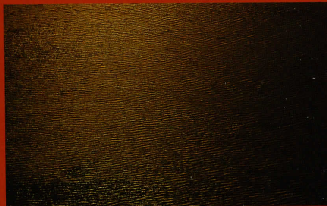
Од 19.19.40 до 19.26.50, дигитален принт, 80x50 (4), 2008 From 19.19.40 to 19.26.50, digital print, 80x50 (4), 2008