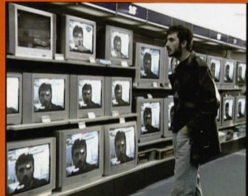
Алеф, 15', Продукција плус, ДВ, 2005/06 Aleph, 15', Production Plus, DV, 2005/06

Selection of his filmography: 2005/2006 - Aleph, Fiction 15 min, Production Plus, DV; 2004/2005 - Mirror, 20 min., Production Plus and 2001-2002 – The portrait of the young artist in the 21 st century, 8 min., Dream Factory Production & Manaki Brothers, DV.