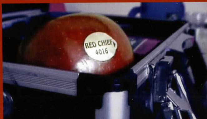
Red Chief 4016, видео, 5 мин, 2004 Red Chief 4016, video, 5 min, 2004