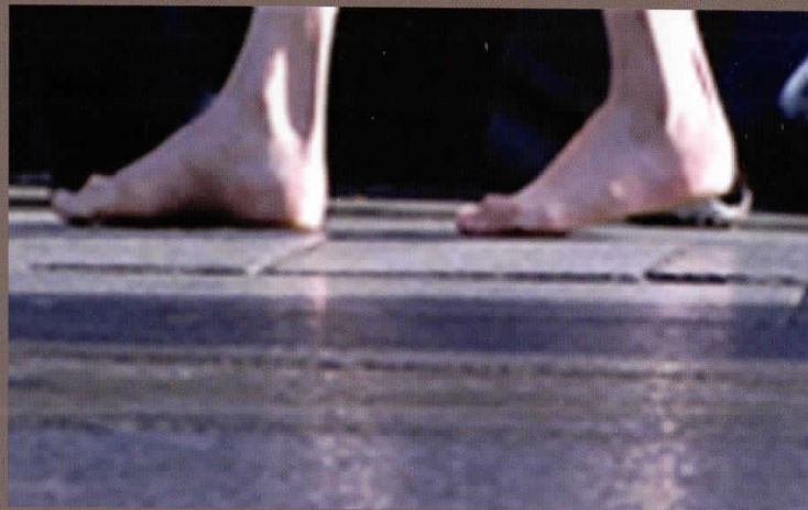
East (w)o West, 4'46", видео, 2007 East (w)o West, 4'46", video, 2007