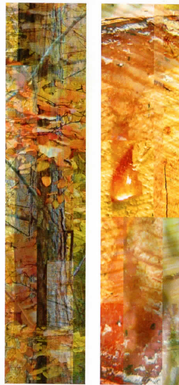
Пафа, компјутерска графика, диптих, 2008 Timber, computer graphic, diptych, 2008

Born 1972 in Skopje, graduated 1997 at the Faculty of Fine Arts, Skopje, majoring in Painting. In 2003 he graduated the Master Course of The Joshibi University of Art and Design, Tokyo, Japan. Selected solo exhibitions: 2004 – Skopje, Messages posters, Cultural Center "Točka"; 2003 – Tokyo, Wave installation, Youkobo Art Space; 2002 – Tokyo, S-lines installation, Toki Art Space; 1998 – Skopje, Cave installation, Youth Cultural Center. He participated on several group exhibitions in the country and abroad.