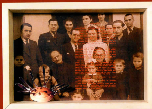
Распятие, кутија, сито печат, дигитален печат, 32x45x10, 2002 Crusifixion, wood-case, plotter print, silkscreen print, 32x45x10, 2002

An artistic collaboration founded in 2001 by the visual artists Slobodanka Stevčeska (1971) and Denis Saraginovski (1971). Both of them studied at the Faculty of Fine Arts in Skopje. They had solo exhibitions in Macedonia, Estonia, Slovenia, Germany and France and exhibited in group exhibitions and festivals such as Transmediale, Berlin; Rencontres Internationales Paris/Berlin; Transeuropa – European Theatre – and Performance Festival, Hildesheim; Freewaves' Biennial of New Media Arts, Los Angeles, Australia etc.