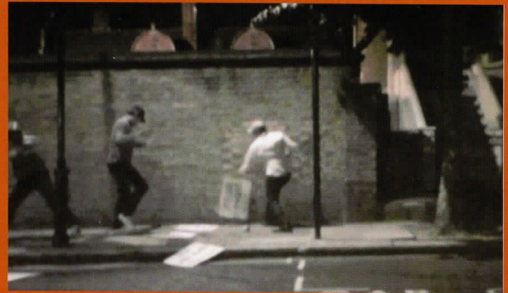
Give 'em Hell, 4', видео, 2008 Give 'em Hell, 4', video, 2008

Born in Sarajevo (1969), she has graduated (1997) at the Faculty of Fine Arts, Skopje, department of Printmaking and postgraduated in Philosophy, Royal College of Art, London. Today, she works and lives in London, UK. Selected solo exhibitions: 2008 – Should I take, or should I go?, Museum of Contemporary Art, Skopje; 2007 – The Little Match Seller, or 'Merry Europe', European Commission in the UK, London, 2006 – Advanced Science of Morphology, Marble Arch Park, London. She has participated in various group exhibitions and in numerous international festivals.