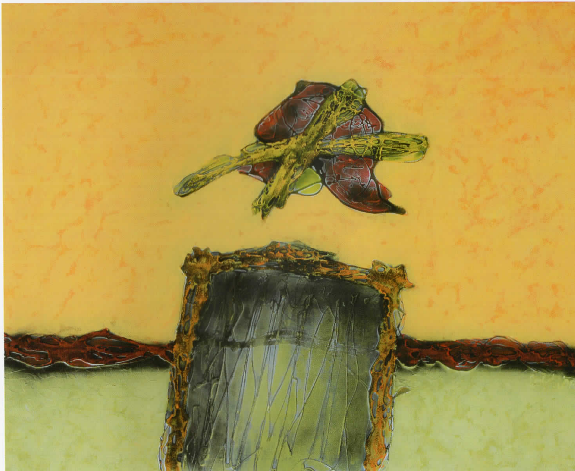
Над портата 3 / Mbi portë 3 / Over the Gate 3, 2008 комбинирана техника / teknikë e kombinuar / combined technique