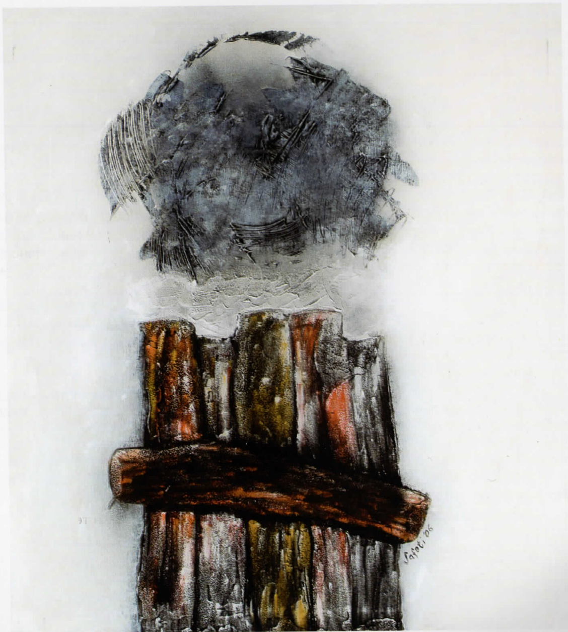
Торзо / Torzo / Torso, 2006 комбинирана техника / teknikë e kombinuar / combined technique