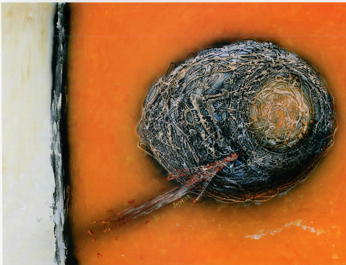
Препород / Rilindja / Renaissance, 2008 комбинирана техника / teknikë e kombinuar / combined technique