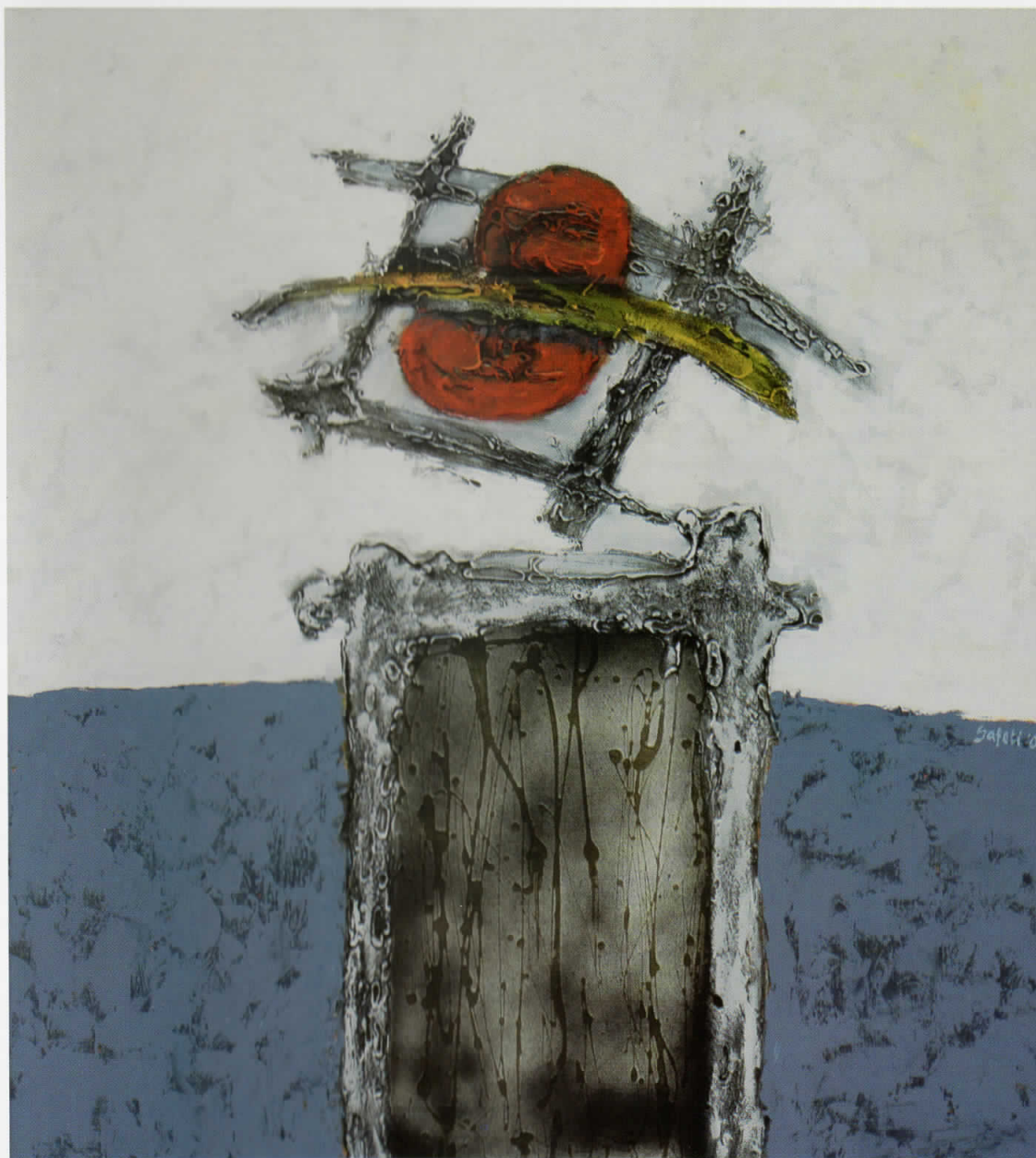
Чекање пред портата / Pritja para portës / Waiting in front of the gate, 2008 комбинирана техника / teknikë e kombinuar / combined technique