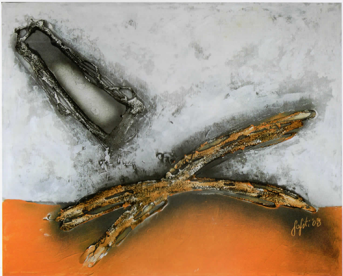
Интервенција 1 / Intervencija 1 / Intervention 1, 2008 комбинирана техника / teknikë e kombinuar / combined technique