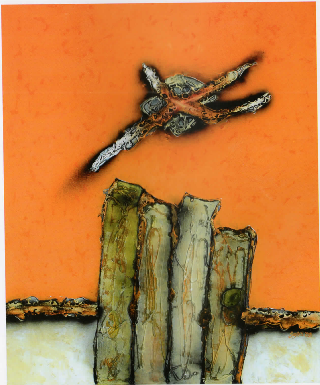
Над портата 2 / Mbi portë 2 / Over the Gate 2, 2008 комбинирана техника / teknikë e kombinuar / combined technique