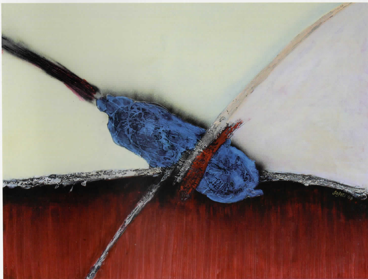
Мелодија / Melodija / Melody, 2008 комбинирана техника / teknikë e kombinuar / combined technique