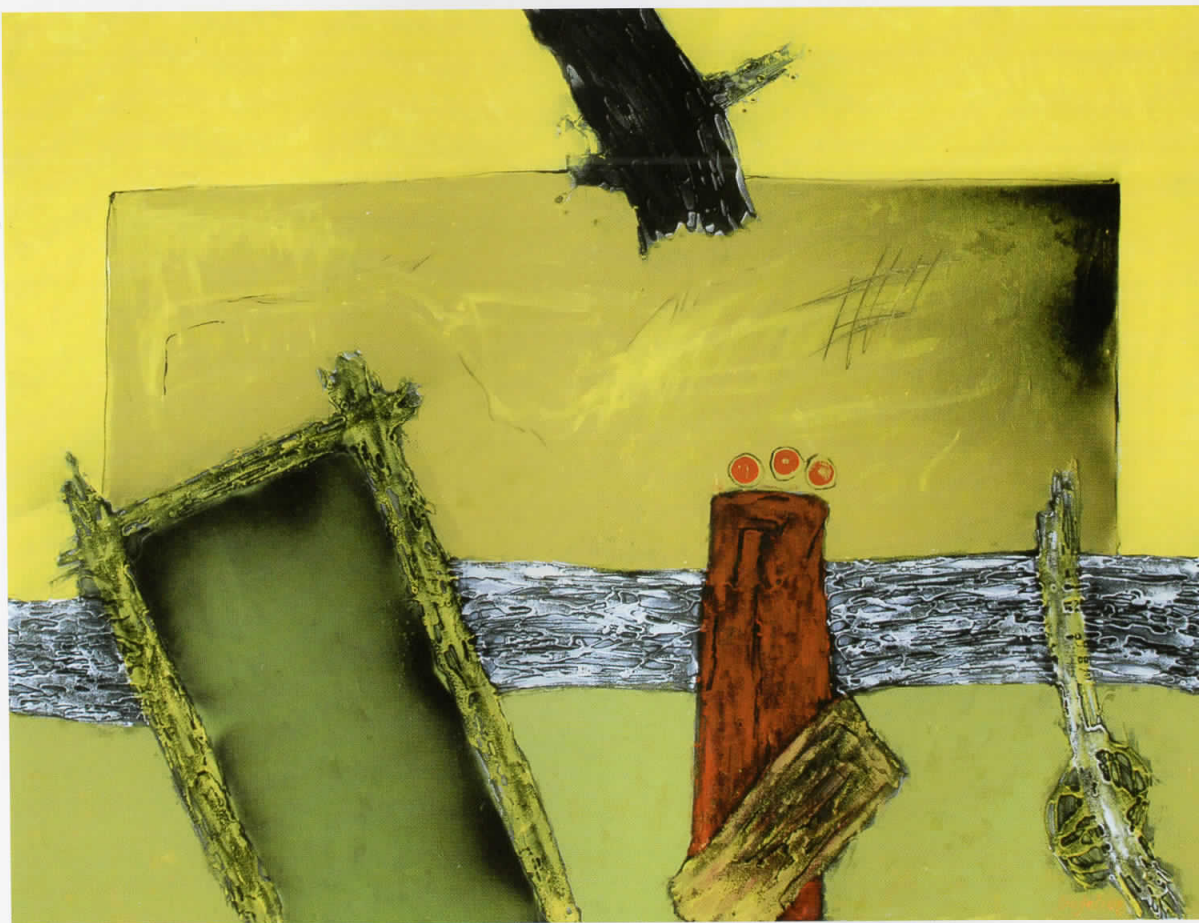
Релации на чувства / Relacione ndjenjash / Relations of Feelings, 2008 комбинирана техника / teknikë e kombinuar / combined technique