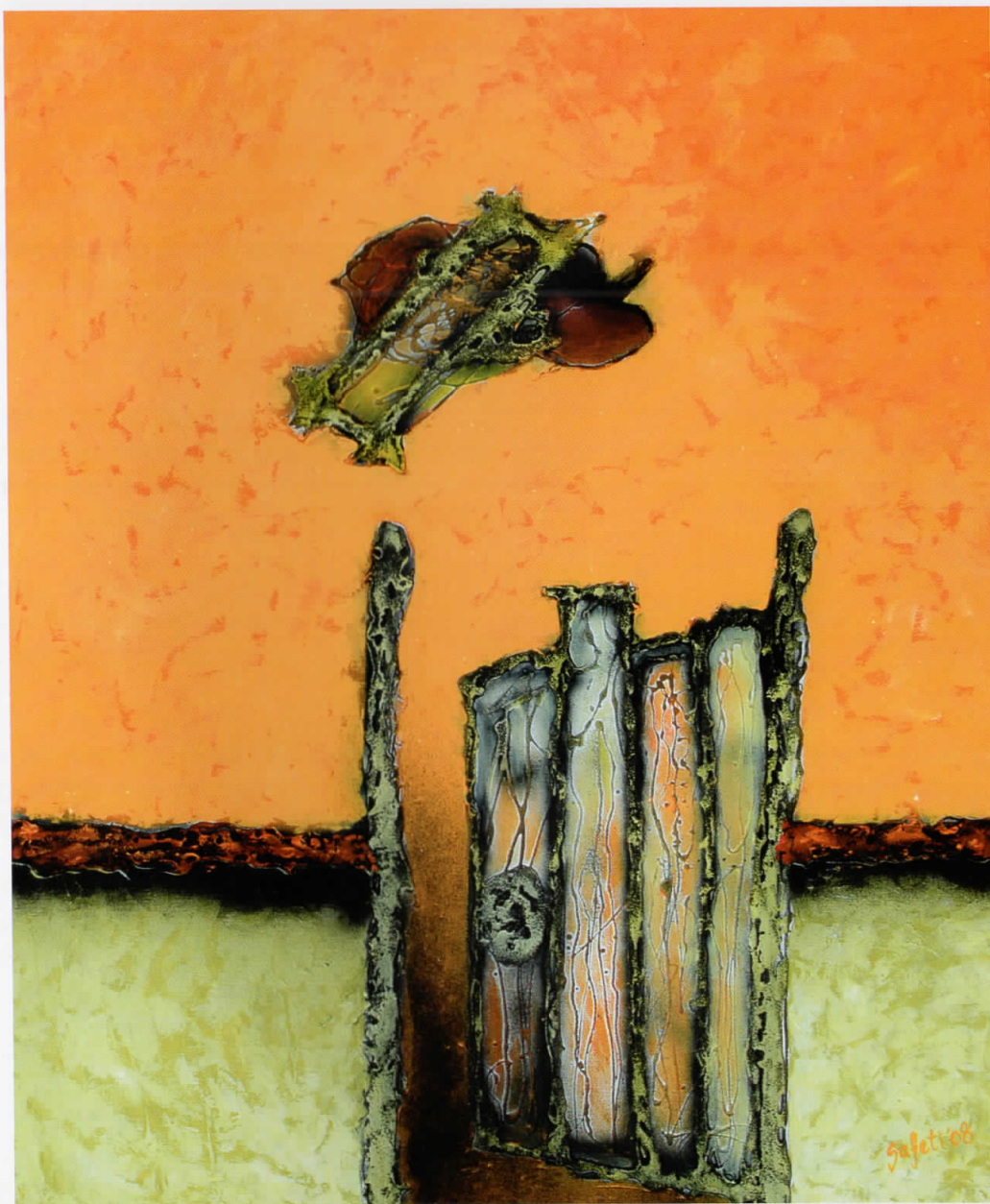
Враќање на сеќавањето / Kthimi i kujtesës / Bringing back the Memories, 2008 комбинирана техника / teknikë e kombinuar / combined technique