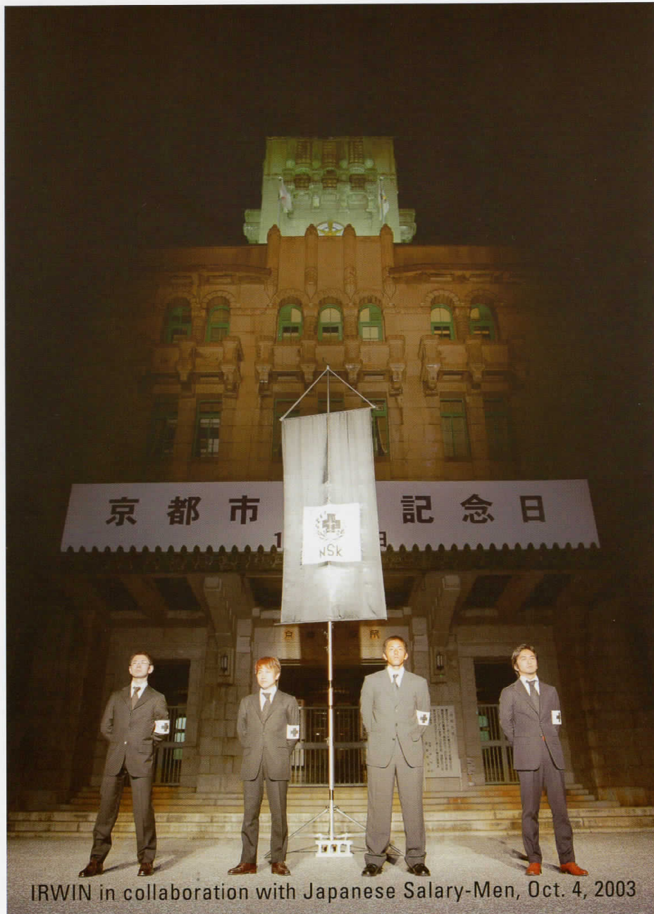
NSK Garda Kyoto