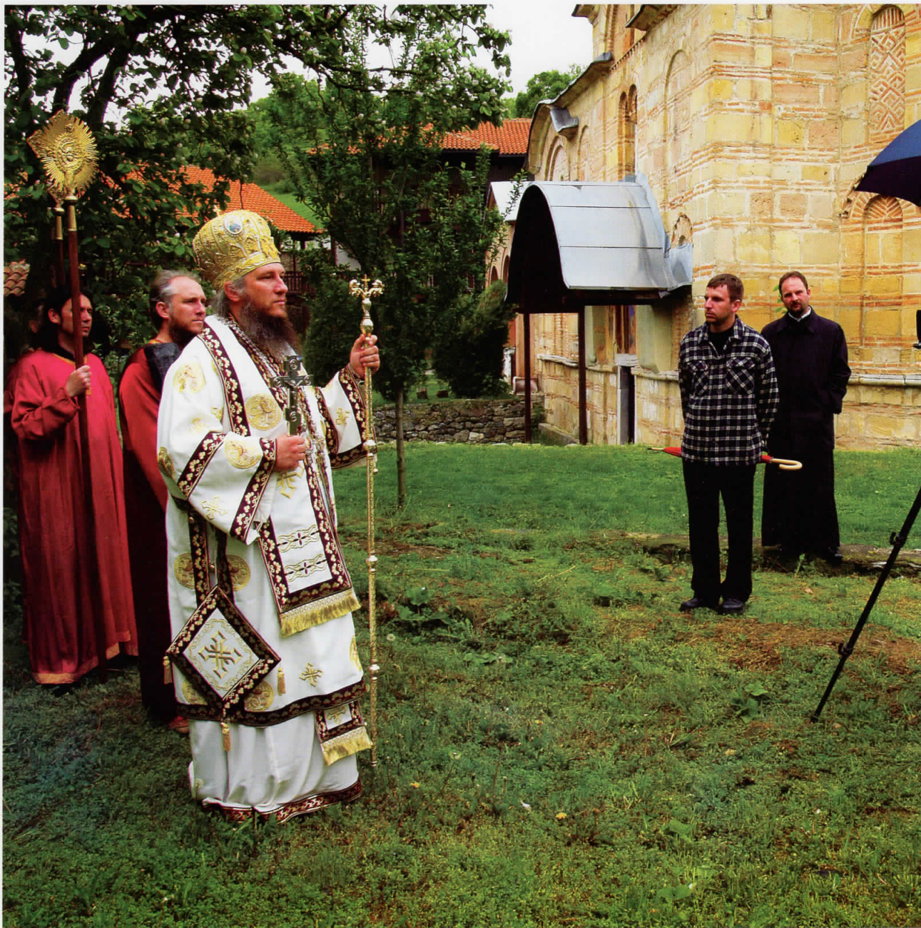
At the shoot of the Procession, 2006, Marko's Monastery, near Skopje