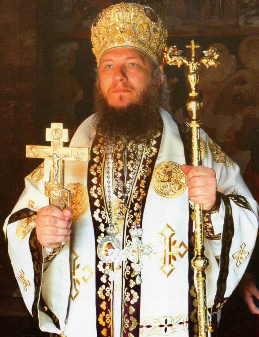
Procession, 2006