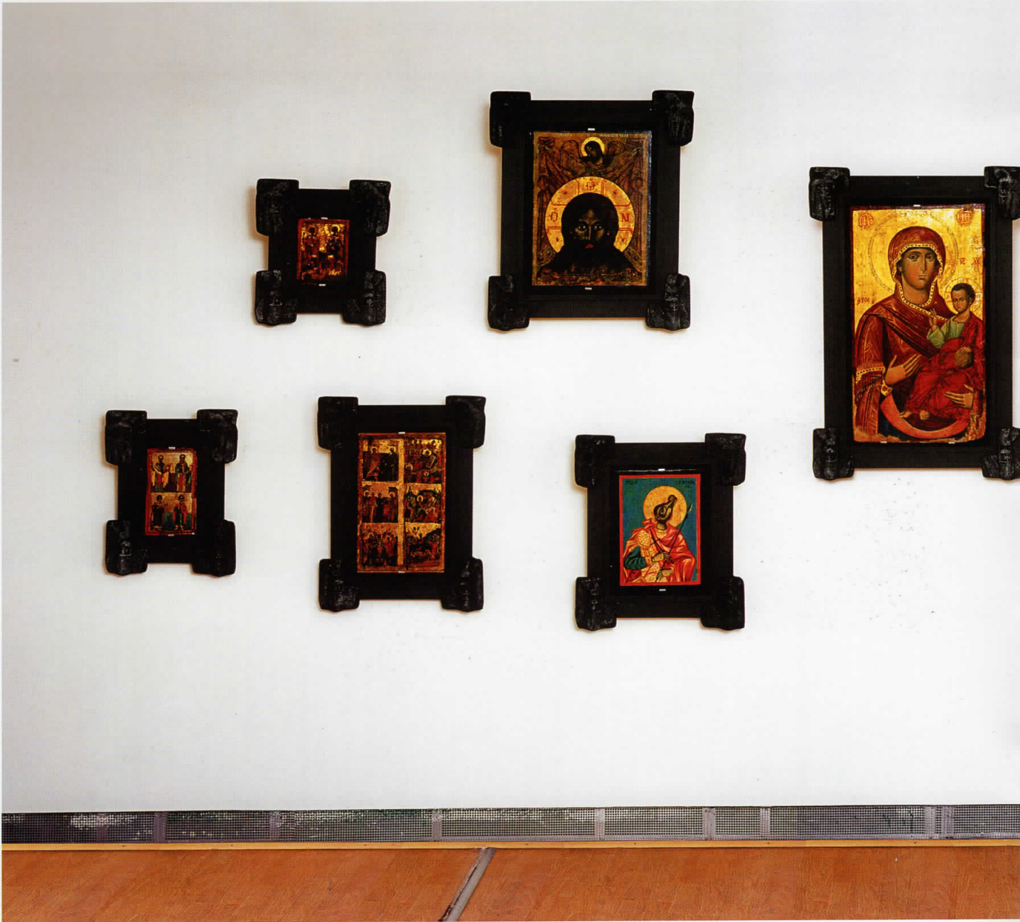
Icons (Was ist kunst Makedonija), 2007