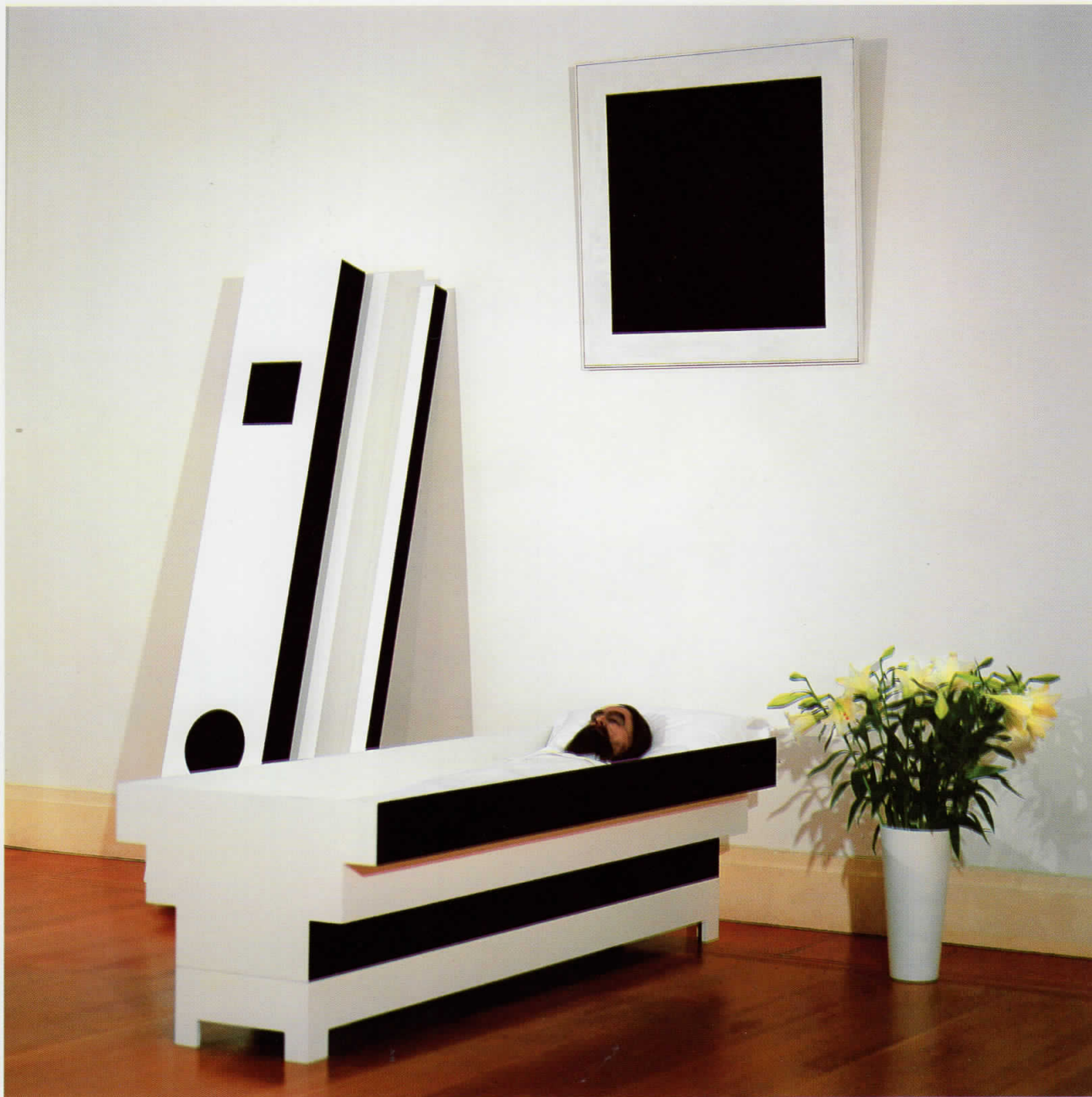
Corpse of Art , 2003