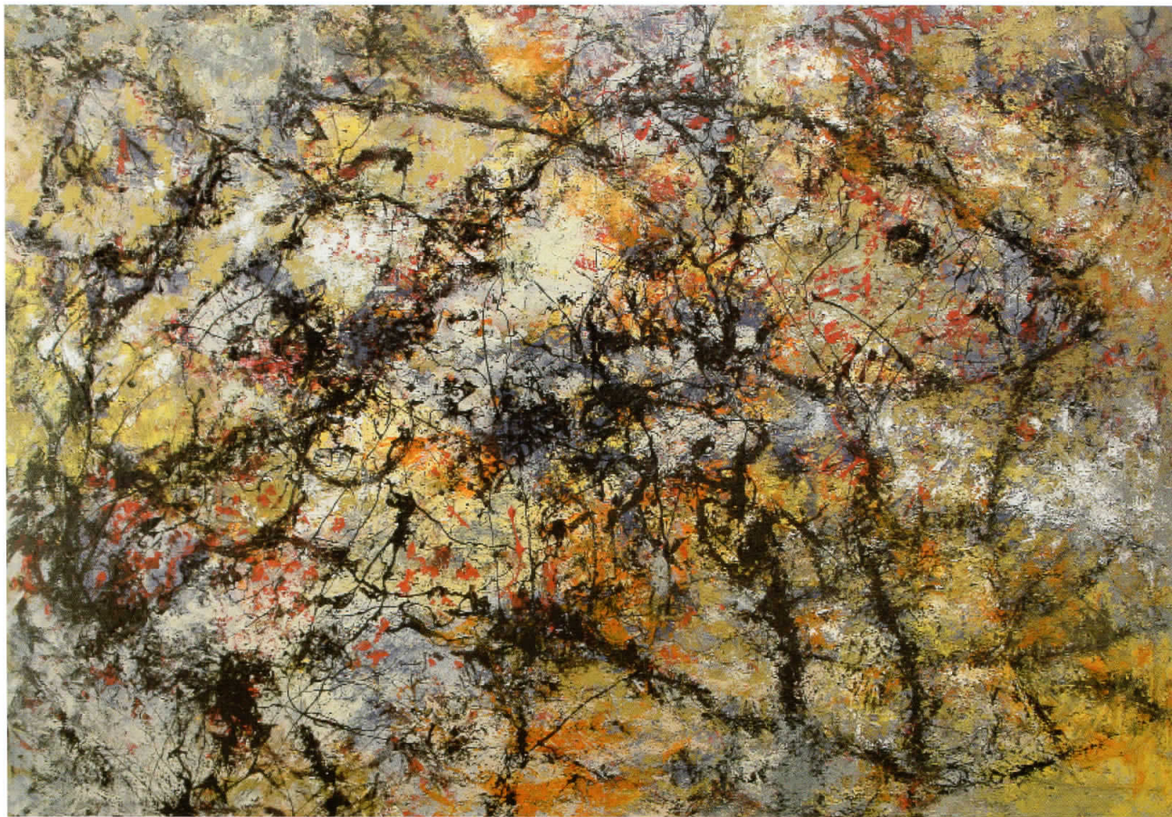
Риба и чун, 2007 комбинирана техника, 192x136 см.