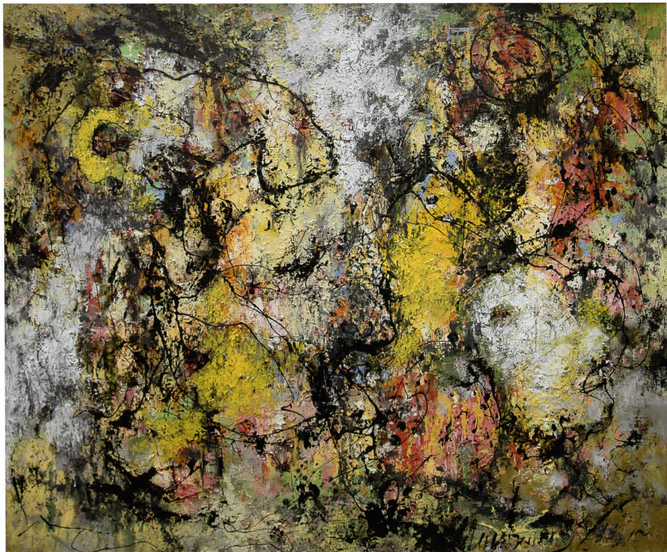
Утро во пајажина, 2006/7 комбинирана техника, 104x87 см.