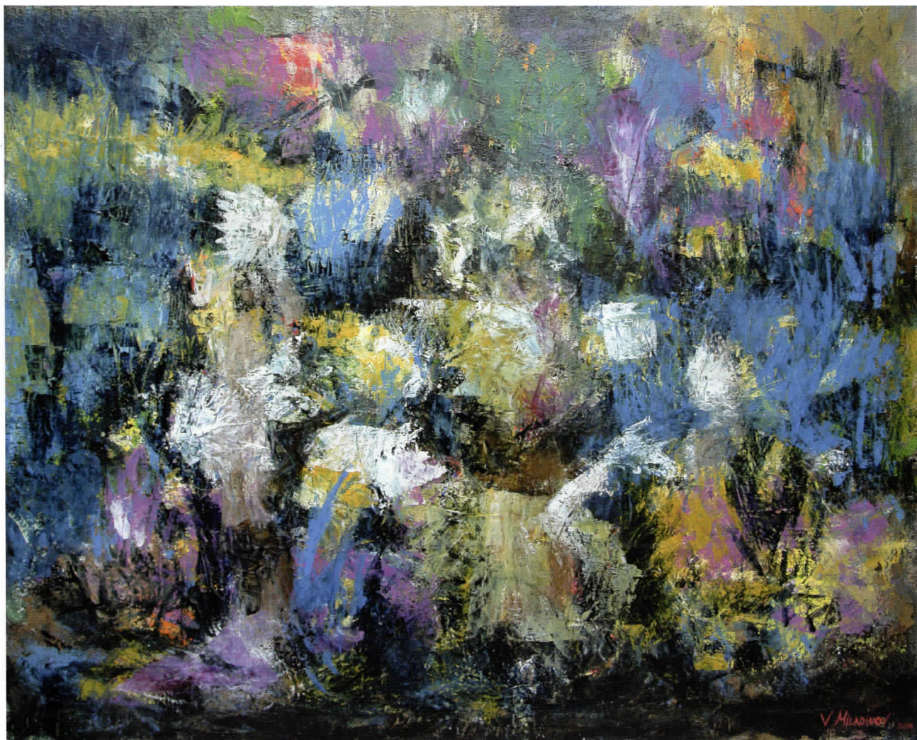
Црешови полиња, 2006 комбинирана техника, 89x75 см.