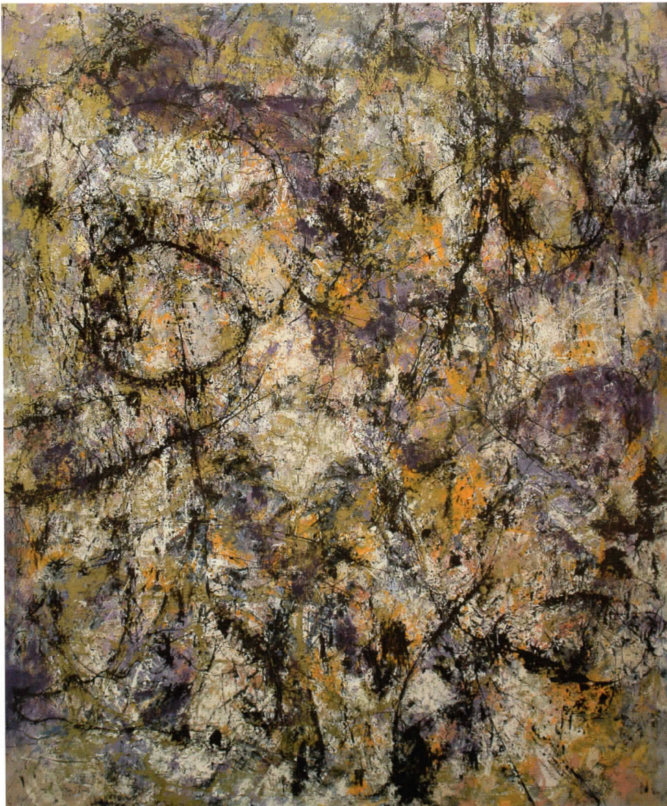
Игра крај патот, 2007 комбинирана техника, 152x184 см.