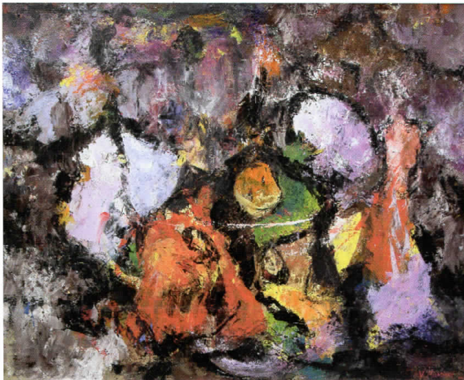
Снежна пештера, 2006 комбинирана техника, 92x76 см.