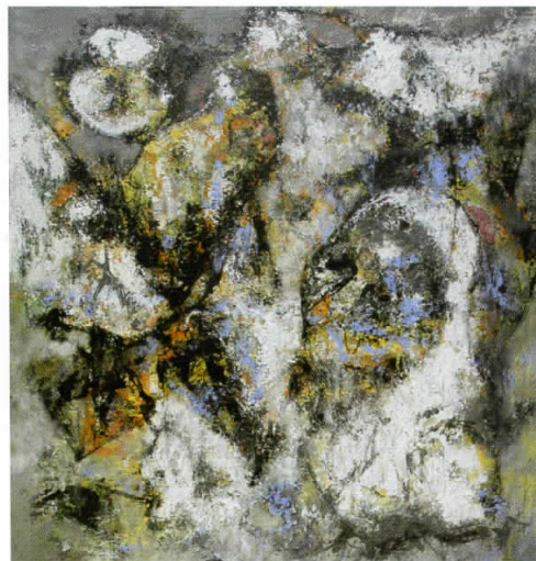
Минато во утрешниот ден, 2006 комбинирана техника, 75x79 см.