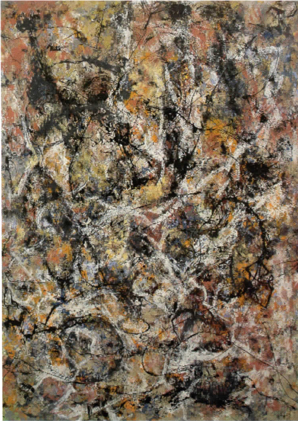
Без наслов, 2007 комбинирана техника, 135x192 см.

Miladinov's paintings reflect the internal struggle between concept and emotional expression of a painting, and they move between reason and unbridled creative imagination. This is, in fact, the context of the restless search for sense and content of non-figurative art.