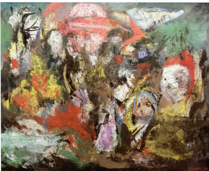
Предградие, 2006 комбинирана техника, 107x87 см.