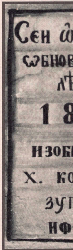
La fresque au St Dimitri à