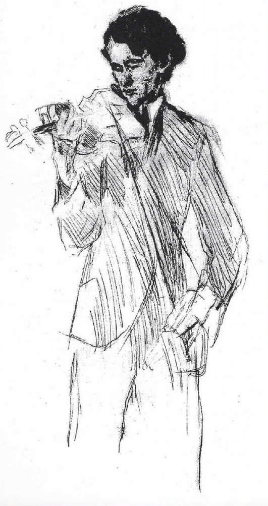
Макс Слефогт, Портрет на виолинистот Андреас Вајсгербер, 1922

Значаен уметник на германското сликарство во периодот на преминот од импресионизмот кон експресионизмот. На неговиот развиток влијаат постарите мајстори (Питер Пол Рубенс), француските реалисти (Ж.Б.Лепаж) и импресионисти (Е.Мане). Во немирна и еклектичка потрага по сопствениот израз минува низ неколку фази, од кои е карактеристична фазата во очи на Првата светска војна, кога беше на чело на берлинската сецесија. Претставува сликарски темперамент со јаки емоции наклонет кон патетиката, колорист, кој со широки намази на контрастни бои се стреми кон пластично обликување. Во сестраната тематика (митолошка, библиска фигурална композиција, портрет, пејзаж, мртва природа) се истакнуваат неговите актови и остро карактеризирани портрети (Герхард Хауптман, Георг Бредес, Едуард Кејсерлинг) како и серијата автопортрети. Во подоцнешната фаза ја смирува палетата, постигнувајќи смирувачка хармонија во приказните на германските предели и мртви природи со цвеќе. Претчувствувајќи ја смртта - (14 години живеел парализиран) во своето творештво внесува елементи на нестварно, сенишно и визионерско. Нагласувањето на остриот на контурите и смислата за гротеска особено доаѓа до израз во неговата графика. Ги илустрирал делата на Гете, Шилер, Свифт (Патувањата на Гуливер), Балзак и др. Неговиот придонес во сецесијата претставува компонента која влијаела врз формирањето на германскиот експресионизам. За уметноста пишува - критички и полемички.