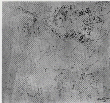
Никола Мартиновски „Венец на злото“, 1953