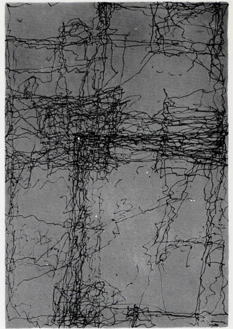
Андреј Јемец „Голем цртеж“, 1984

Рефлексии од ликовната практика на седумдесетите се насетуваат и во цртежот на Т. Горјуп, чиј инетрес е сведен на еден предмет (чевли), што лебди на неутралната позадина, и ја губи улогата на симбол и знак, јавувајќи се како назнака на извесни егзистенцијални проблеми. Истото важи и за Ж. Јаки