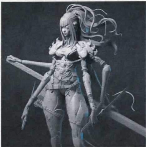
Cyborg Spider Lady concept by Muju