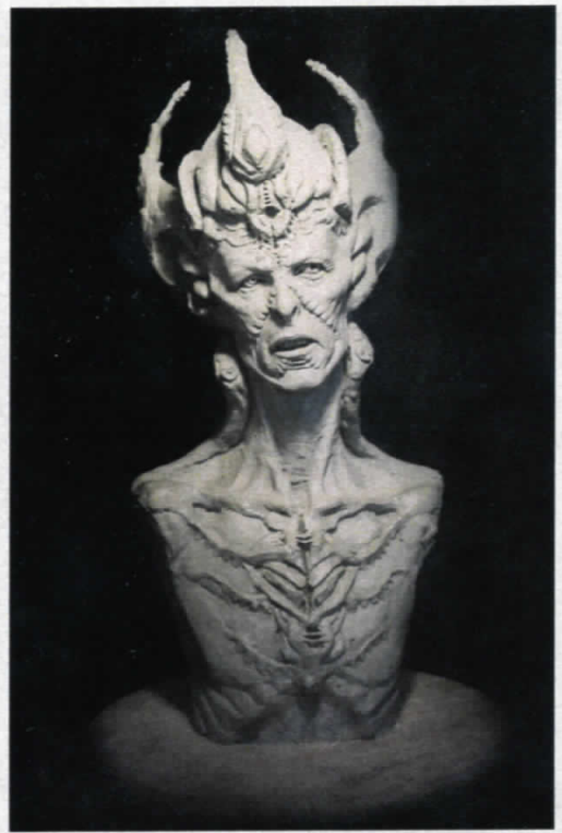
David Bowie Alien Shaman