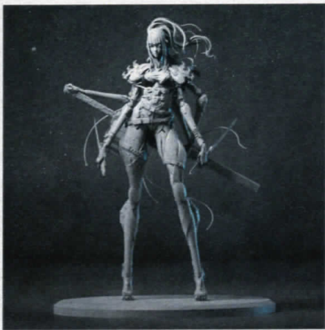
Cyborg Spider Lady concept by Muju