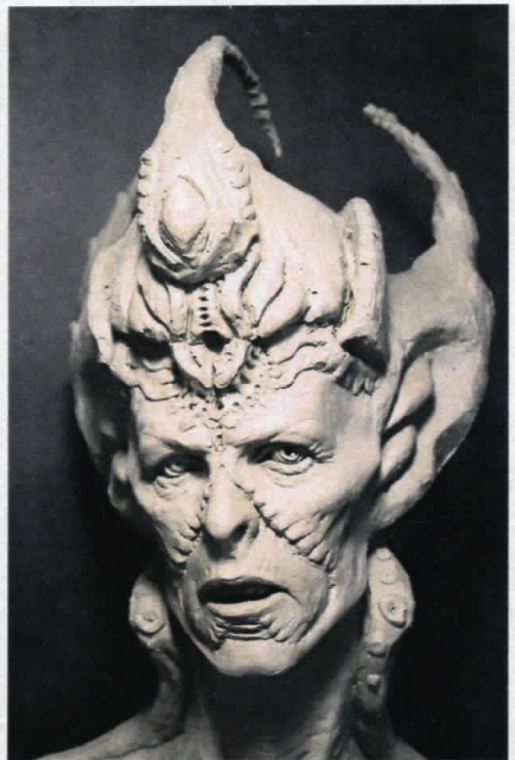
David Bowie Alien Shaman