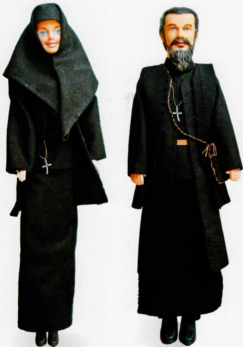
“Православа и Богољуб” - 2009 30x10x5см и 30x10x5см полимер, текстил, пласика