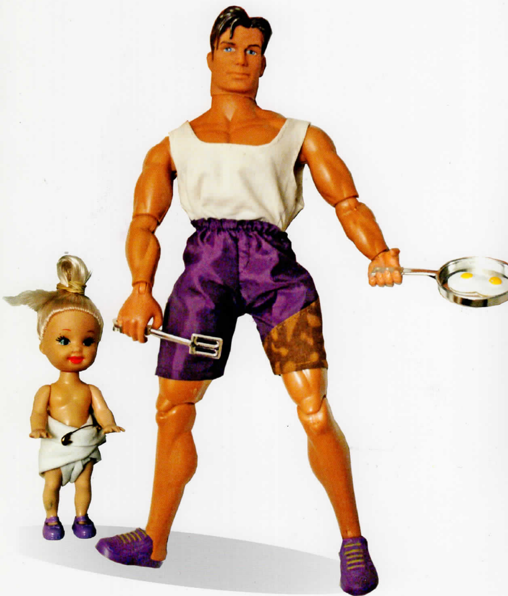
“Домаќин”- 2009 : 30x15x5см пластика, текстил, акрил