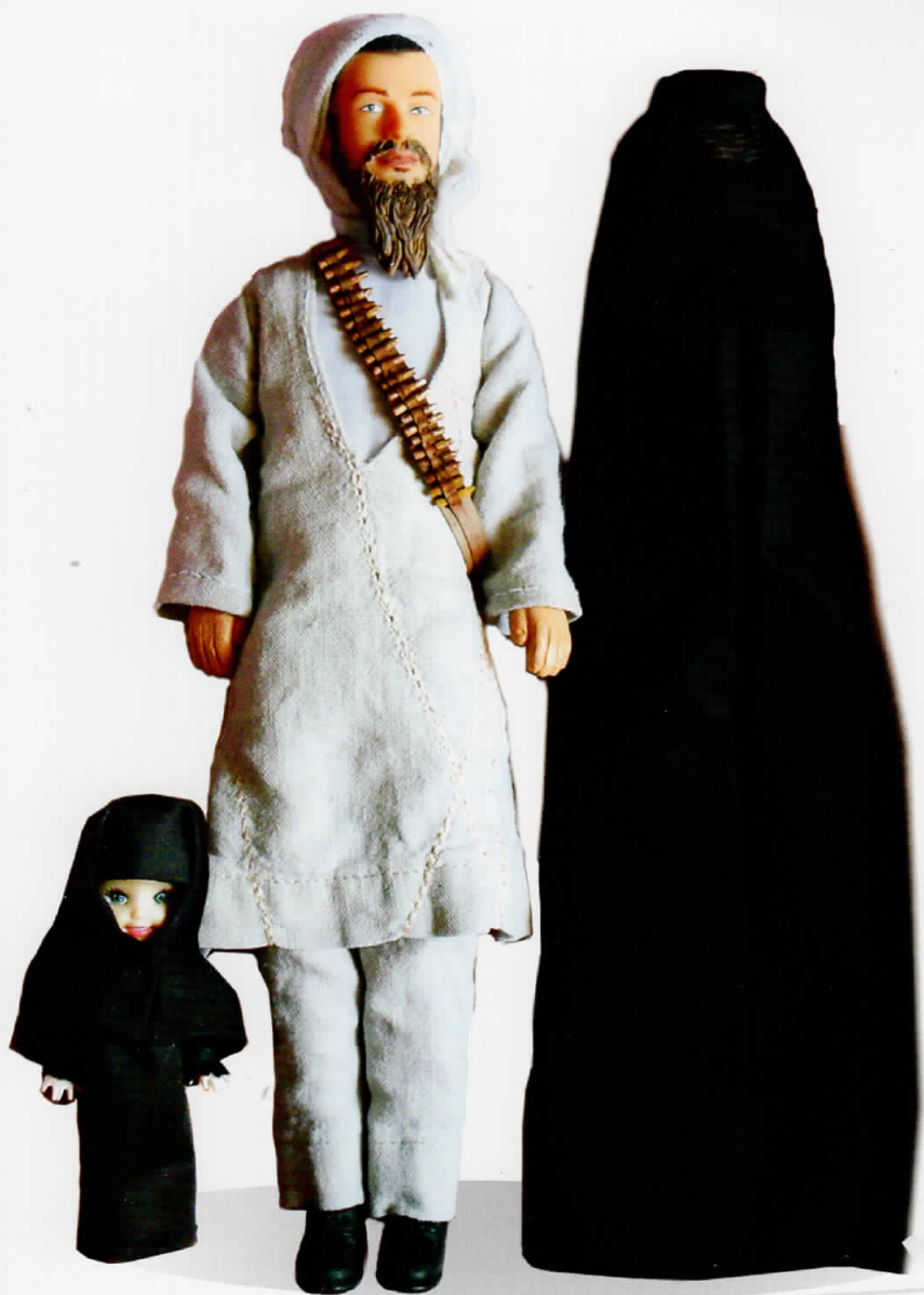
“Семејство” - 2009 30x23x5cm полимер, текстил, акрил