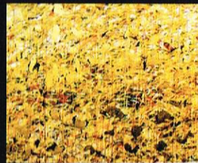
Задисонце, 2002 акрил и фолија на хартија, 100x150cm. Sunset, 2002 acrylic and foil on paper, 110 x 150 cm.