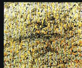
Внатрешен предел, 2002 акрил и фолија на хартија, 110x150cm. Inside Landscape, 2002 acrylic and foil on paper, 110 x 150 cm.