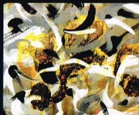
Сенката на отсутноста (детал), 2003 акрил и фолија на хартија, 110x150cm. The Shadow of the Absent (detail), 2003 acrylic and foil on paper, 110 x 150 cm.