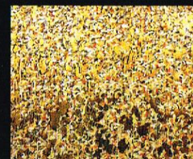
Плевен на времето, 2002 акрил и фолија на хартија, 110x150cm. Weeds of Time, 2002 acrylic and foil on paper, 110 x 150 cm.