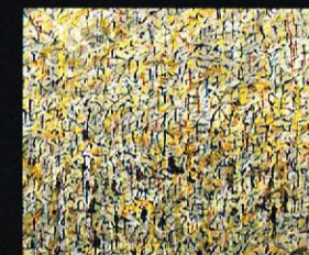
Мрсење на болката, 2003 акрил и фолија на хартија, 110x150cm. Spawning of Pain, 2003 acrylic and foil on paper, 110 x 150 cm.