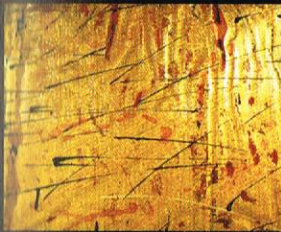
Кројтење на Пегасиите (детал), 2002 акрил и фолија на хартија, 100x150cm. Timing of the Pegasus (detail), 2002 acrylic and foil on paper, 110 x 150 cm.

The exhibition and the catalogue supported by the: Ministry of Culture of the Republic of Macedonia