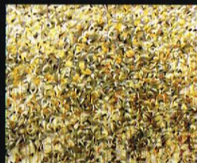
Сенката на отсутноста, 2003 акрил и фолија на хартија, 110x150cm. The Shadow of the Absent, 2003 acrylic and foil on paper, 110 x 150 cm.