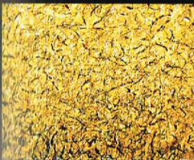
Будење на невестите I, 2002 акрил и фолија на хартија, 110x150cm. Awakening of the Brides I, 2002 acrylic and foil on paper, 110 x 150 cm.