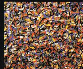
Распорена ноќ, 2002 темпера и пастел на хартија, 110x150cm. Night Cut Open, 2002 tempera and pastel on paper, 110 x 150 cm.