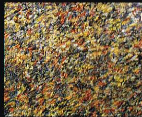
Возмезиен предел, 2002 темпера и пастел на хартија, 110x150cm. Turbulent Landscape, 2002 acrylic and foil on paper, 110 x 150 cm.