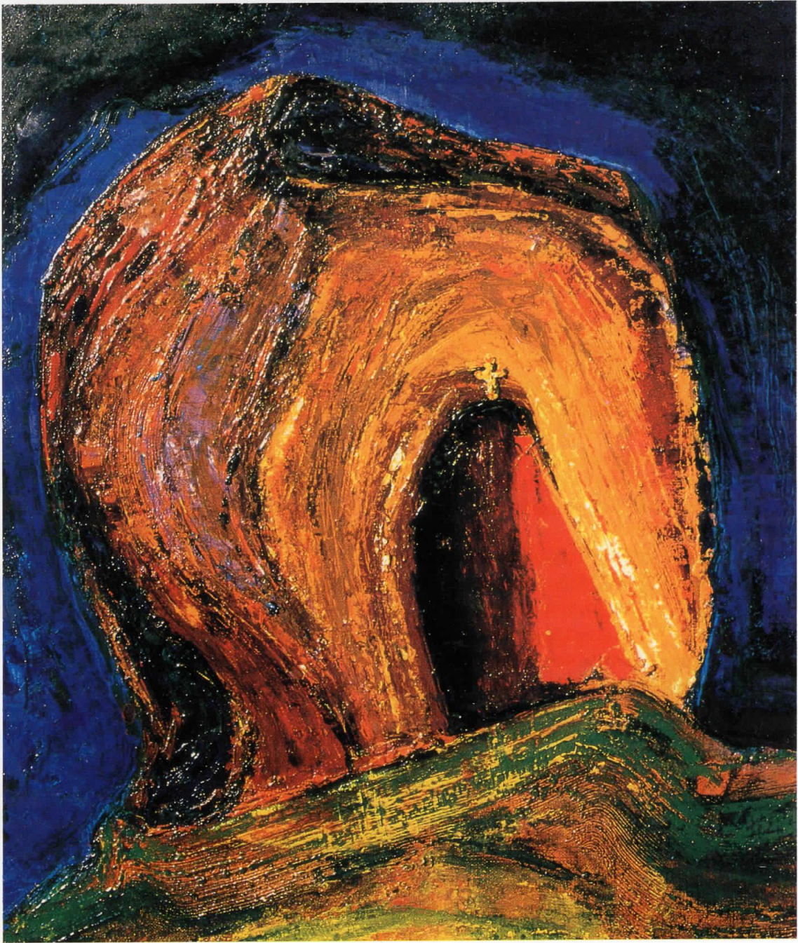
"Свет камен", 1996