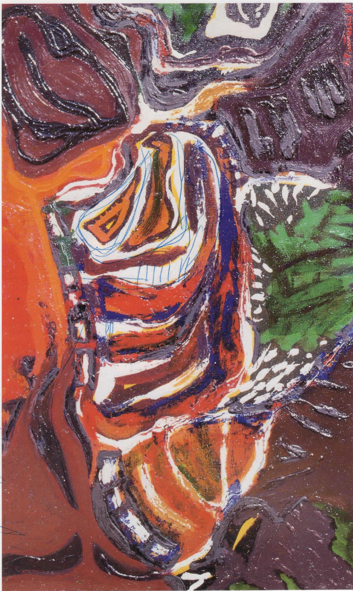
“Силни бразди”, 1995