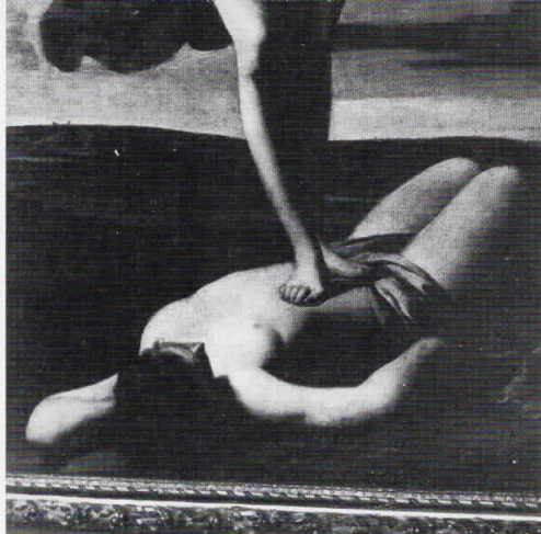
Ле Нен, Алегорија на победата, околу 1635, масло/платно, Париз, Лувр, детаљ

И зложбата претставува заеднички поглед врз последните пет векови француско сликарство на еден фотограф и на една историчарка на уметноста. Истражува еден фиктивен и имагинарен геометриски простор сместен во точката на проникнувањето меѓу сликата, зборовите и фотографијата. Окото на фотографот Жан-Мишел Оклер се движи низ 40 ремек дела на француското сликарство, се определува за еден фрагмент, за еден детаљ и на тој начин