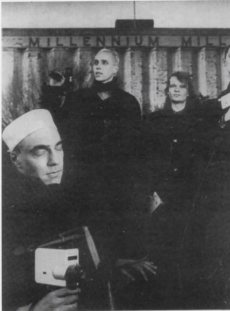
The Last of England, 1987

"НОМО MOVIES", Супер 8 префрлен на 16 мм, колор, 9 мин.