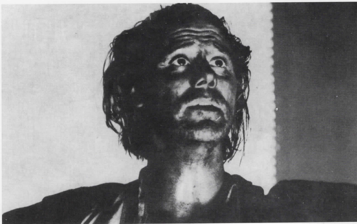
Edward II, 1991

Во 1991 година тој изјави, "Сакам да сум дел од конечните промени на законите за хомосексуалците и да ја негувам својата градина". Во почетокот на февруари 1994, тој реши да ги откаже сите лекарски терапии. Во тоа време, британскиот Долен дом требаше да гласа по нацрт-законот за намалување на возрастната граница за легализирање на мажите хомосексуалци од 21 на 16 години. Царман пред тоа долго време водеше силна кампања за овој нацрт-закон и велеше дека го одолжува животот само за да го дочека неговото прогласување. Меѓутоа, утрото на 21 февруари, на насловните страници на Тајмс и други весници истовремено беше објавено и гласањето за споменатиот нацрт-закон, планирано за попладнето истиот ден, како и веста за смртта на Дерек. Во вакви околности беше направен нечесен компромис - возрастната граница се намали на 18, наместо 16 години.