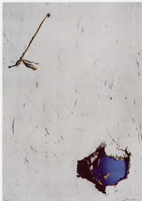
Доменик КАПОБЈАНКО „Топка во стена“, 1975

19. ПЛАН ЗА МРТОВЕЧКИ САНДАК II, 1981 сито-печат, 3/22, 55, 5 × 75,5