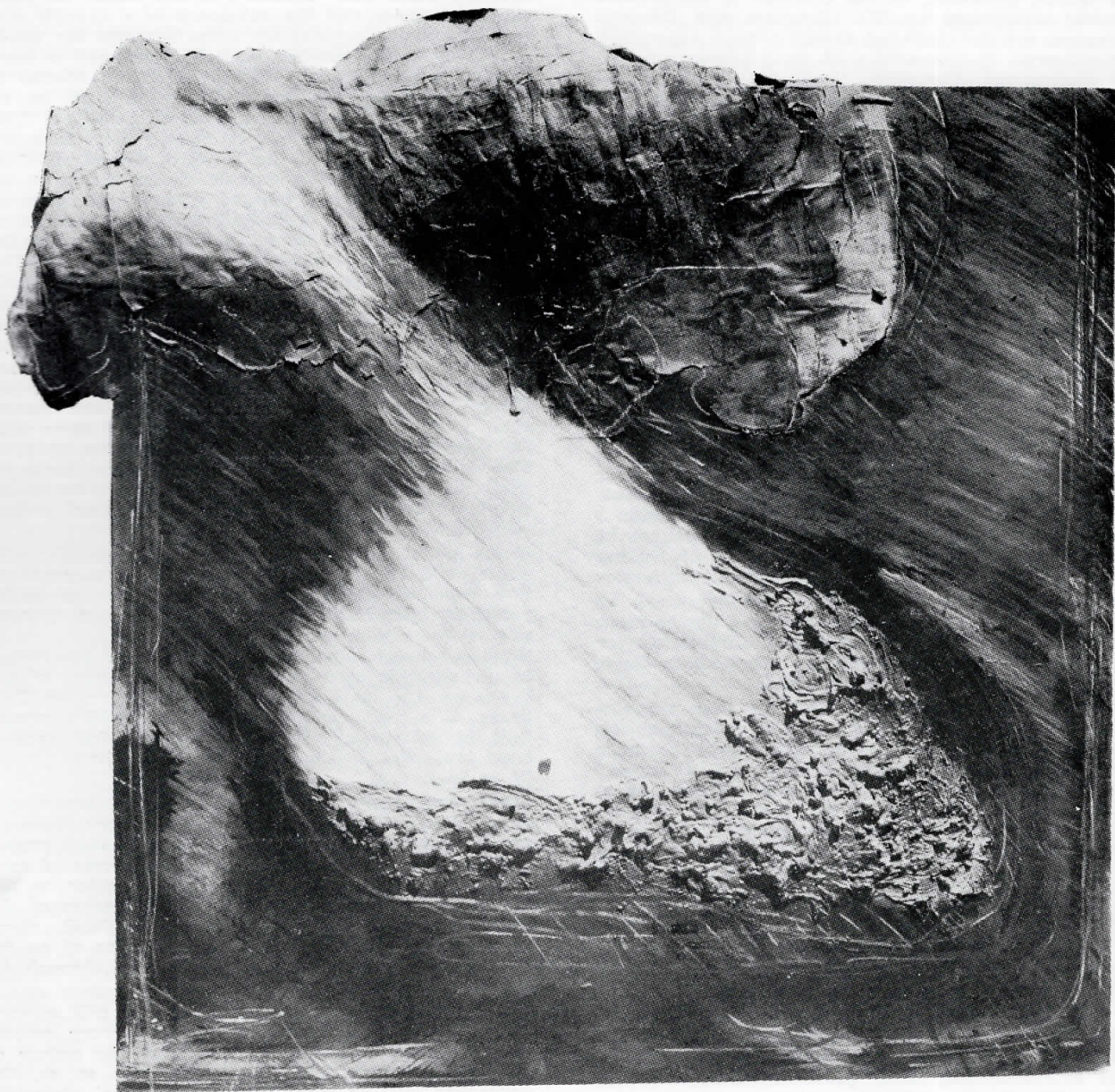
ЕЛИ КРИСИДУ Без наслов, 1988 мешана техника, 140 x 100 см.