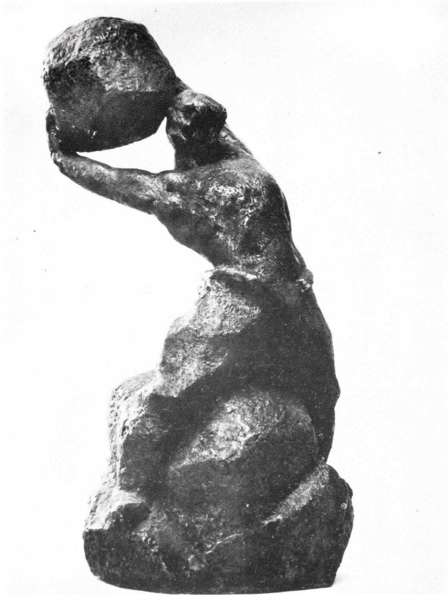
НА МЕЧИ КАМЪК