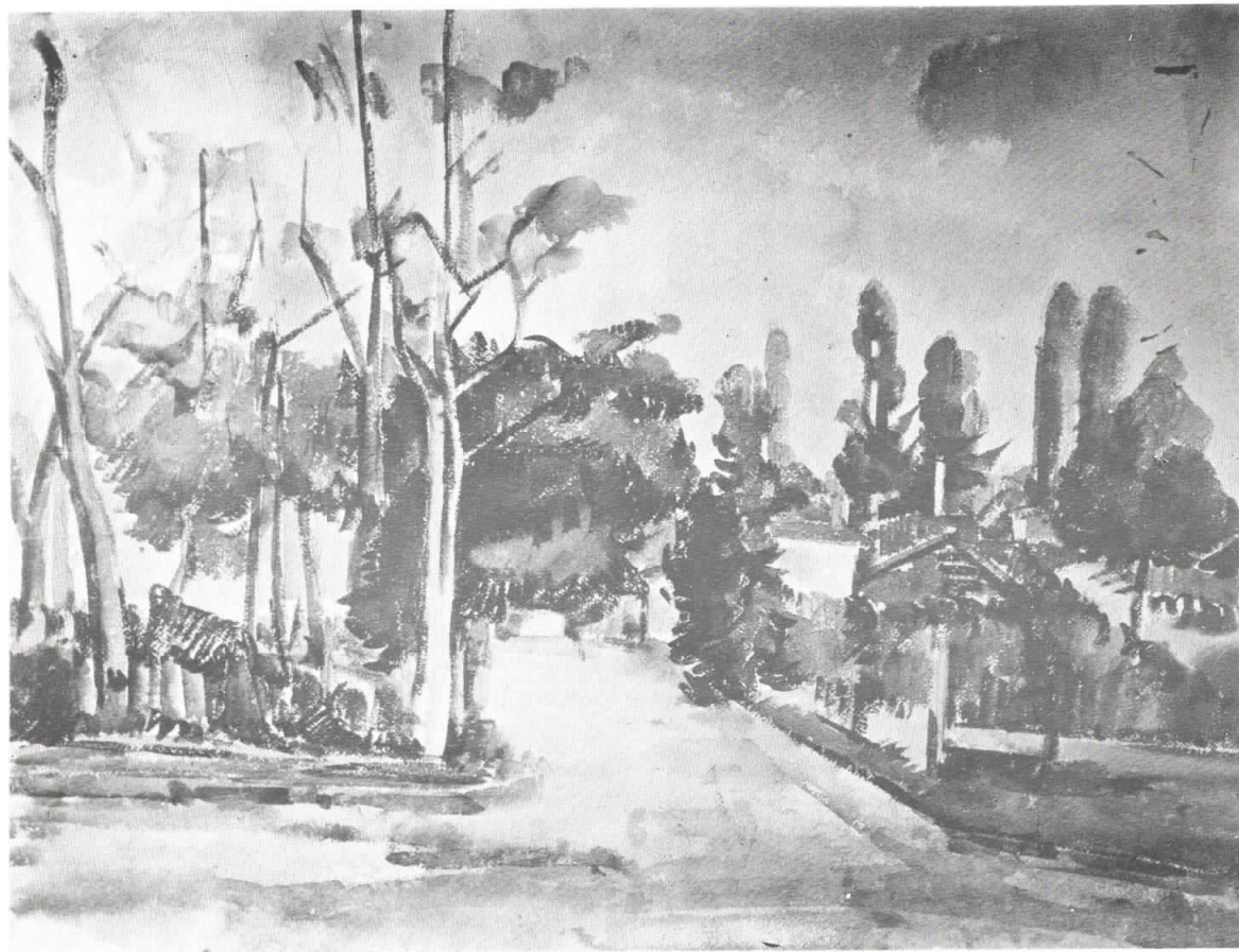
МОТИВ ОТ ОКОЛНОСТТА НА СКОПИЕ