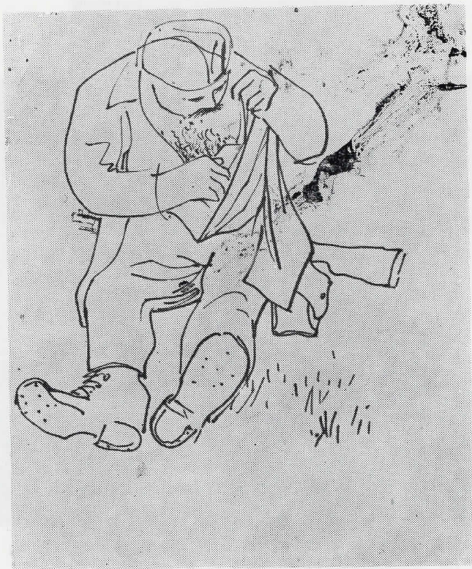
ЧИСТЕЊЕ НА ВОШКИ III (од цикл. „Митрашинци“) 1944 цртеж — туш, 18 x 13,5 сопс. Музеј на современата уметност, Скопје