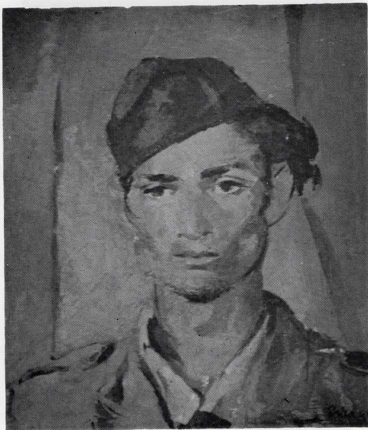
ПАРТИЗАН, 1944 масло на шпер-плоча, 45 x 39 сопс. Уметничка галерија, Скопје