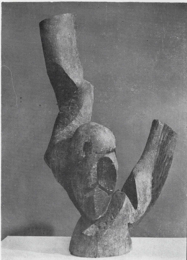
П О В И К, 1969 дрво, 120 x 880 сопс. Музеј на современата уметност, Скопје