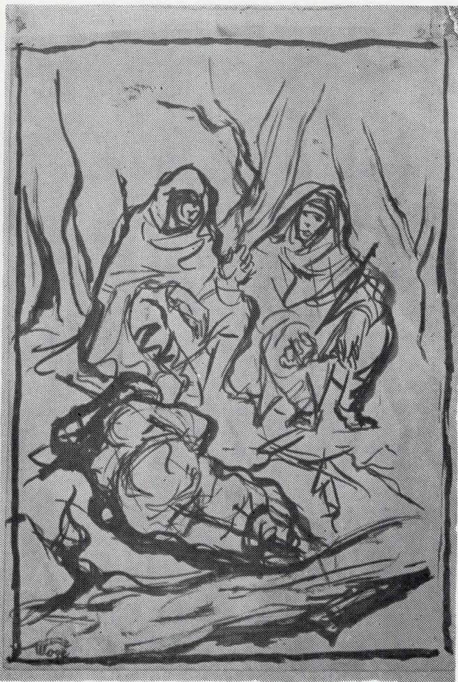
НА ПАЈАК ПЛАНИНА, 1944 цртеж — туш, 19 x 13,5 сопс. Музеј на современата уметност, Скопје