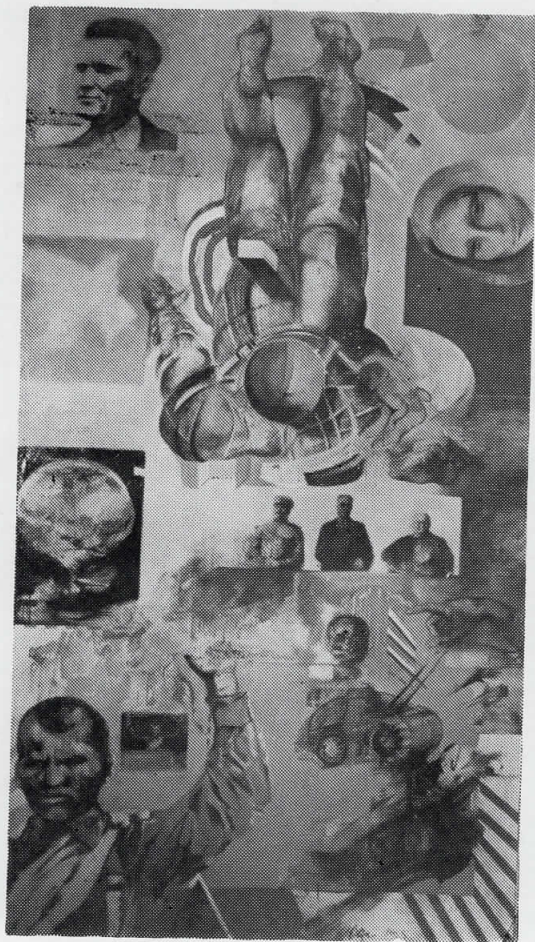
9. МАЈ — ДЕНОТ НА ПОБЕДАТА, 1965 масло на платно, 243 x 137 сопс. Музеј на современата уметност, Скопје