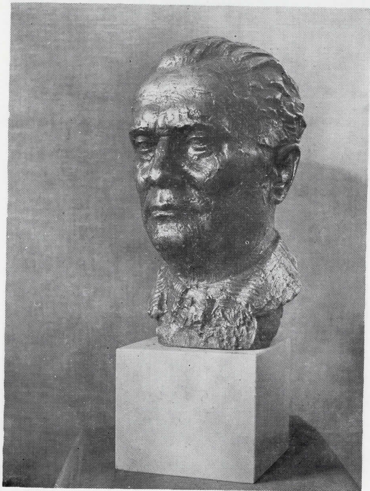
Т И Т О, 1962 сребро, 38 x 30 x 22 сопс. Музеј на современата уметност, Скопје