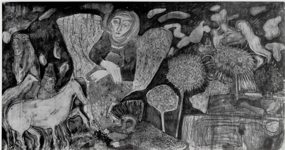
9. Прочистување, 1985