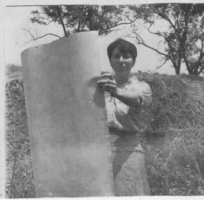
ГАЛЕРИЈА САВРЕМЕНЕ ЛИКОВНЕ УМЕТНОСТИ НОВИ САД