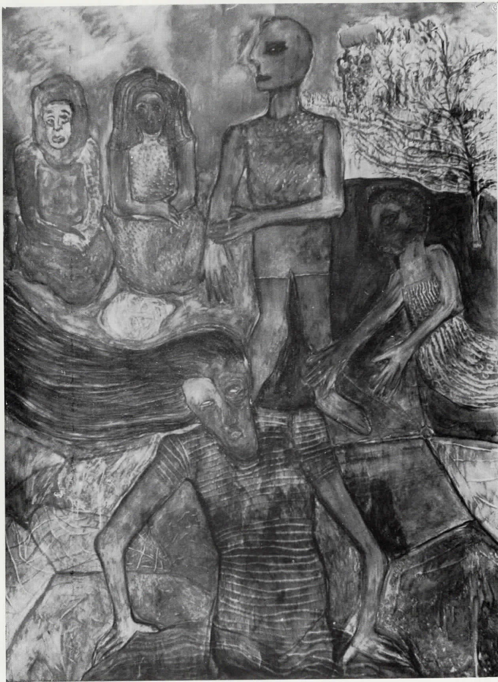
11. Зелени врач, 1985