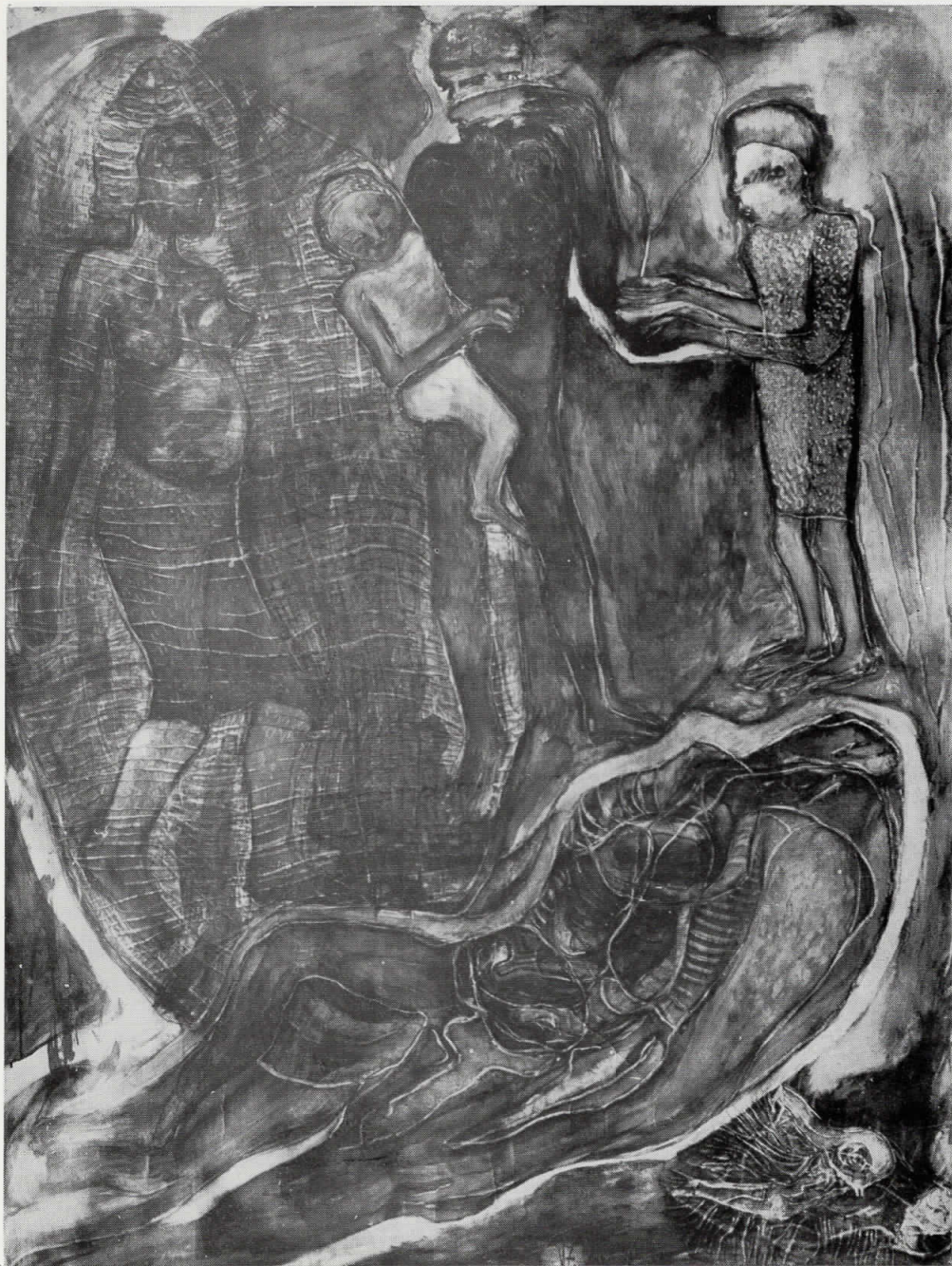
17. Стапица, 1985