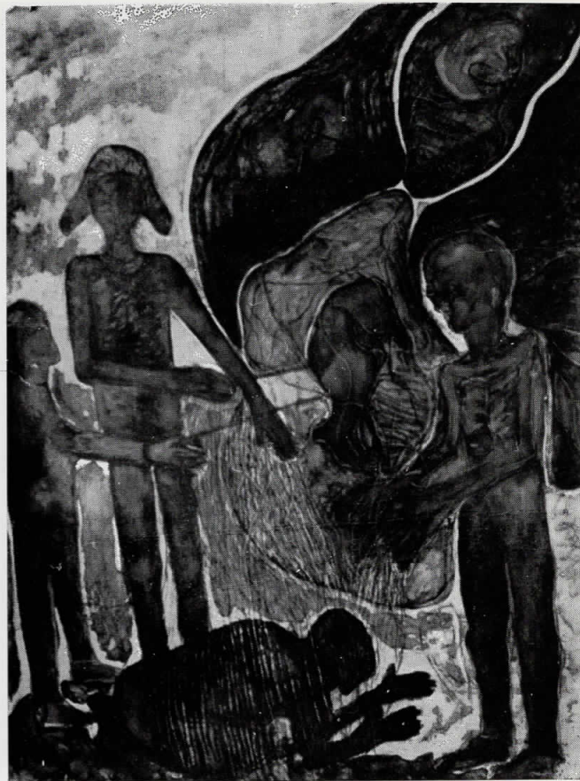
12. Апис, 1985