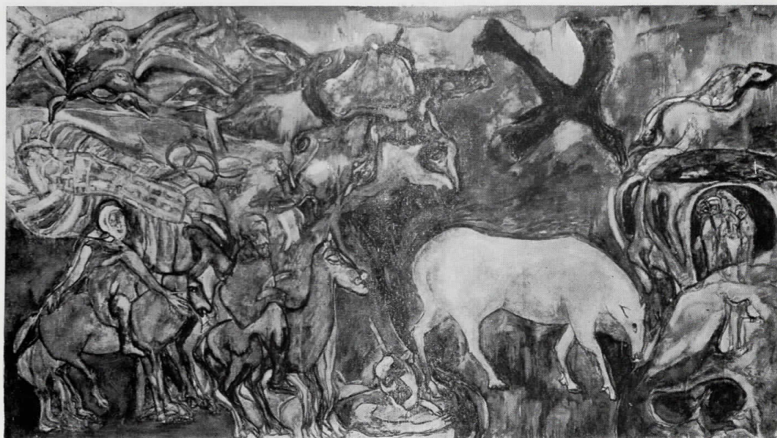
1. Чудо со птици, 1985