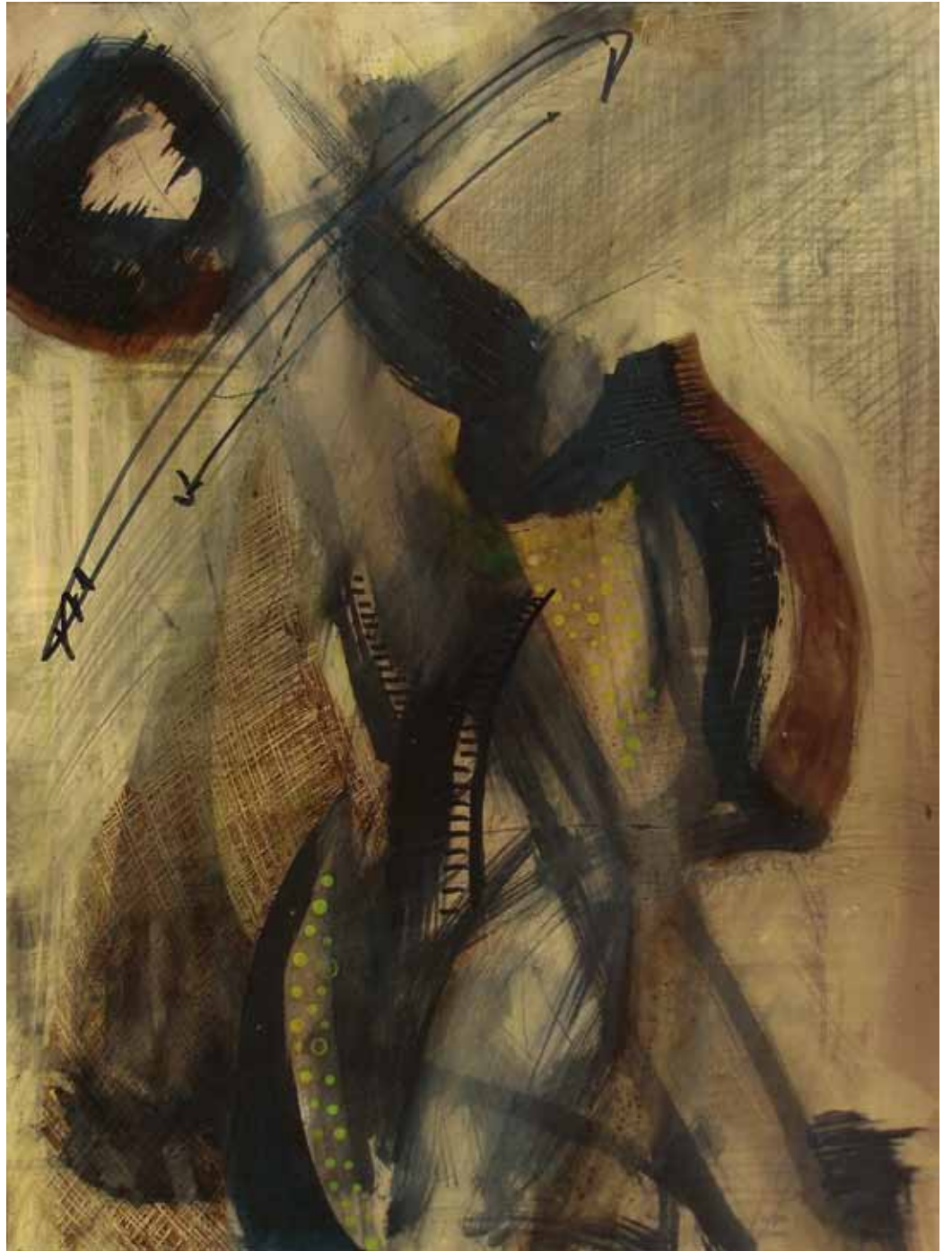
Љубов 1, 2009 год, ком. тех. на картон, 39 x 29 см