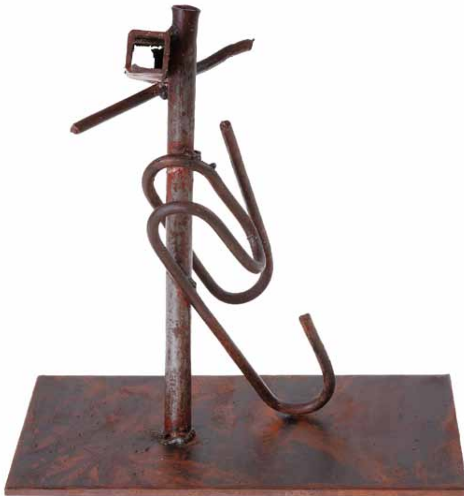
Спојување, 2009 год., железо, 24,6 x 14 x 8 см