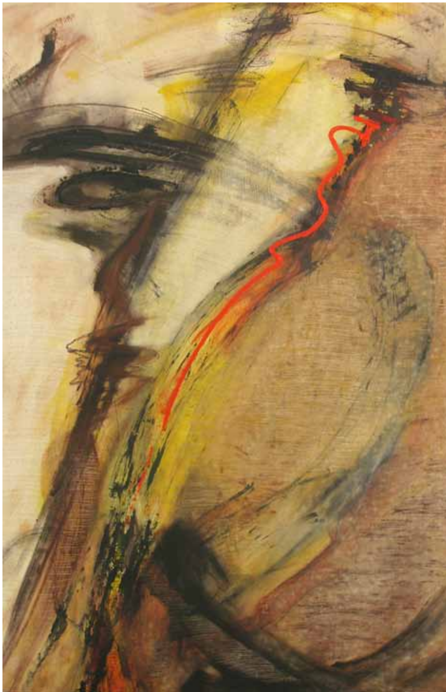
Унапредување 1, 2010 год., комбинирана техника, 55 x 85 см