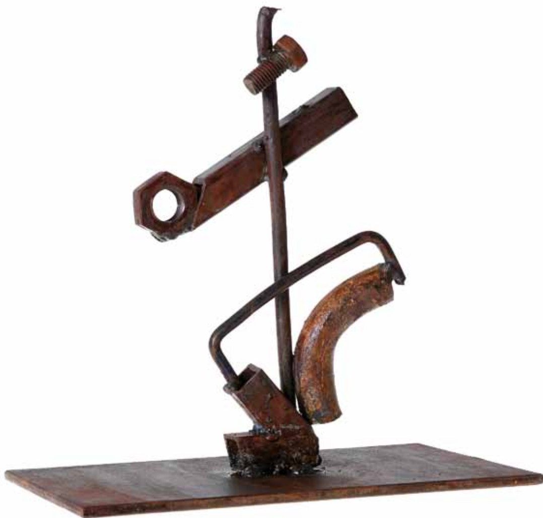
Двојност, 2009 год., железо, 25 x 15 x 5,5 см