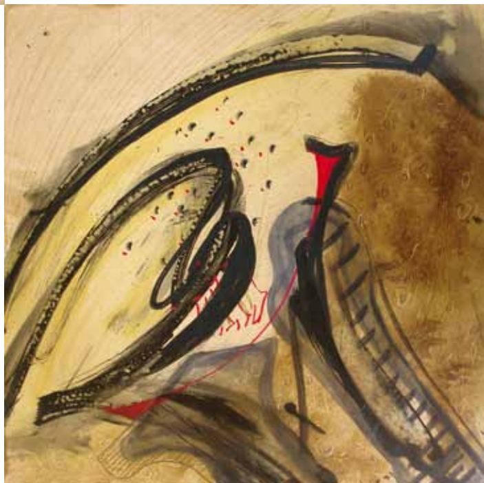
Желба, 2009 год., ком. тех. на картон, 30 x 30 см