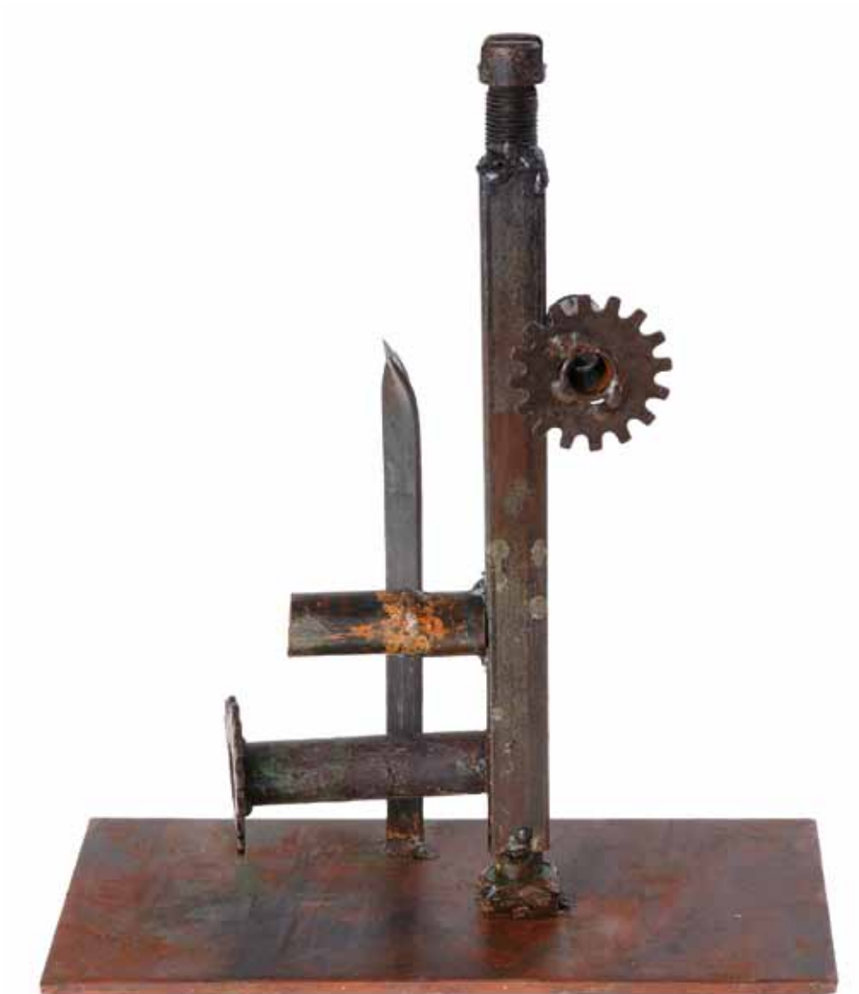
Врска, 2009 год., железо, 28,6 x 14,2 x 12,5 см