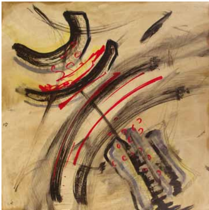
Радост, 2009 год, ком. тех. на картон, 30 x 30 см