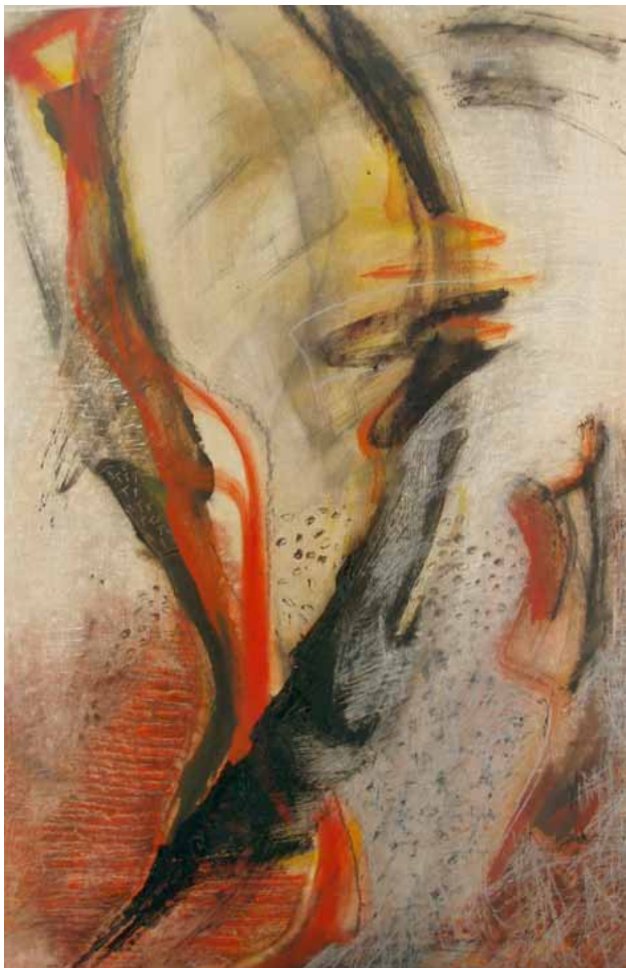
Портокаловиот ветер, 2009 год, комбинирана техника, 55 x 85 см