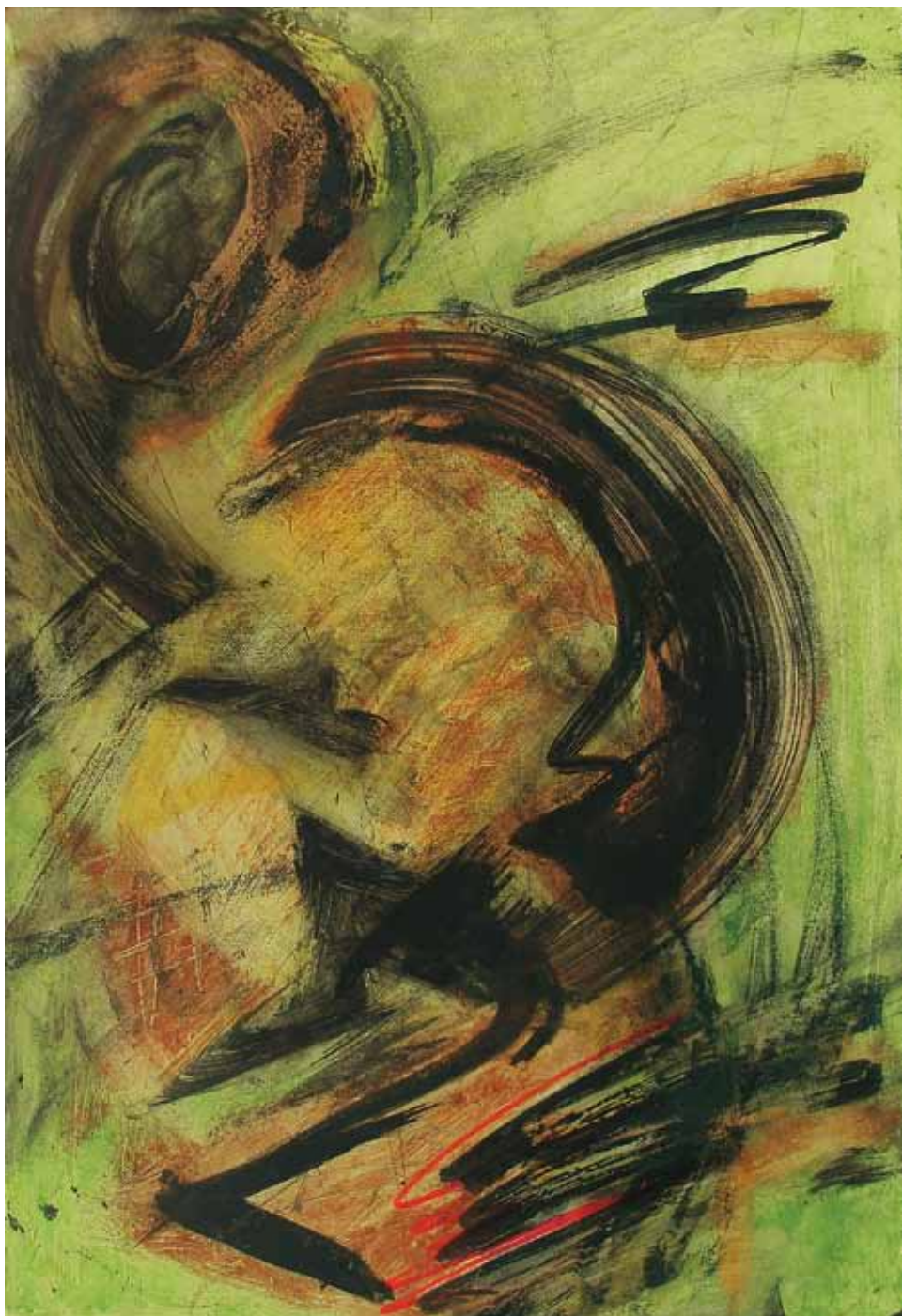
Love 2, 2009, mixed tech. on cardboard, 30 x 44 cm