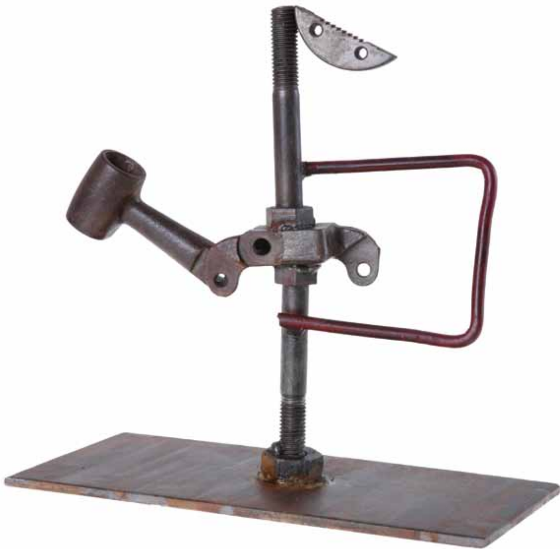
Отисок, 2009 год, железо, 24 x 22 x 6,5 см