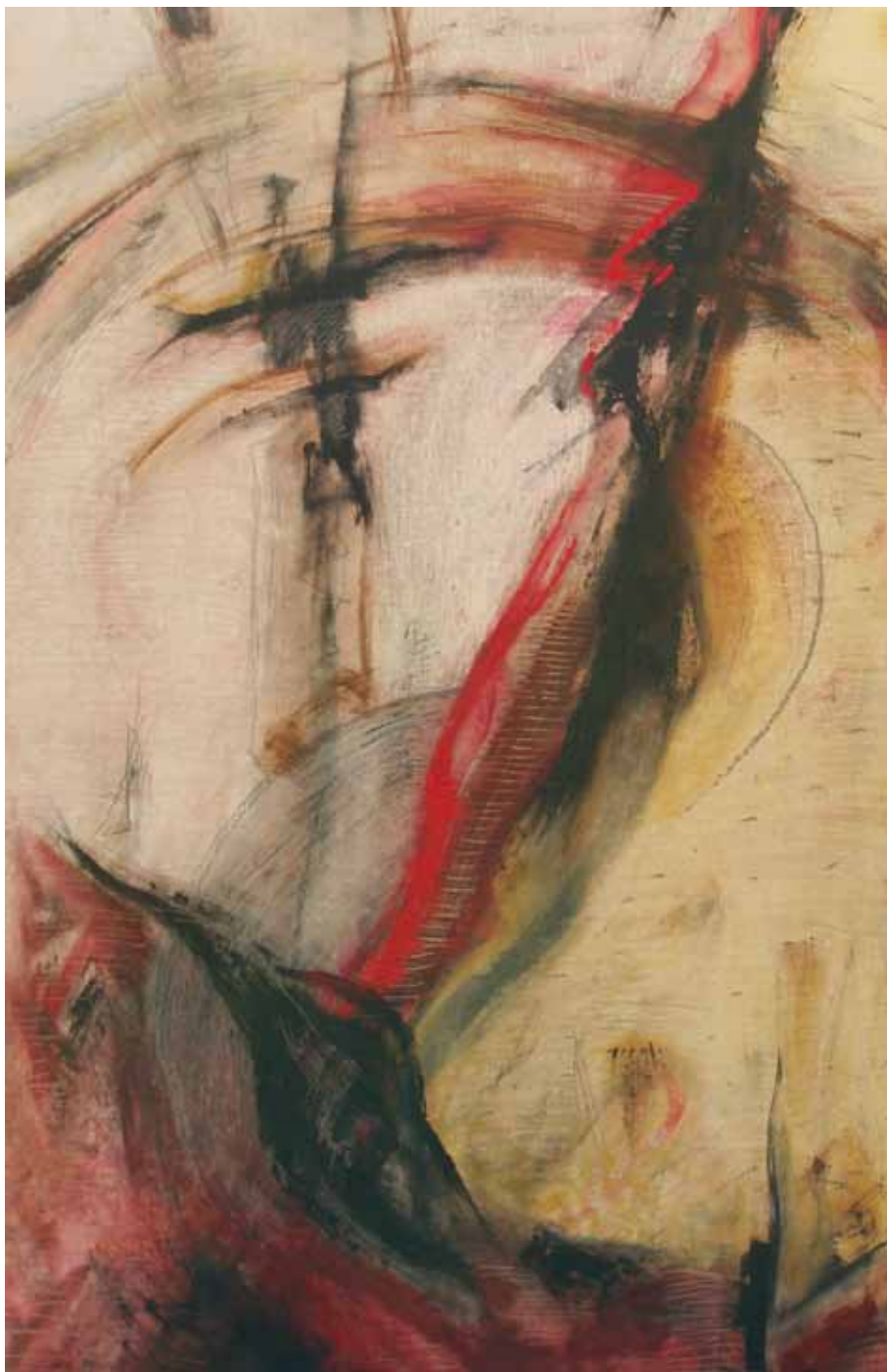
Унапредување 2, 2010 год., комбинирана техника, 55 x 85 см