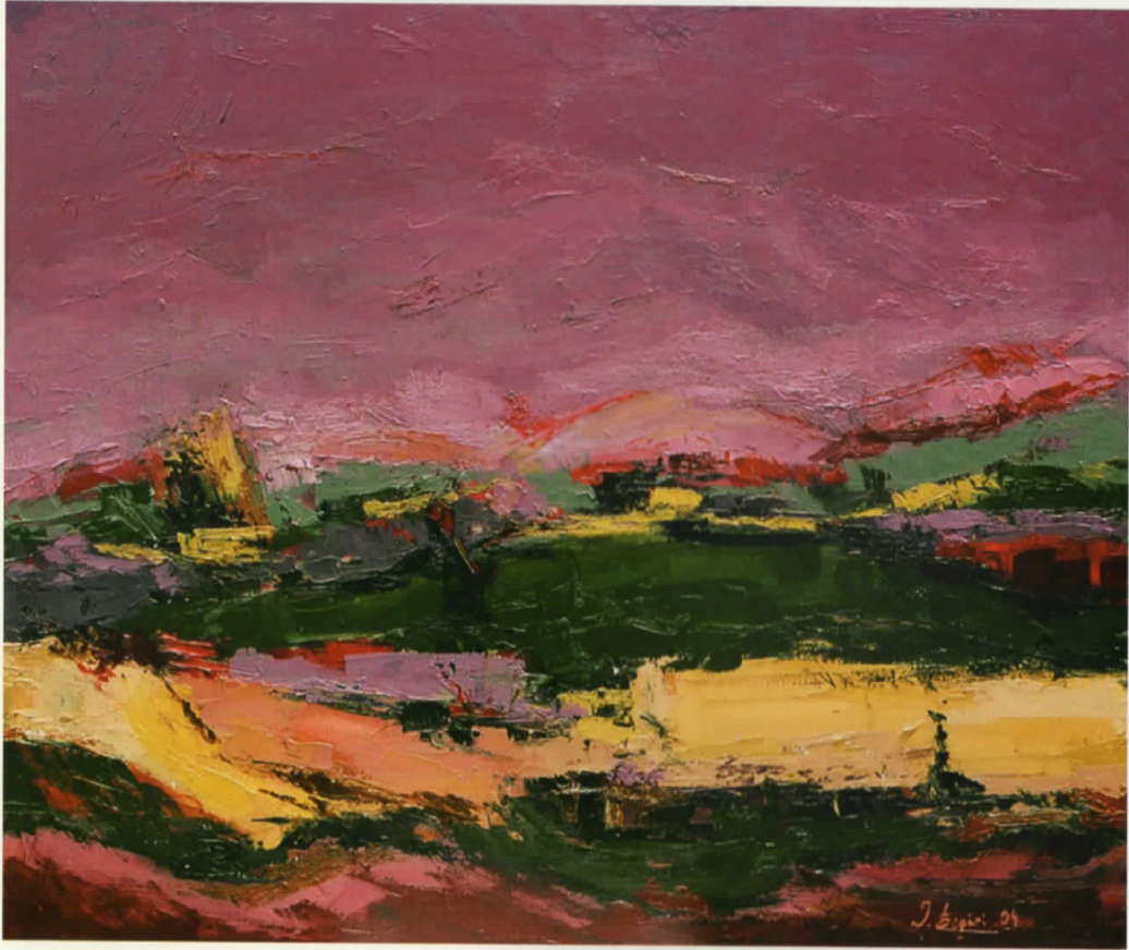
Vaj në pelhurë | Oil on canvas · 93 x 80 cm