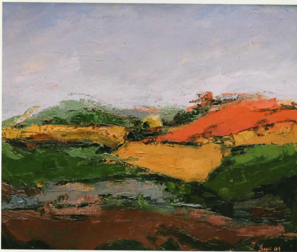
Vaj në pëlhurë | Oil on canvas · 93 x 80 cm