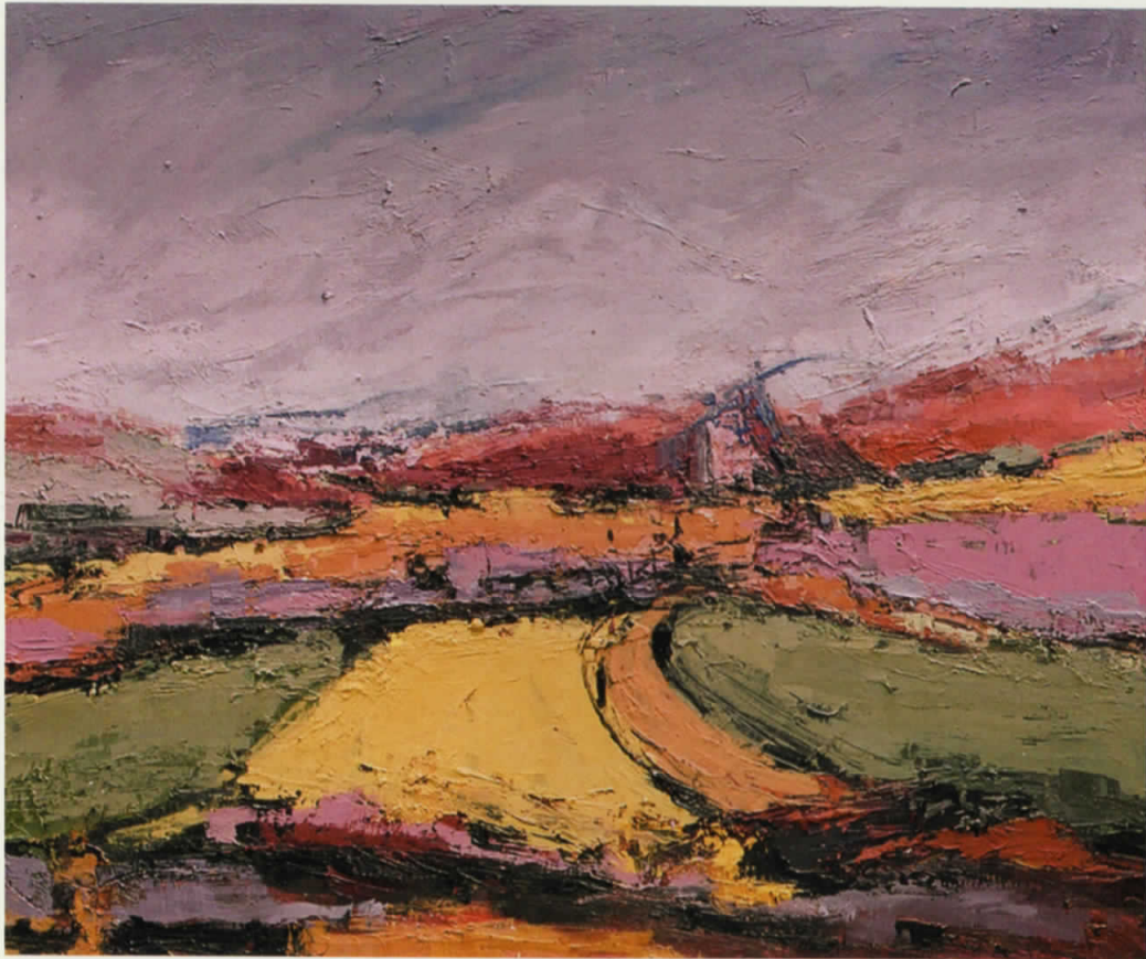
Vaj në pëlhurë | Oil on canvas · 87 x 71 cm