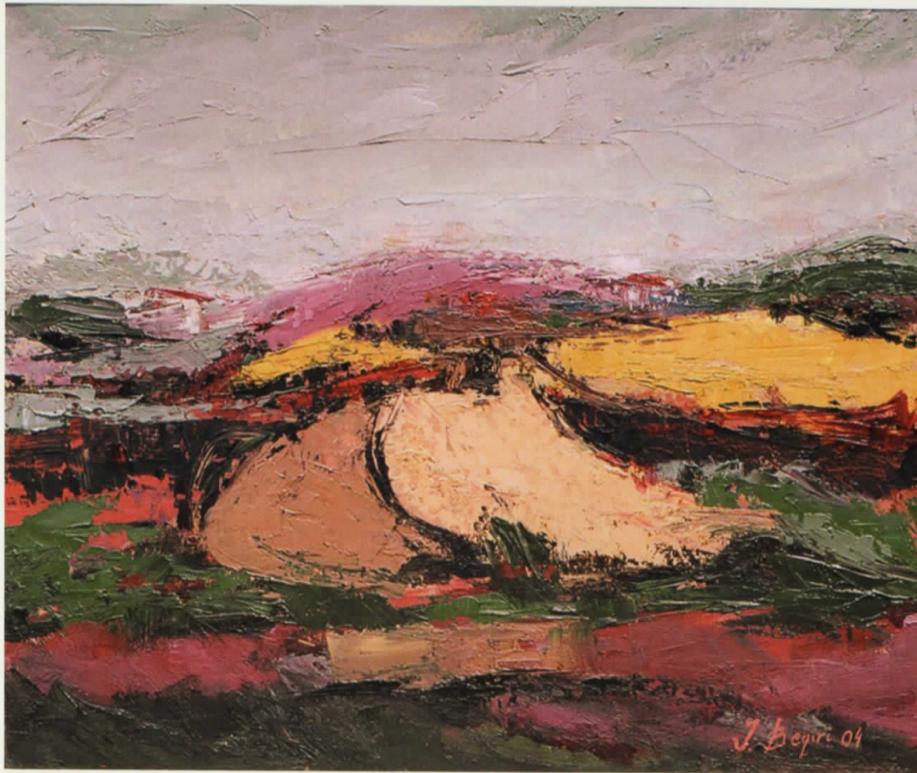
Vaj në pëlhurë | Oil on canvas · 66 x 56 cm