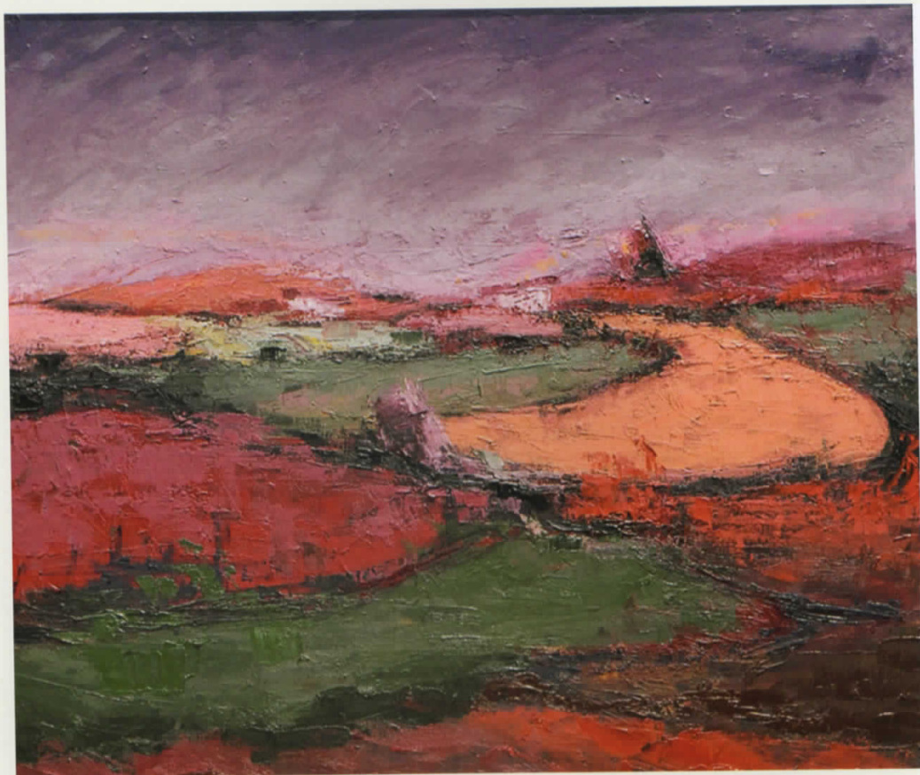
Vaj në pelhure | Oil on canvas • 113 x 100 cm