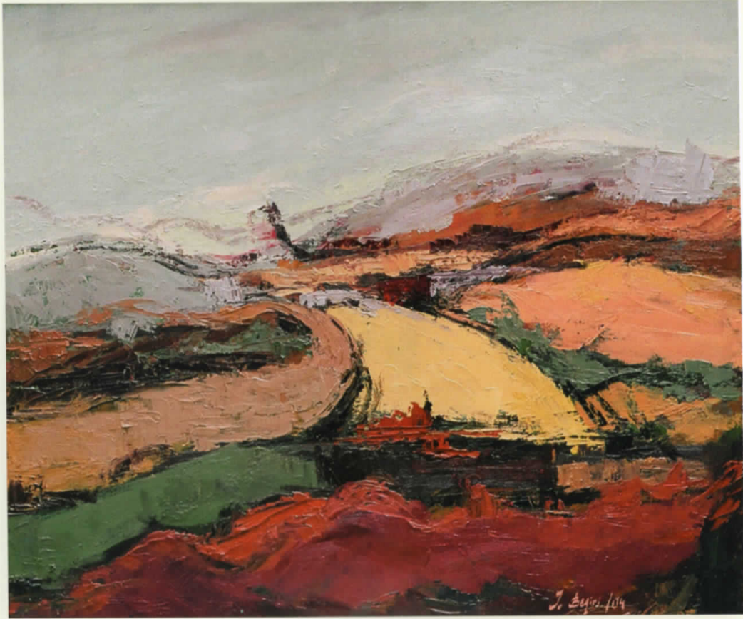
Vaj në pëlhurë | Oil on canvas · 100 x 87 cm