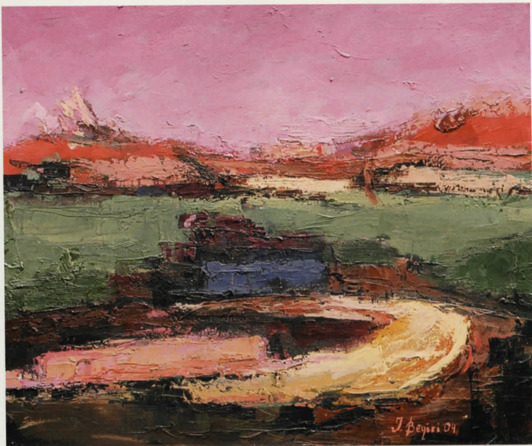
Vaj në pëlhurë | Oil on canvas · 65 x 56 cm