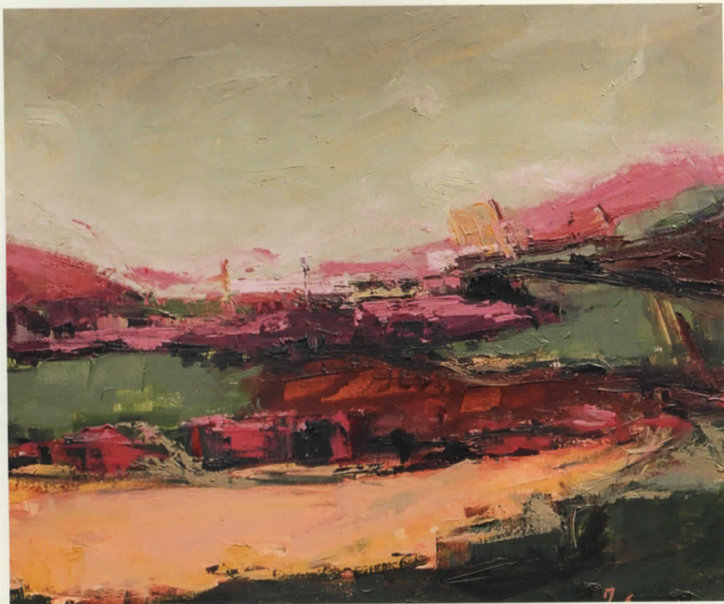
Vaj në pelhure | Oil on canvas · 80 x 71 cm