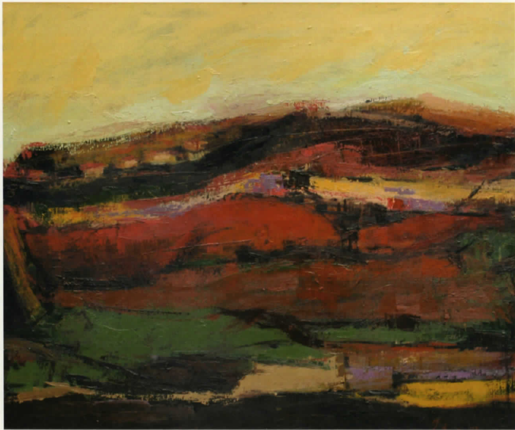
Vaj në pëlhurë | Oil on canvas • 110 x 97 cm