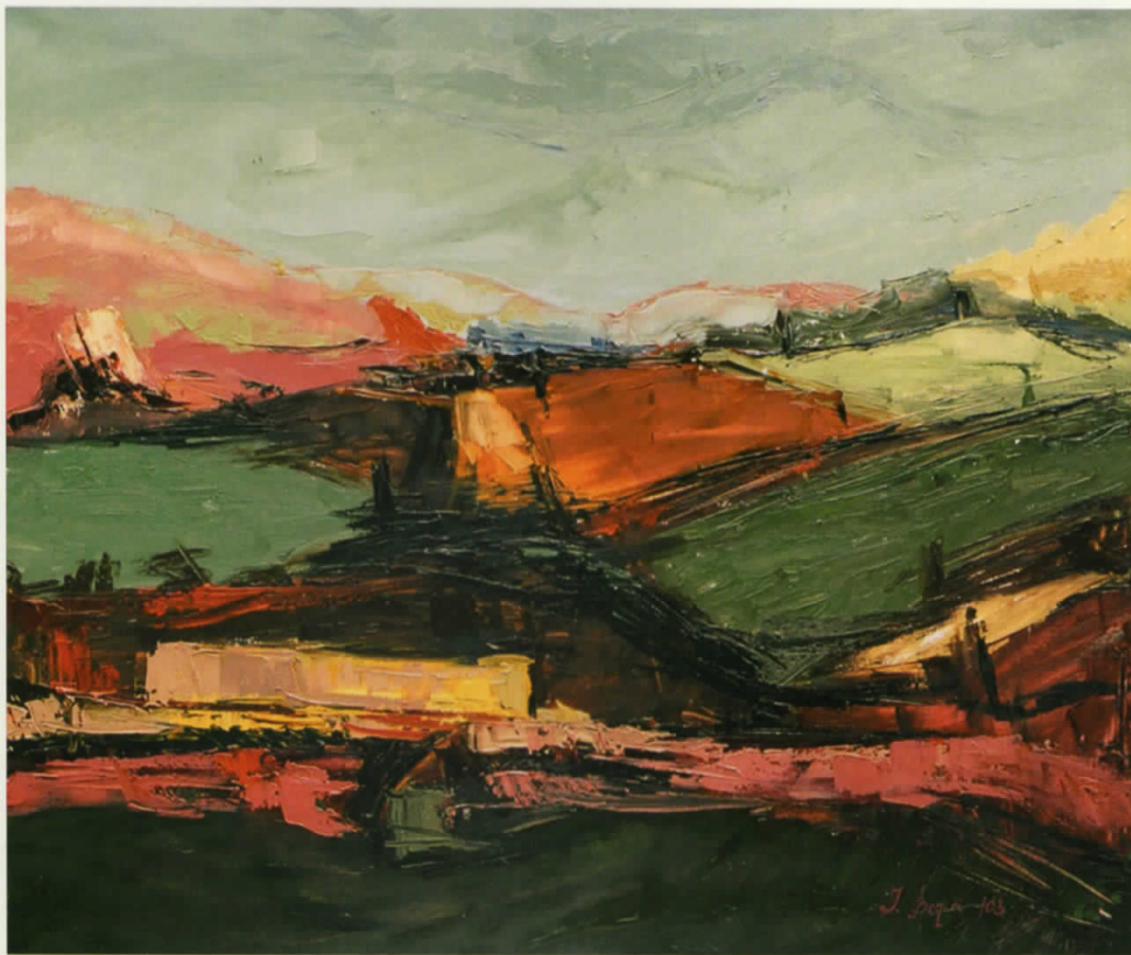
Vaj në pëlhurë | Oil on canvas • 110 x 95 cm