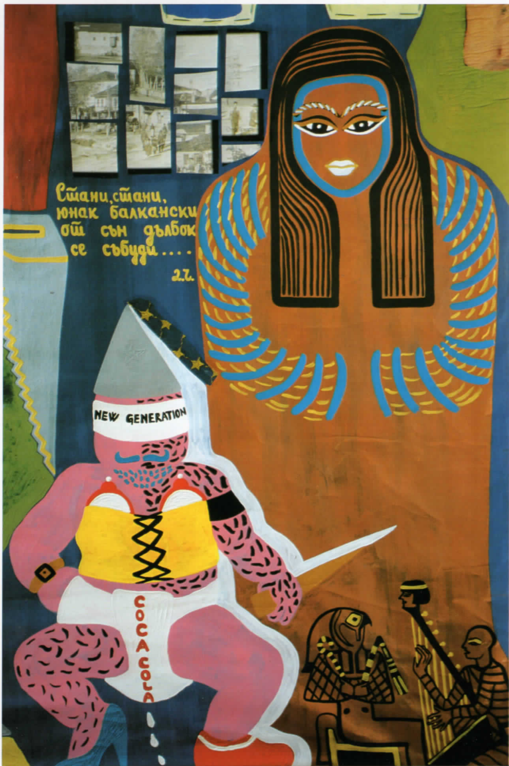
Тејовирани - йродадени души - акрилик-комбинирана техника - йлайно 2002(2м/2м)