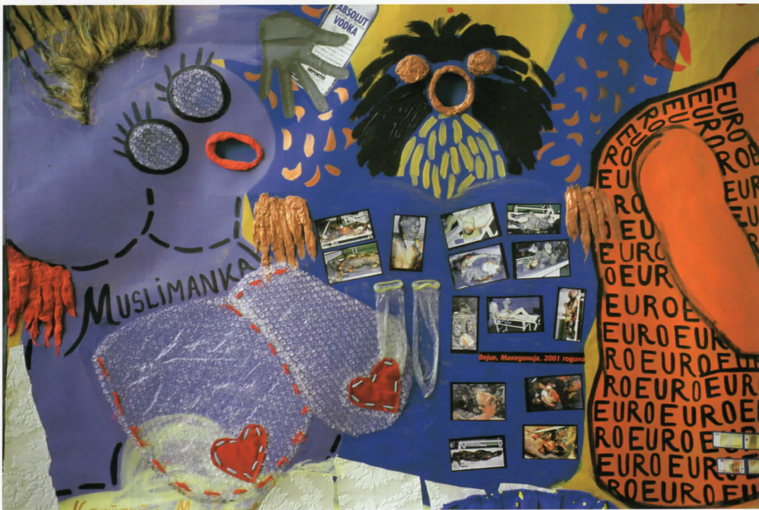
Ајсолујино оицјанејџи - акрилик комбинирана тџехника -џлајџино 2002 (2м/2м)