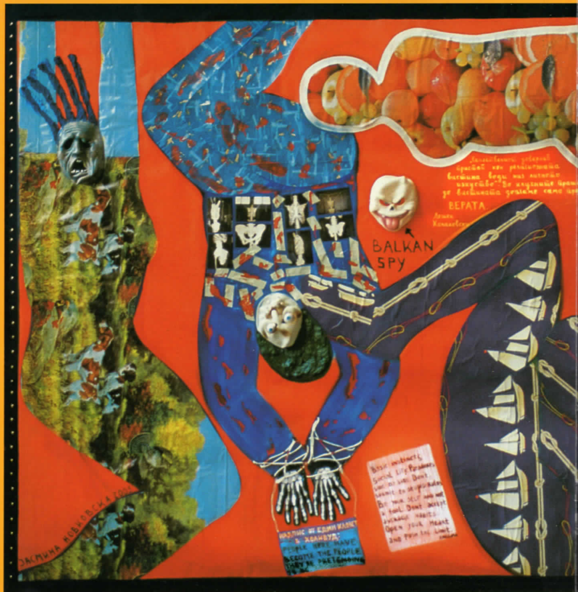
Балкански предавник - акрилик-комбинирана техника - џлајино 2003 (2м/4м)