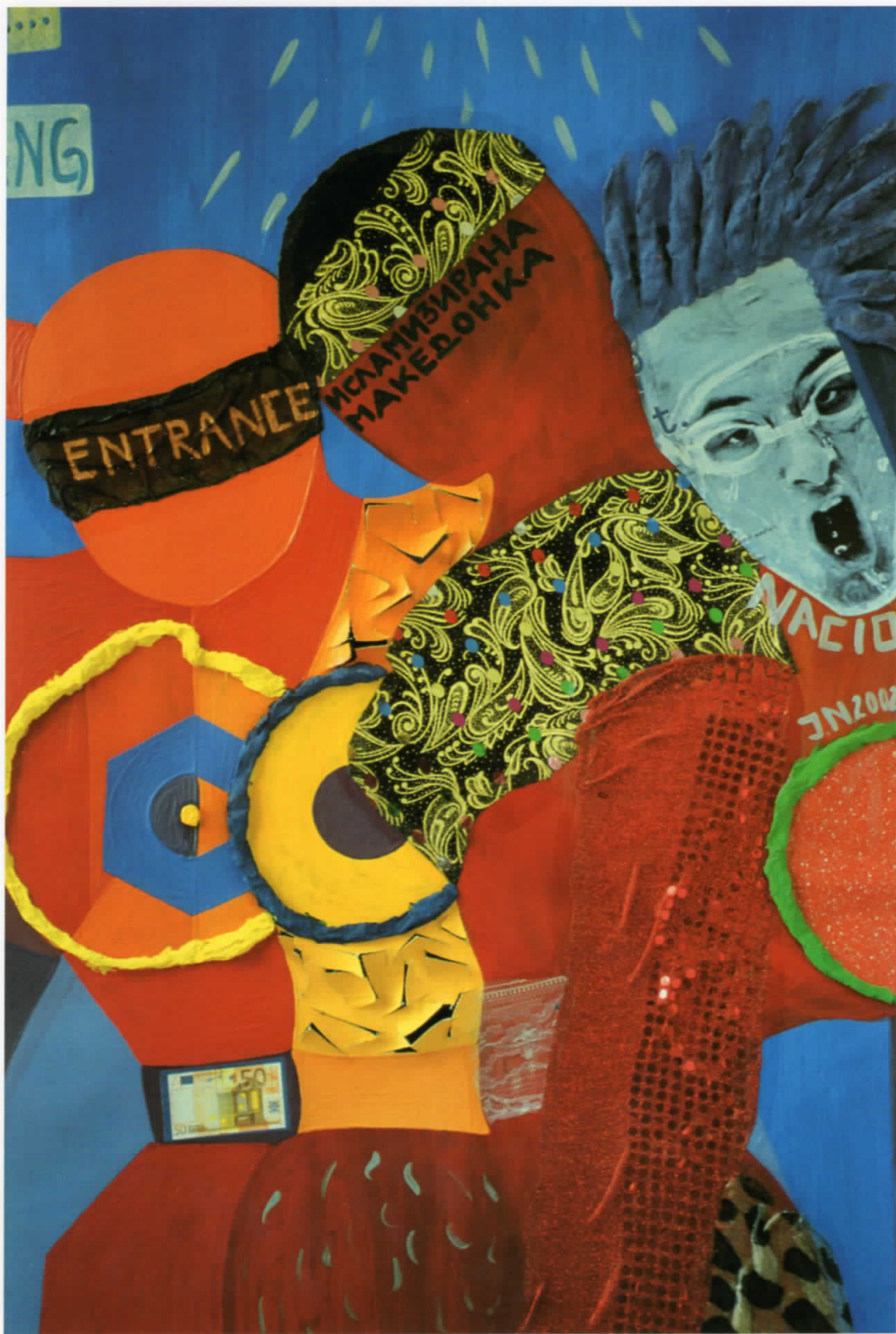
Државно глобално WC -акрилик комбинирана техника - илајно 2002 (2м/2м)