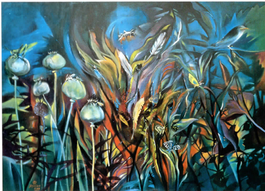
ПРЕБЛИКНАТА, ИЛИ ЗАСПАЛЕ АФИОНИ