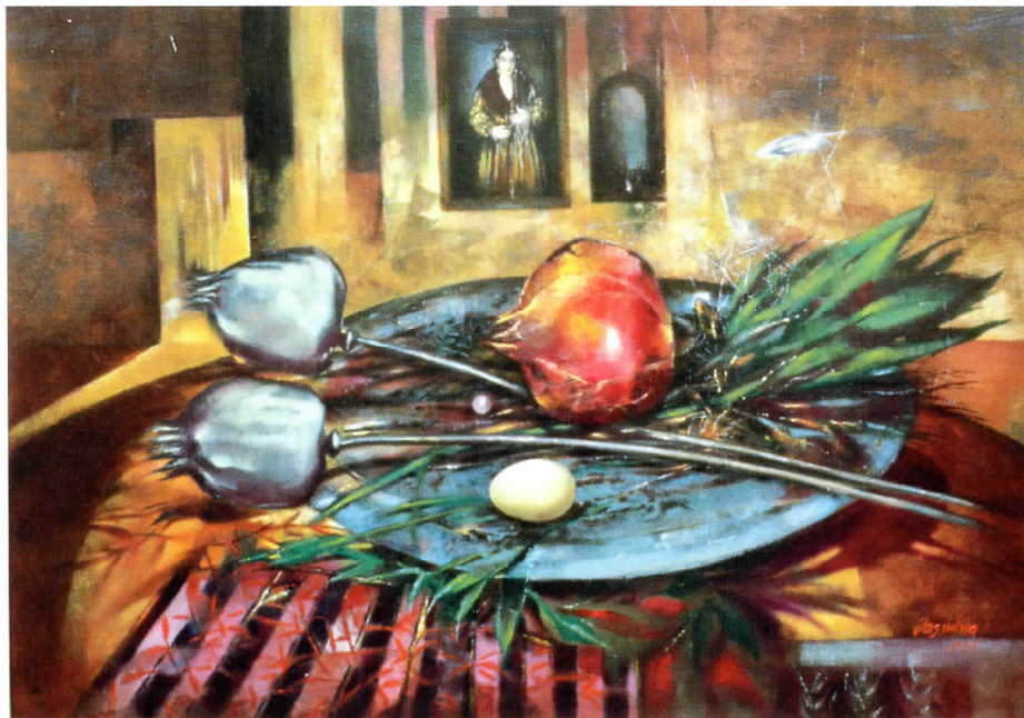
ДОМОТ НА НЕПОЗНАТАТА