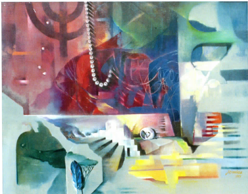
СОСЕМ ТИВКО ЗАПРЕНА НАПНАТОСТ