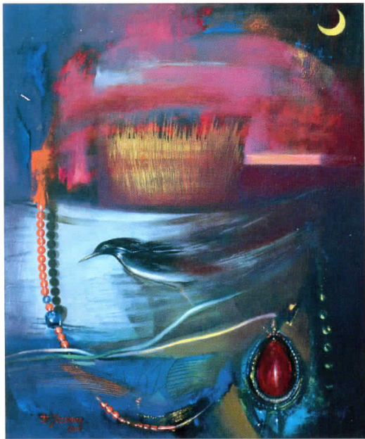
НОЌ СЕ РАЗЛЕА