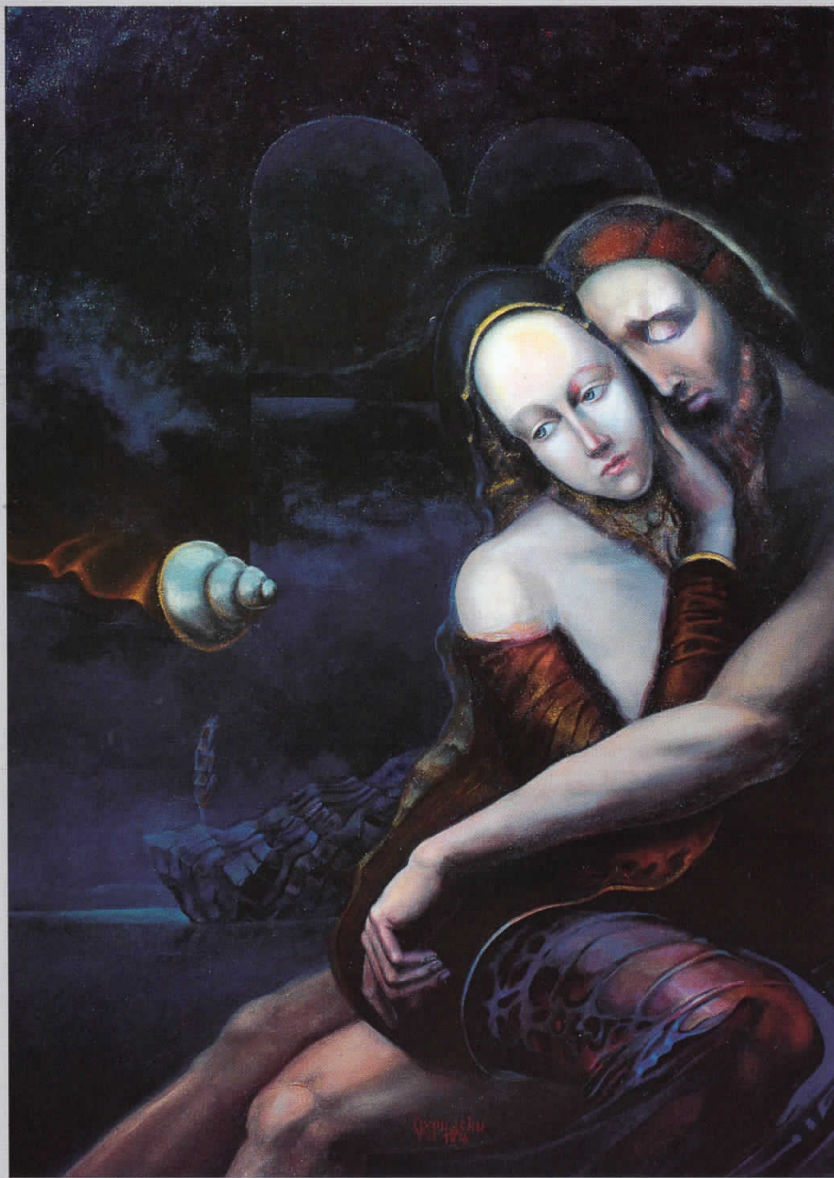
Иако од шеќер, твојој дар нож е, 1996, акрил на платно, 106x75 cm Although of sugar, your gift is a knife, 1996, acryl on canvas, 106x75 cm

Податок за авторот преземен од корицата. - Текст напоредно и на англ. јазик. - Драган Спасески - Охридски: сликар на носталгијата / Борис Петковски—Dragan Spaseski - Ohridski: The painter of nostalgia / Boris Petkovski: стр. 4-10