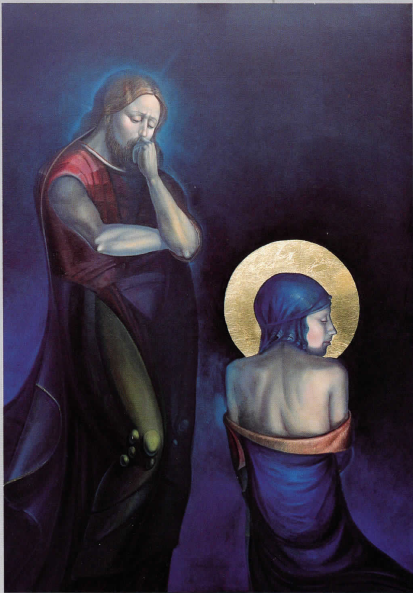
После гревойі, 1997, масло на йлаїно, 106x75 см After the sin, 1997, oil on canvas, 106x75 cm