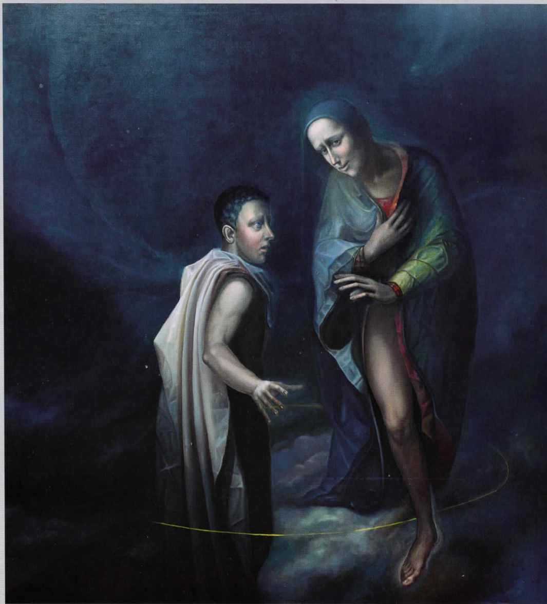
Благовештєние, 1999, масло на ѓлайно, 220x200 см Annunciation, 1996, oil on canvas, 220x200 cm