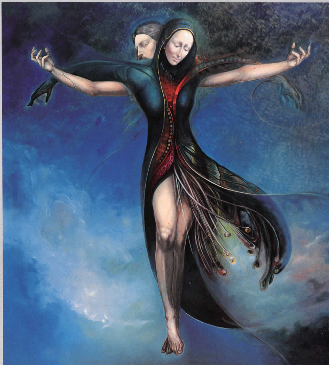
Распятие на любви, 1998, масло на холсте, 220x200 см Crucifixion of love, 1998, oil on canvas, 220x200 cm