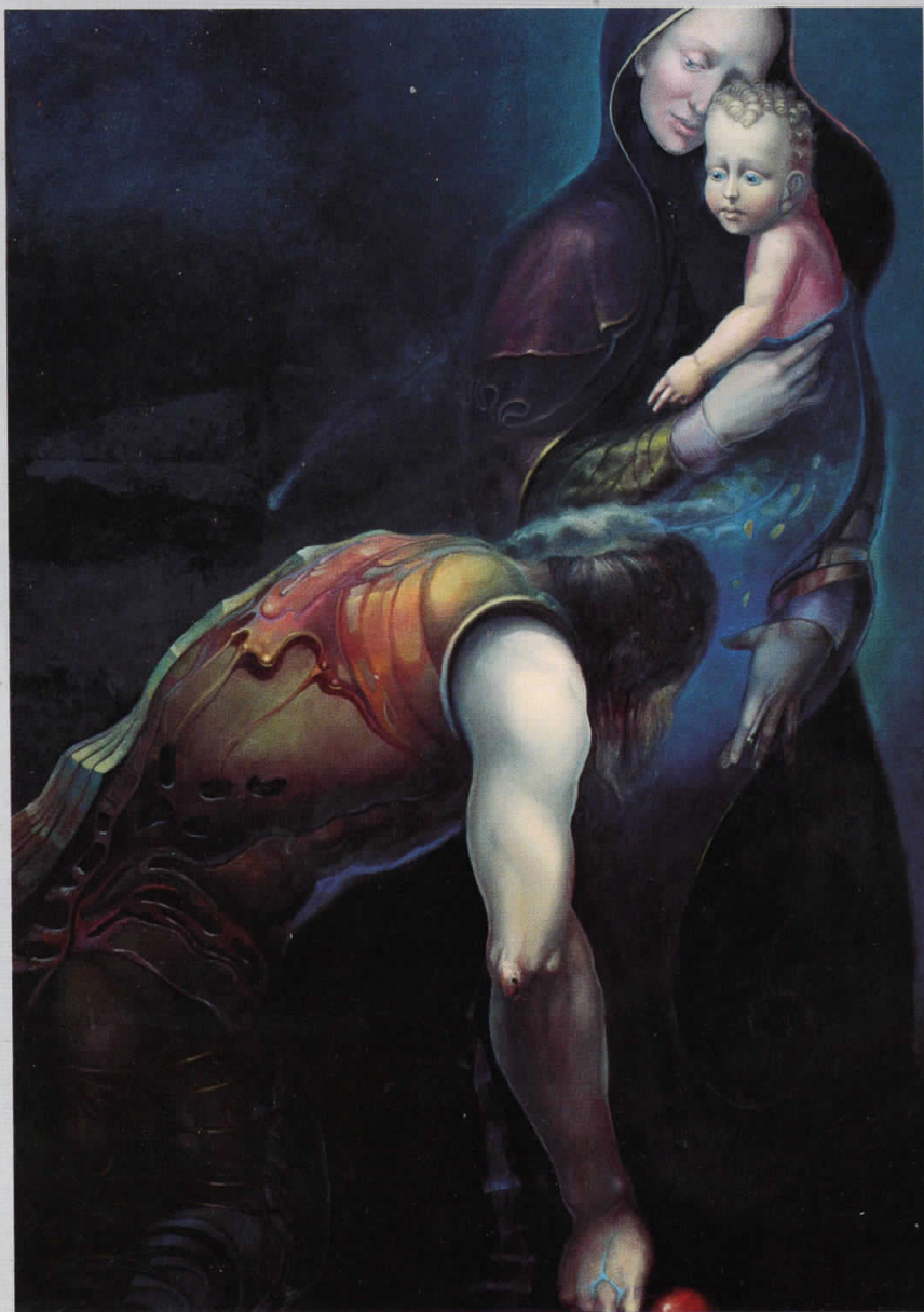
Враќањето на блудниот татко, 1997, масло на платно, 106x75 cm The returning of the prodigal father, 1997, oil on canvas, 106x75 cm