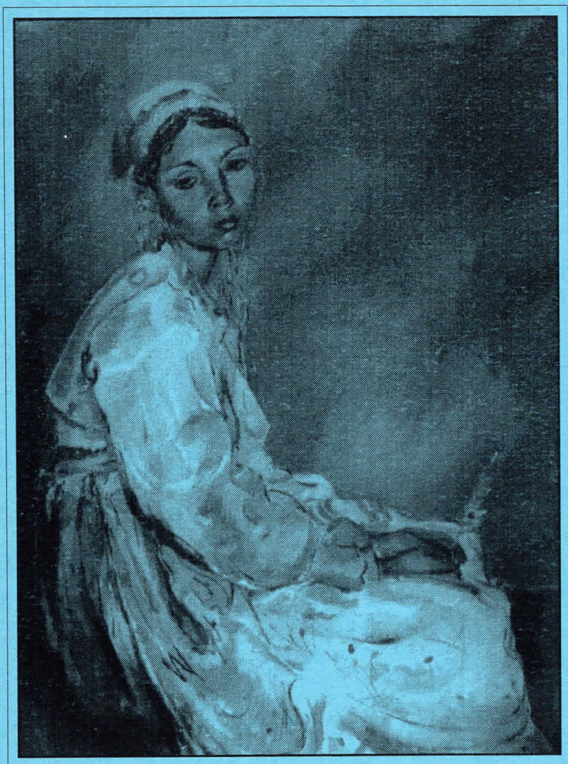
Никола Мартиноски, "Невеста" 1937