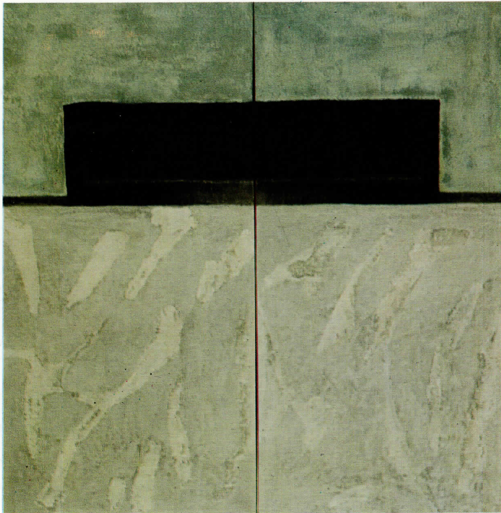
Од циклусот "Кланфа 1", 1994 комбинирана техника на платно, 209x204