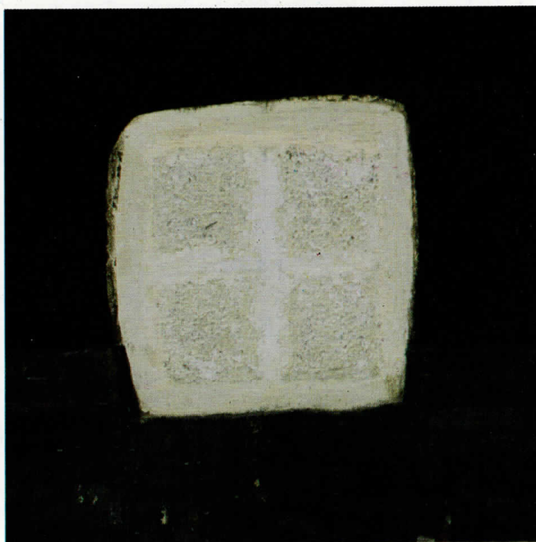
Од циклусот "Крстови II", 1993 From the Cycle "Crosses II", 1993