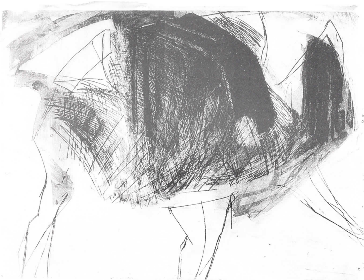
Проект Алвион 1990 Project Alvion