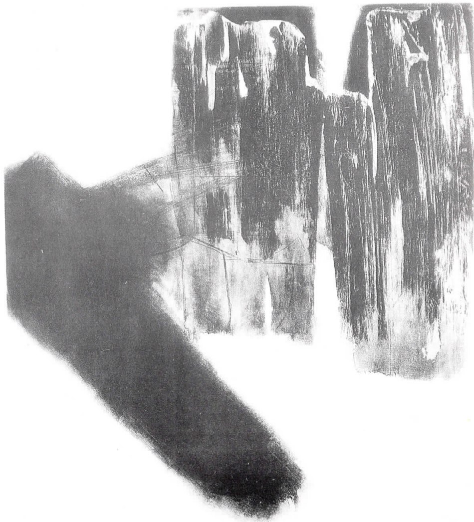
Самоил и ... 1992 Samoil and ...