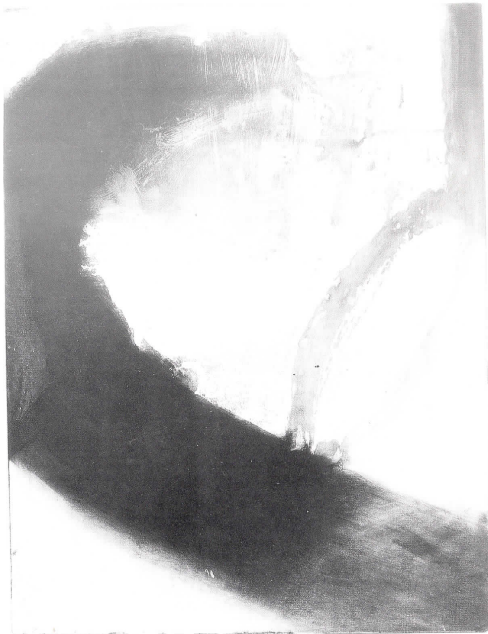
Срфер 1992 Surfer