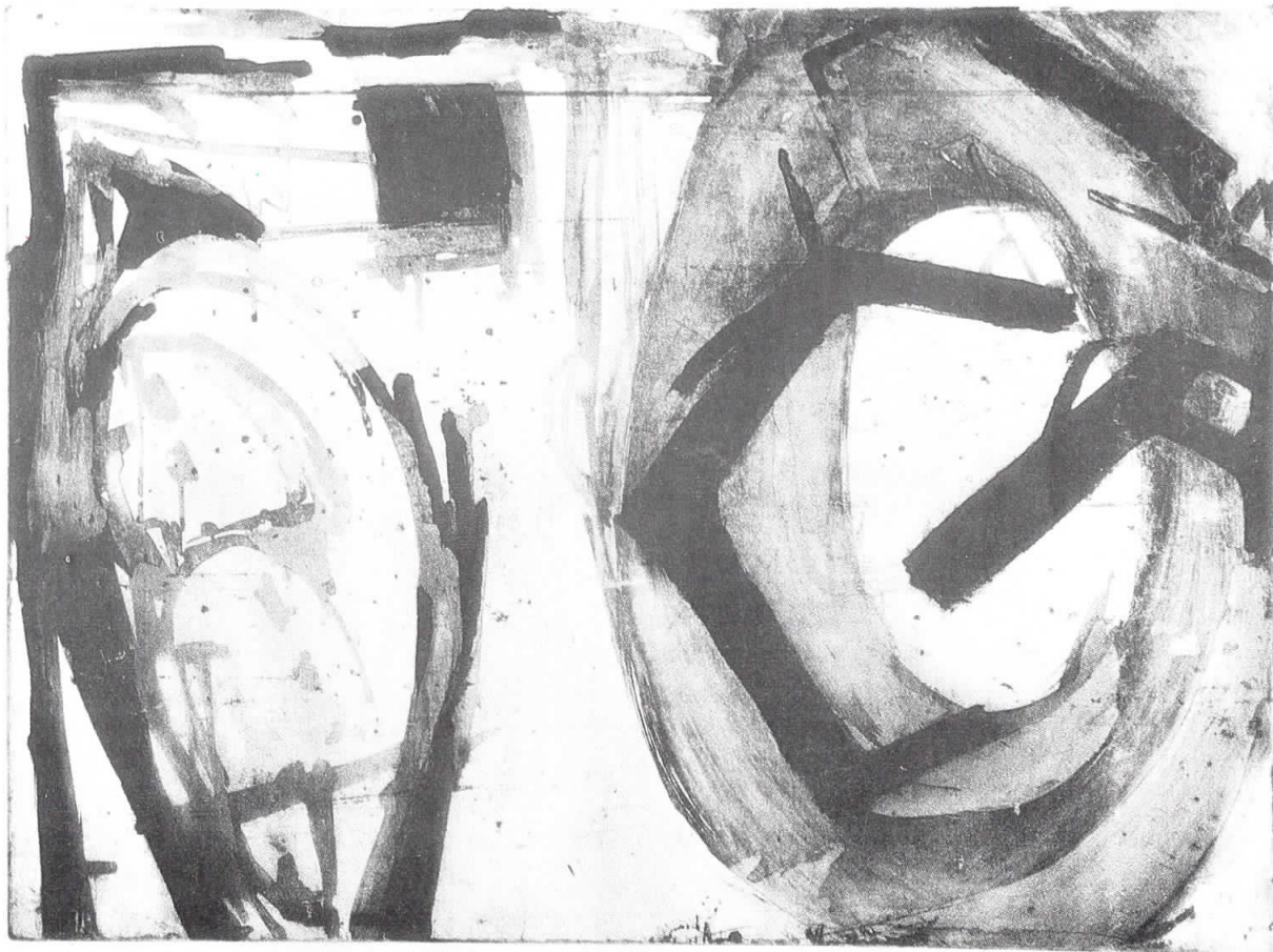
Без наслов 1992 No Title