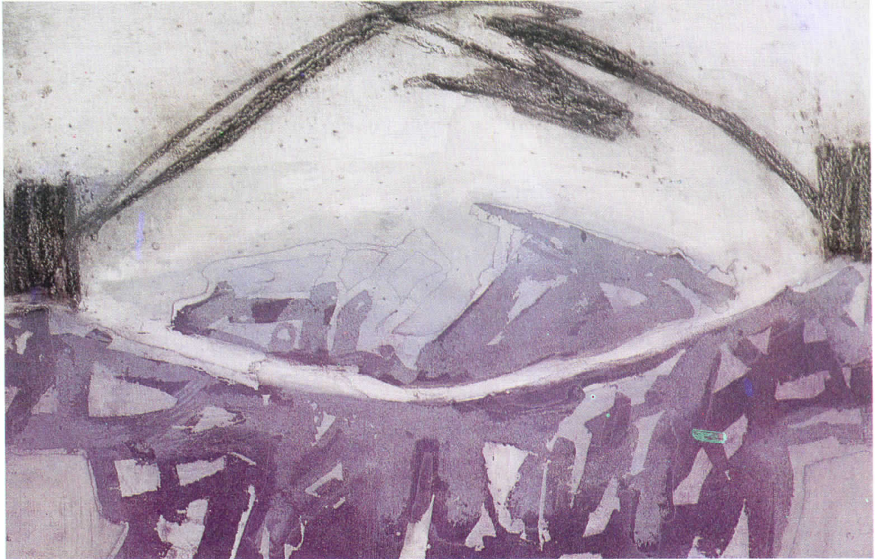
Сива 1991 Gray