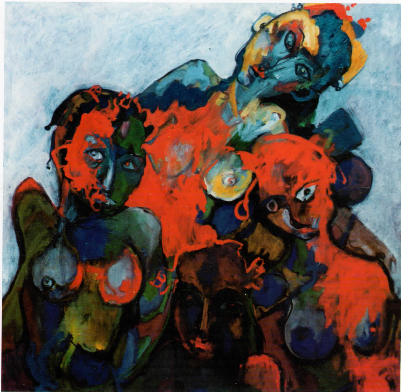
1. Фамилија, масло на платно – Family, oil on canvas 86 × 87 cm