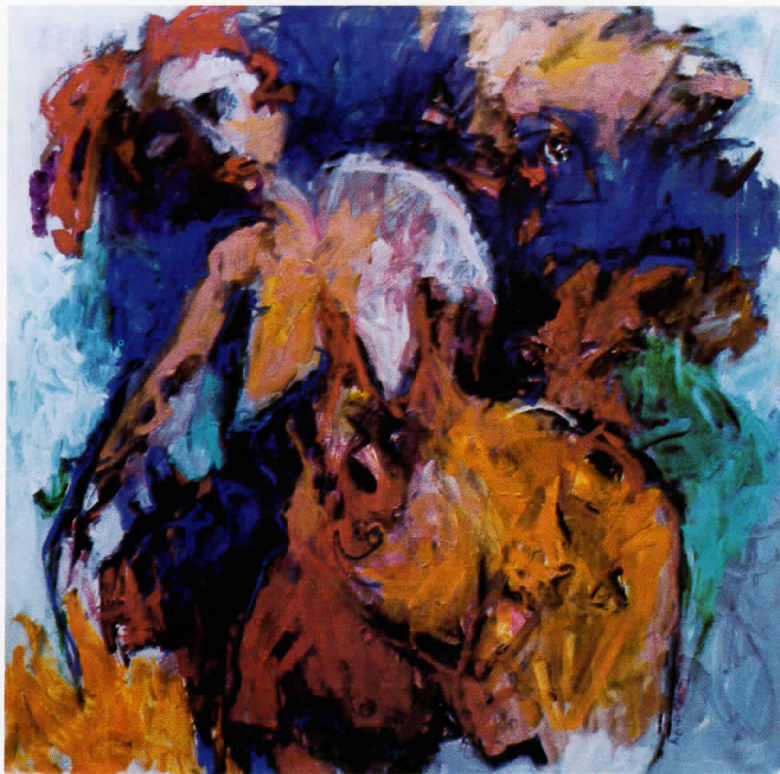
20. Меланхолија, масло на платно – Melancholy, oil on canvas 102 × 102 см