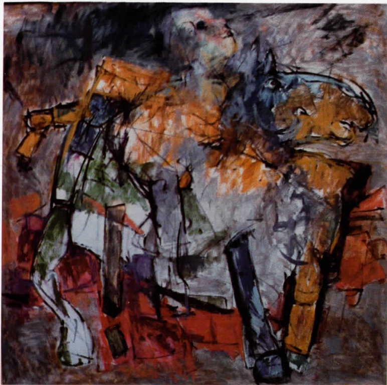
10. Џокеј, масло на платно – Jokey, oil on canvas 102 × 102 см

Adress: Kapištec nb. 22 Skopje tel: 207-266