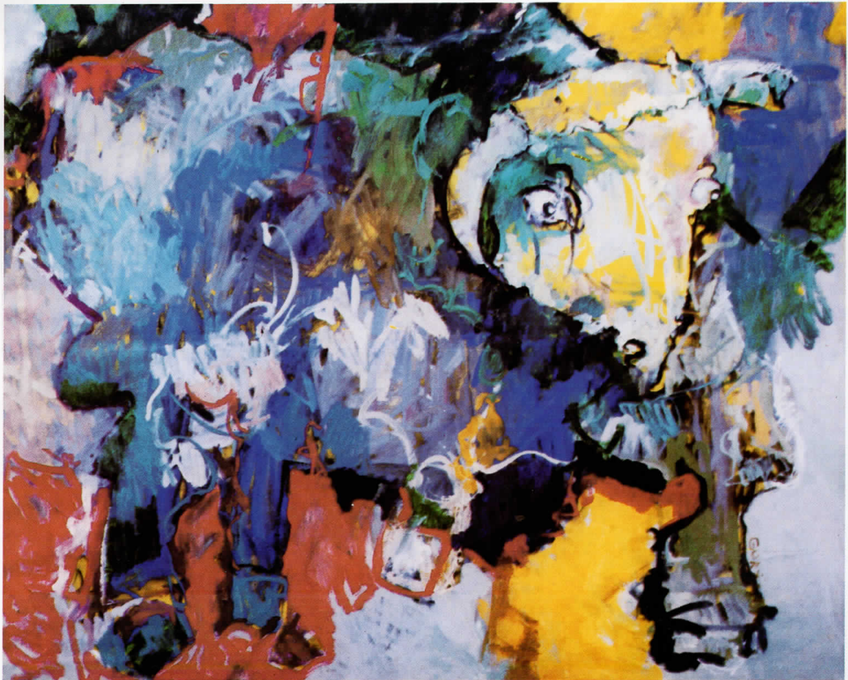
12. Бик, масло на платно – Bull, oil on canvas 70 × 81 см