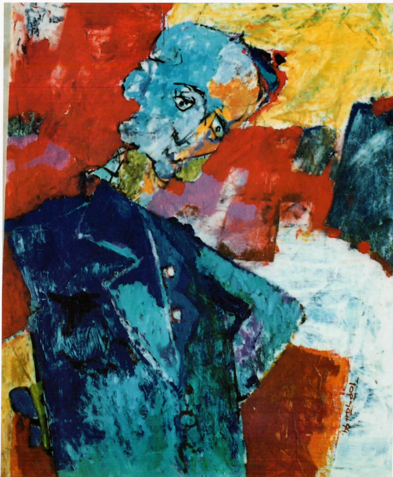
24. Господин, масло на платно – Gentleman, oil on canvas 85 × 70 cm