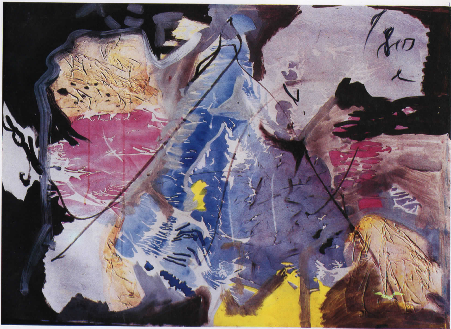
КОМПОЗИЦИЈА I, 1989/COMPOSITION I