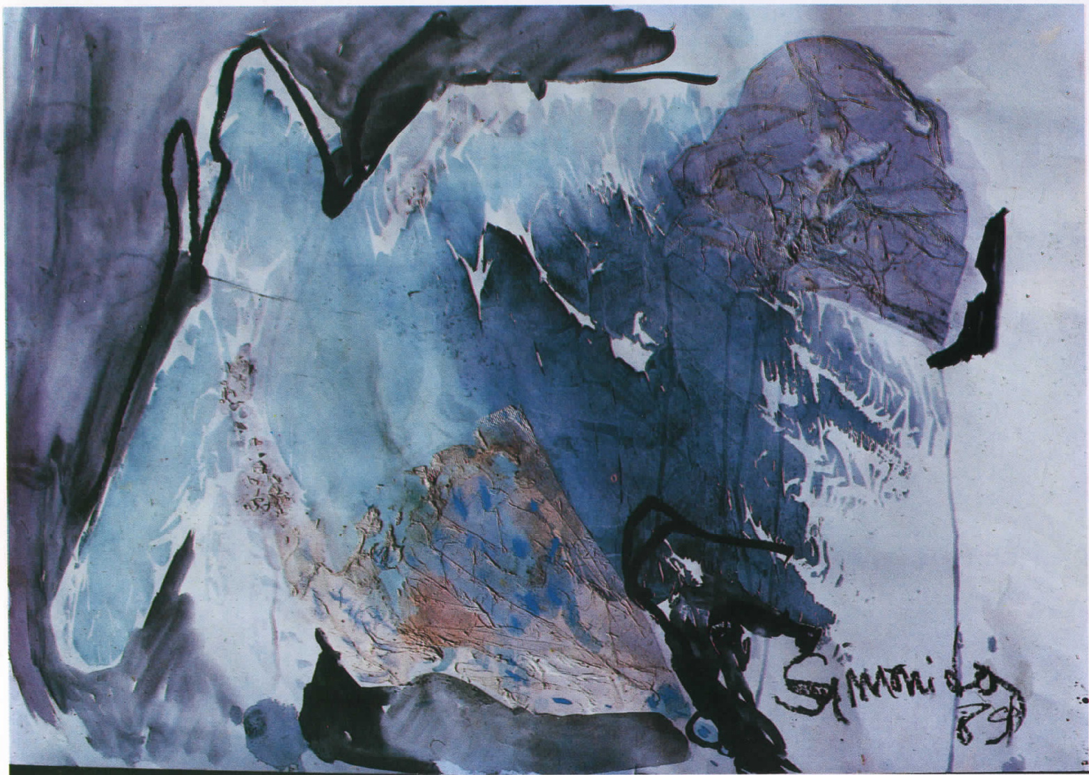
КОМПОЗИЦИЈА II, 1989/COMPOSITION II