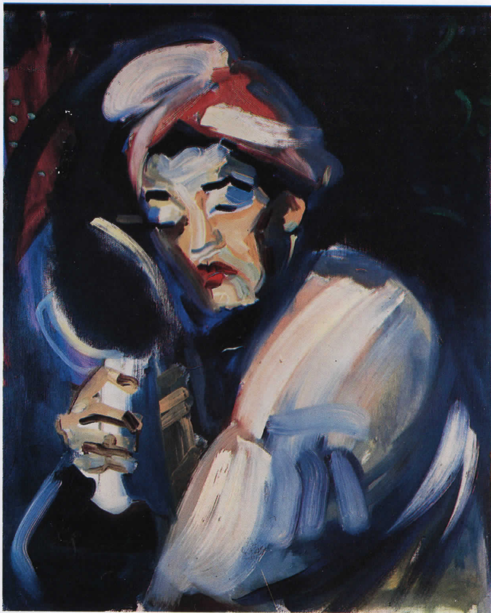
БОНИТА, 1988/ BONITA