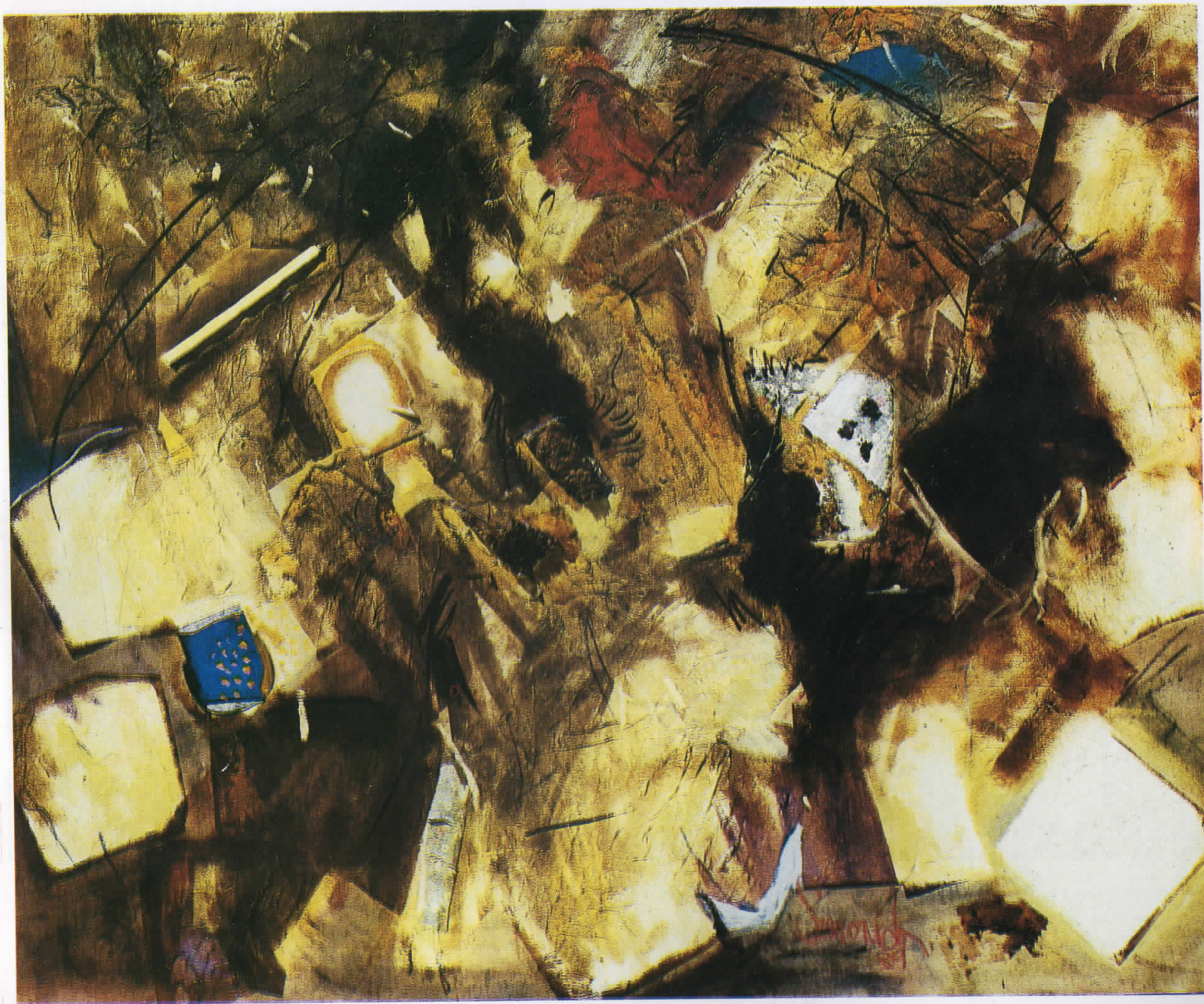
ЕСЕНСКИ РИТАМ, 1990/AUTUMANAL RHYTHM