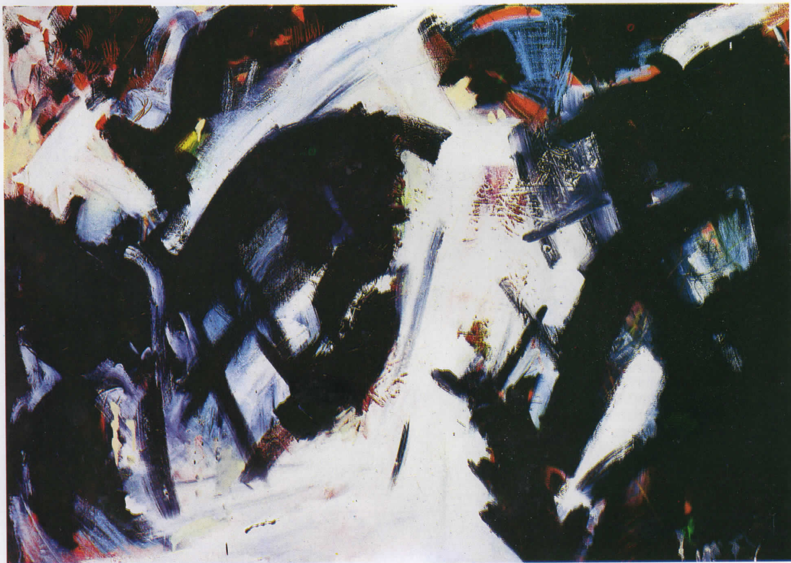
КОМПОЗИЦИЈА, 1990/ COMPOSITION