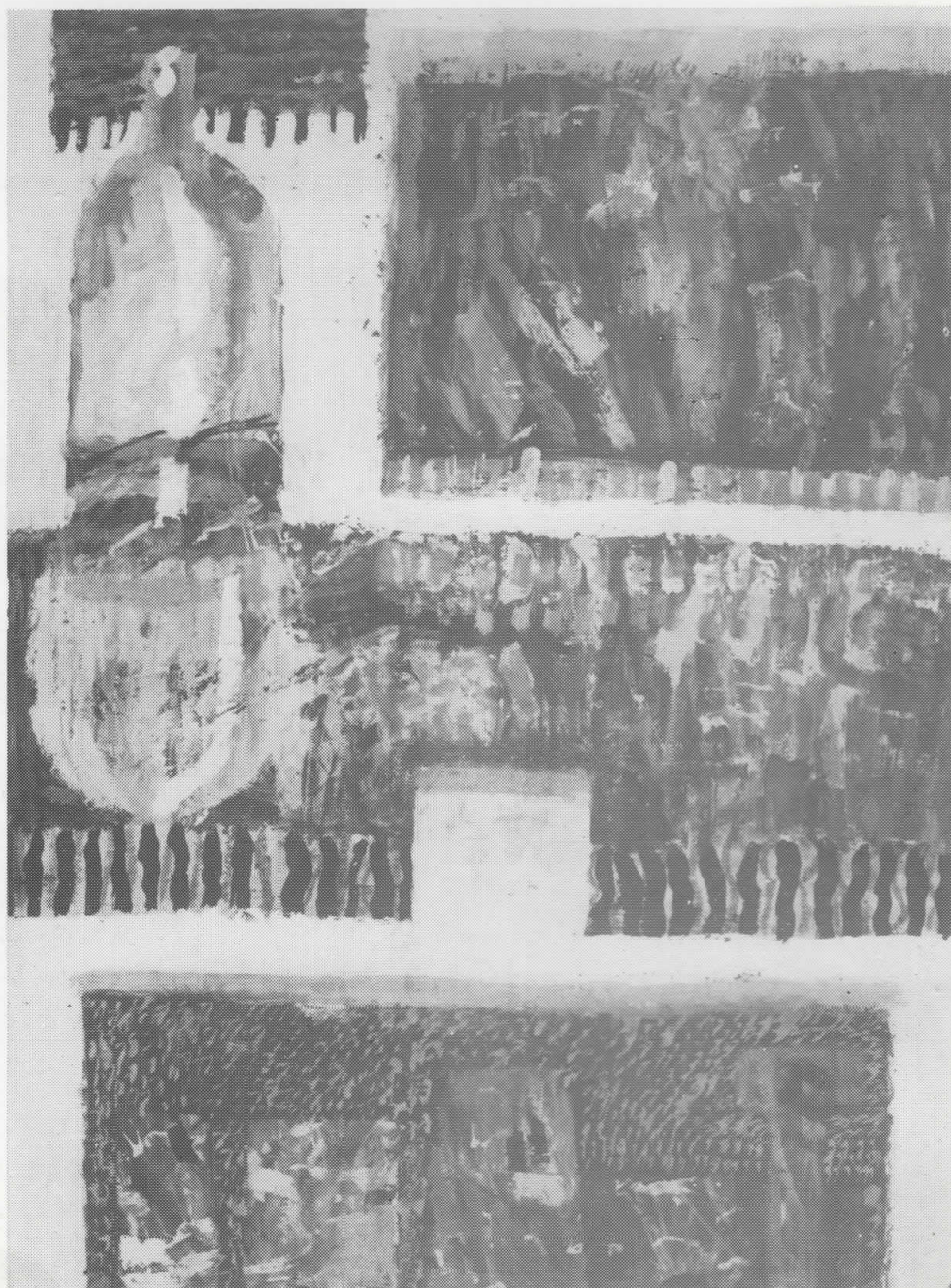
iz cirkusa »Igra folklornih elemenata«