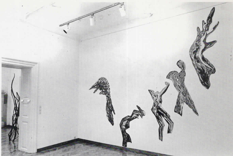
Dragan Petković, Iz ciklusa »La Joie De Vivre«, 1985

1. Iz ciklusa »LA JOIE DE VIVRE«, 1985, lak-boje/karton