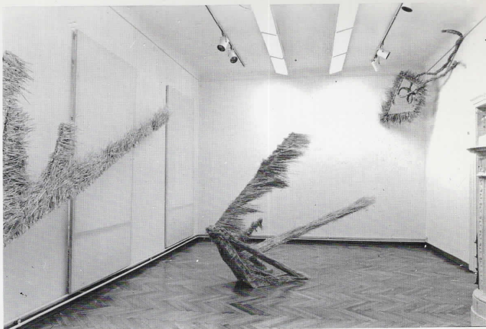
Gligor Stefanov, Objekti iz ciklusa Zmajevi, 1984/85