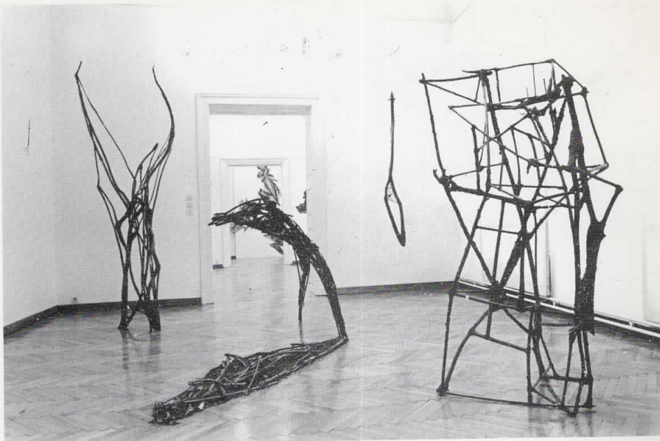
Petre Nikoloski, Objekti iz ciklusa Prostori, 1985