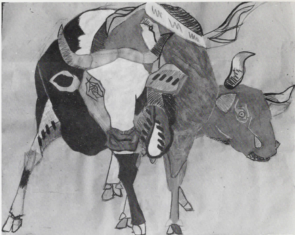
Dimitar Manev, Crtež II, 1985