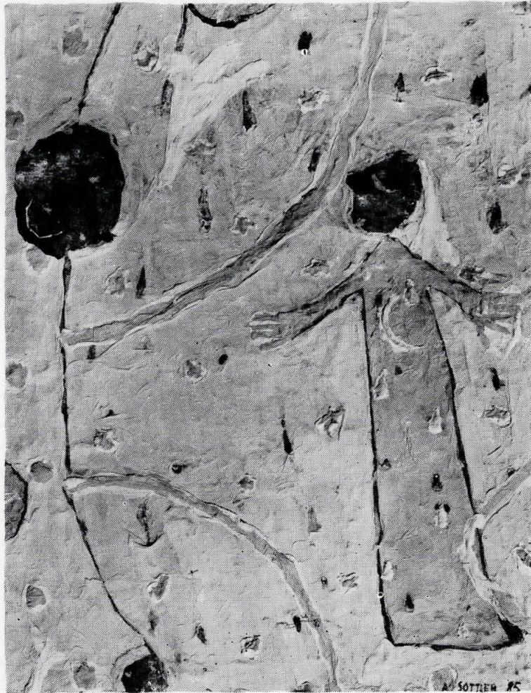
Солнечный дождь, коллаж, 75 x 100