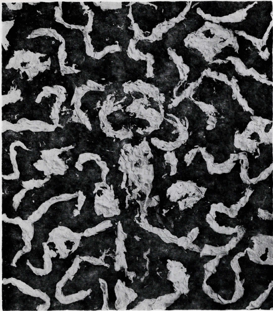
„Последен снег“, колаж, 120 x 140