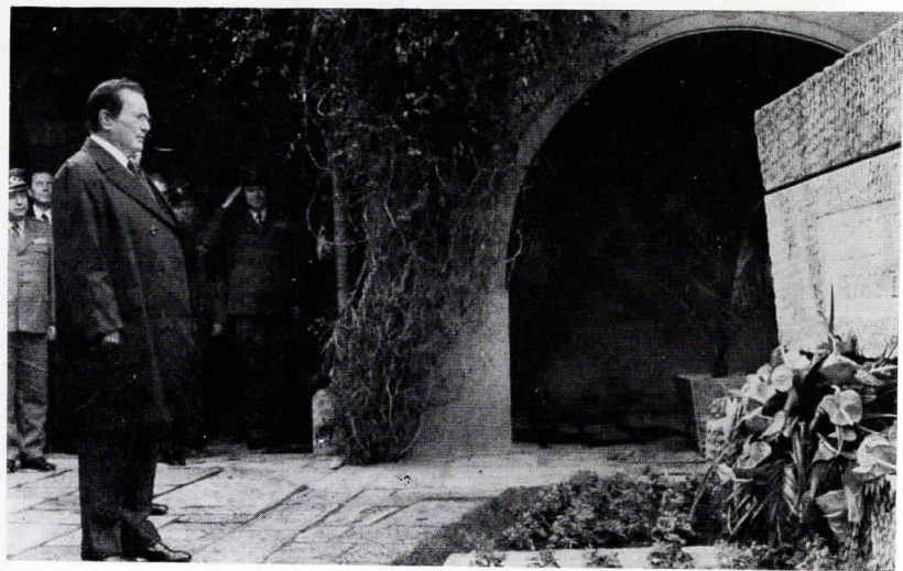
Почит на македонскиот великан Гоце Делчев