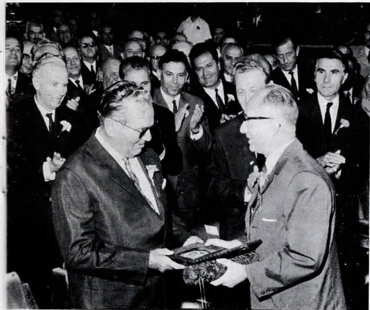
Претседателот Тито ја прима Повелбата и Златната споменица на АСНОМ, Скопје 2.VIII.1969 година