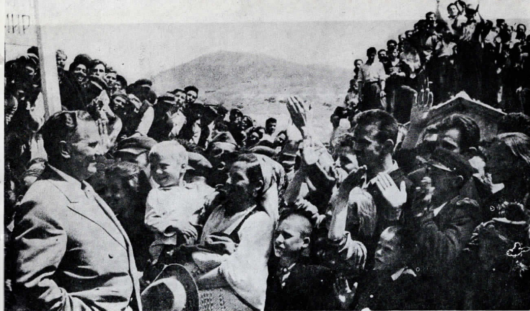
Секогаш меѓу луѓето — са- кан и почитуван