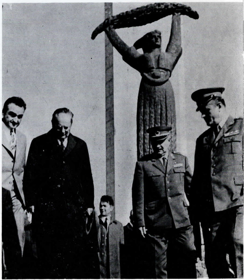
Пред Спомен-костурницата на паднагите борци во НОВ во Куманово