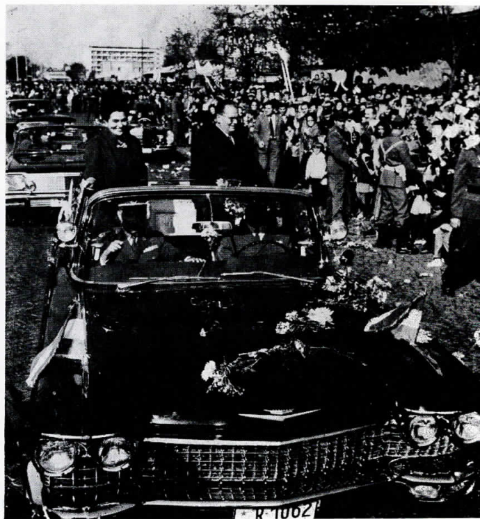
Насекаде пречекуван со воодушевување, љубов и цвеќе