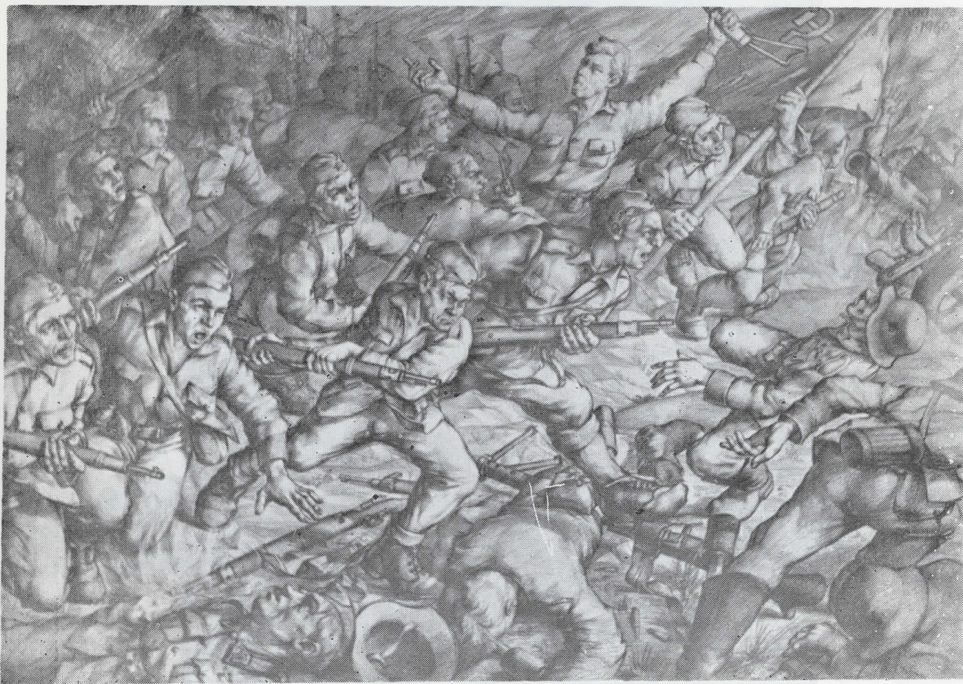
Радмило Поповски — Партизански јуриш