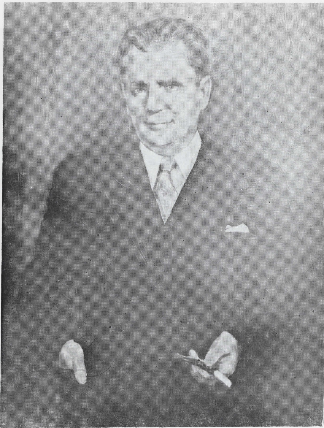
Лазар Личеносни — Портрет на Тито