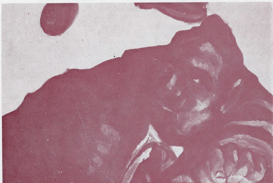
Бр. 22 (детал)