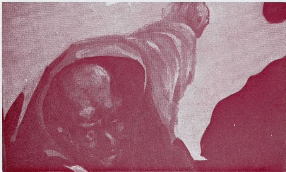
Бр. 22 (детал)