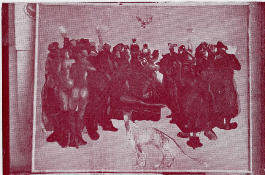
Бр. 24 кат. број