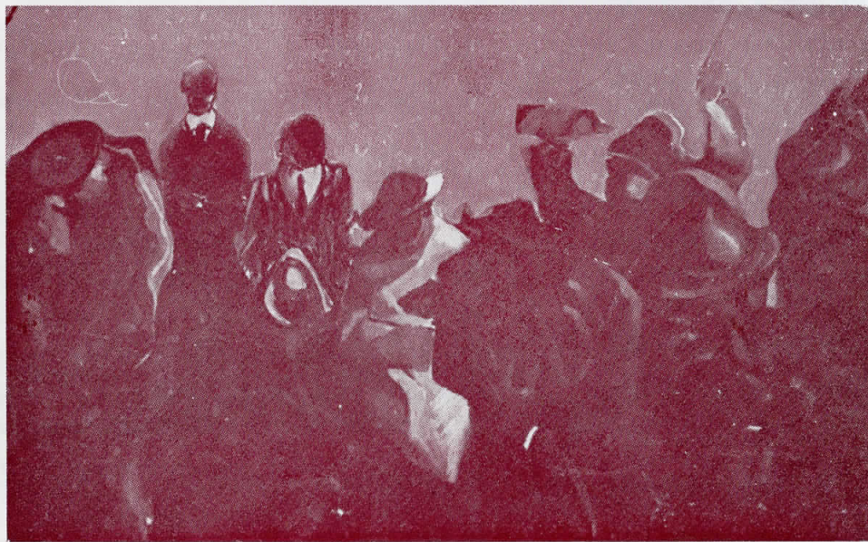
Бр. 24 (детал)