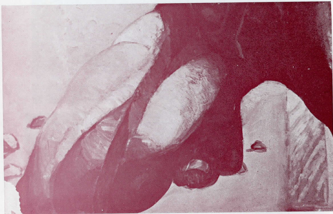
Бр. 11 (детал)