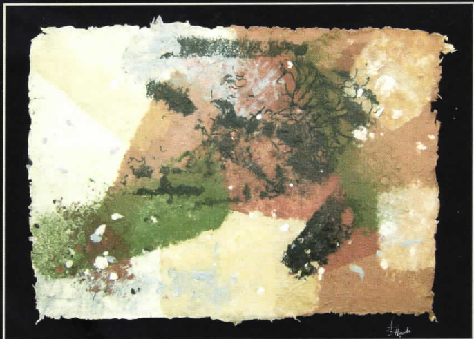
АКОРДИ • 81 X 63 •