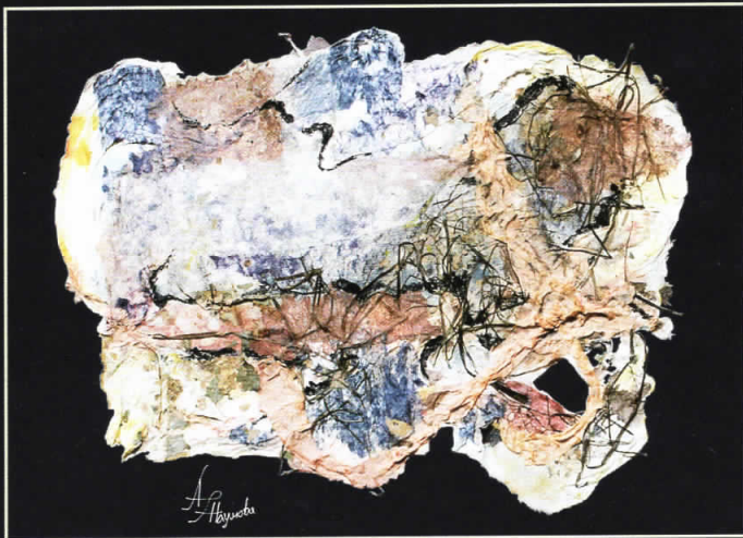
3 АВГУСТ • 77 X 58 •