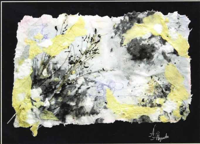
СОН ВО МУГРИ • 57 X 46 •