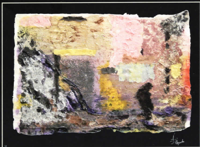
ПРЕСУДЕН ЧЕКОР • 67 X 52 •