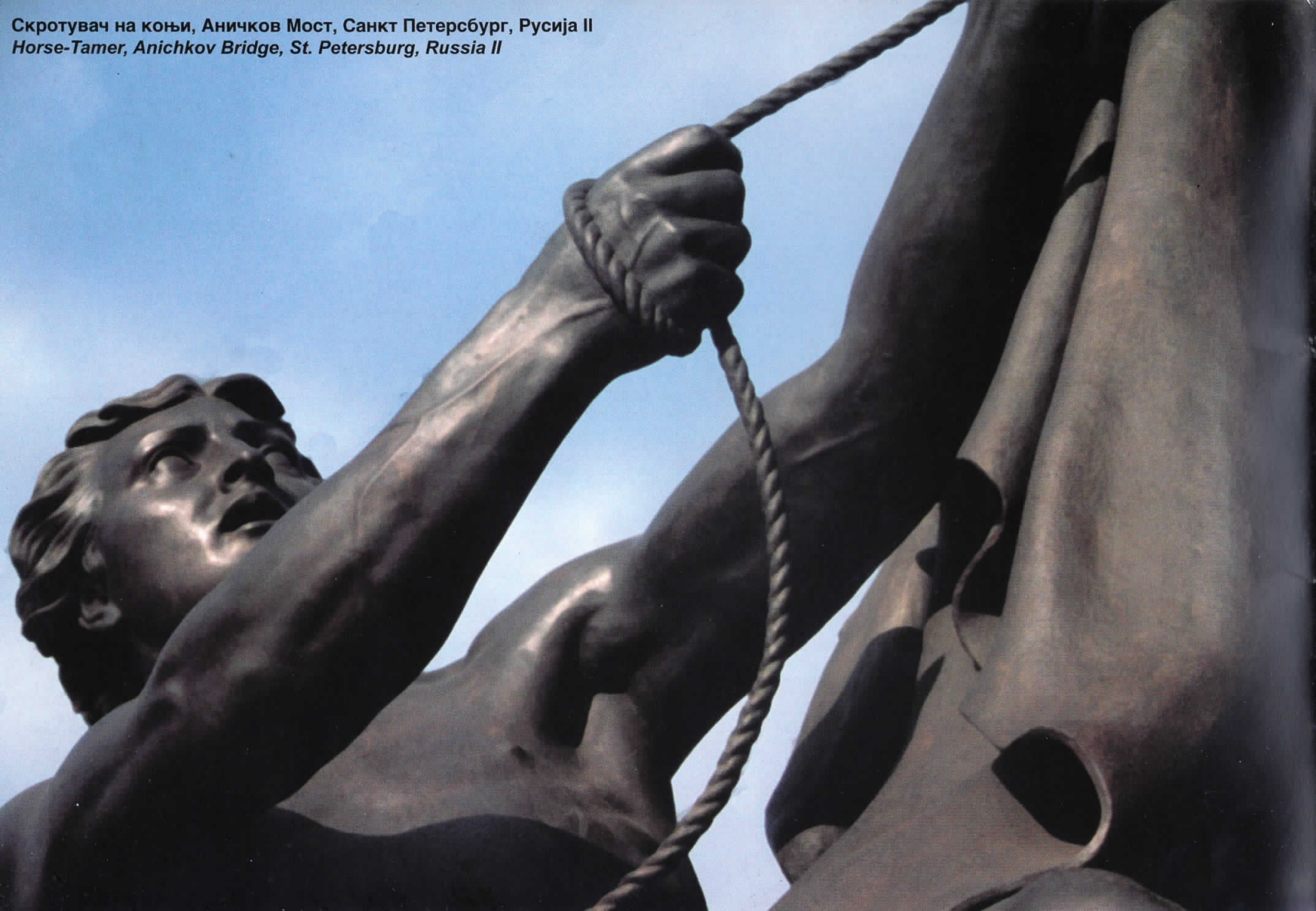
Скротувач на коњи, Аничков Мост, Санкт Петербург, Русија II Horse-Tamer, Anichkov Bridge, St. Petersburg, Russia II