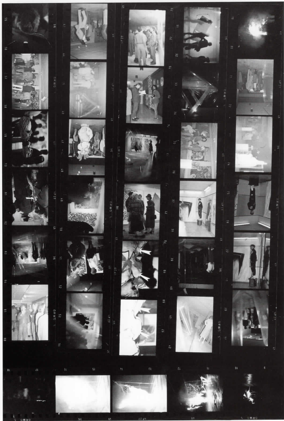
Од изложбата "Експресија, жесиј, акција", 1985, Музеј на Македонија, Скопје