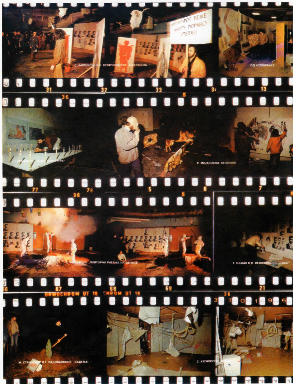
Од манифестацијата „Нови Појави...“, 1984, Дом на млади, Скопје